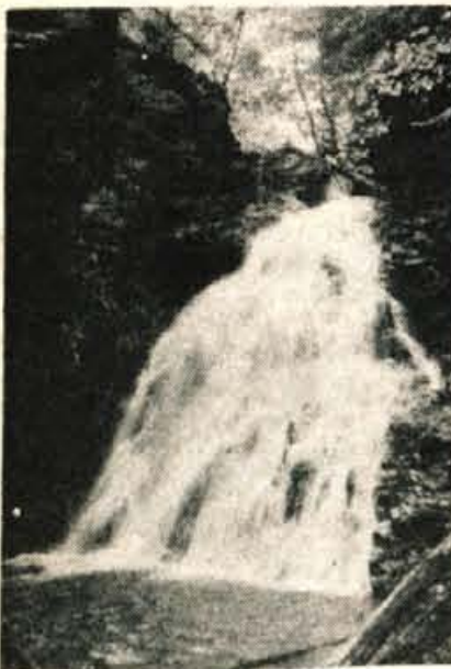
Slap Sum, največja besniška zanimivost. Bolj kot doslej bi ga kazalo približati ljudem.