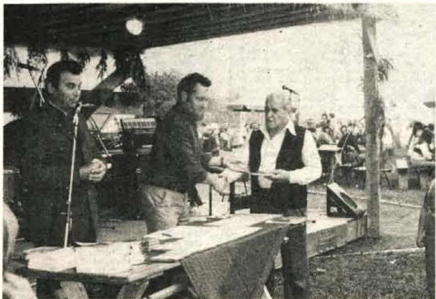
Na letošnji razstavi cvetja so podelili tudi priznanja