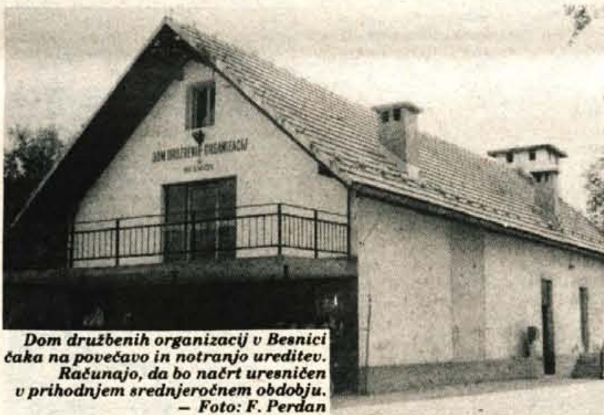
Dom družbenih organizacij v Besnici čaka na povečavo in notranjo ureditev. Računajo, da bo načrt uresničen v prihodnjem srednjeročnem obdobju.

Svet krajevne skupnosti, družbenopolitične organizacije in društva čestitajo krajanom za praznik!