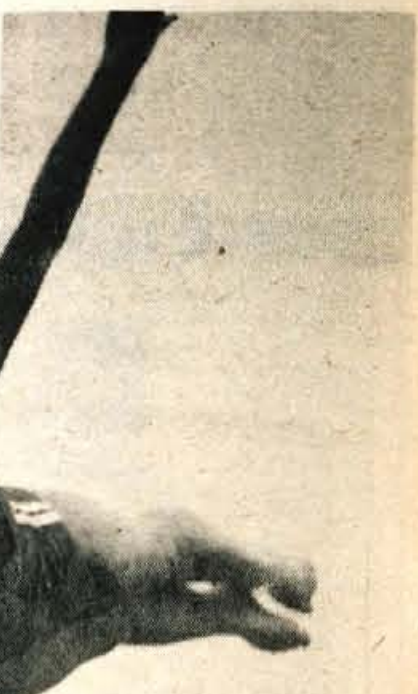
Na mednarodnem tekmovanju v skokih v vodo na Jesenicah so se dekleta pomerila tudi v skokih z desk.

Rezultati - ženske - stolp - 1. Bush (Kanada) 303,50, 2. Lazarevič (Jugoslavija) 289,05, 3. Fuller (Kanada) 281,35, moški - deska - 1. Geller (Kanada) 439,10, 2. Mustafa (Egipt) 421,40, 3. Spudic (ZRN) 418,76, 8. Grgurevič (Jugoslavija) 329,05; ženske - deska - 1. Spudic (ZRN) 350,25, 2. Bernier (Kanada) 343,70, 3. Piotraschke (ZRN) 334,15, 12. Trajković (Jugoslavija) 282,95, moški - stolp - 1. Geller (Kanada) 409,40, 2. Mustafa (Egipt) 384,85, 3. Schepers (ZRN) 379,17, 7. Bacon (Jugoslavija) 333,50. J. Rabič