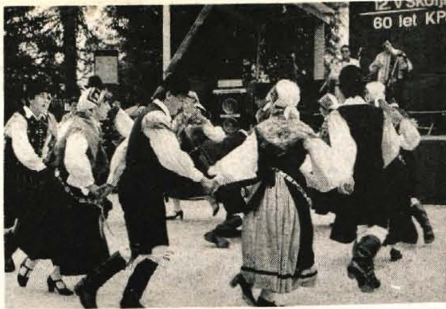
Med izseljenci je bilo tudi veliko naših zdomcev, predstavniki Porabskih Slovencev in s Škofjo Loko pobratene občine Sele na Koroškem. Med številnimi skupinami se je predstavila folklorna skupina Ljubljana iz Essna, ki združuje naše delavce, začasno zaposlene v tujini.