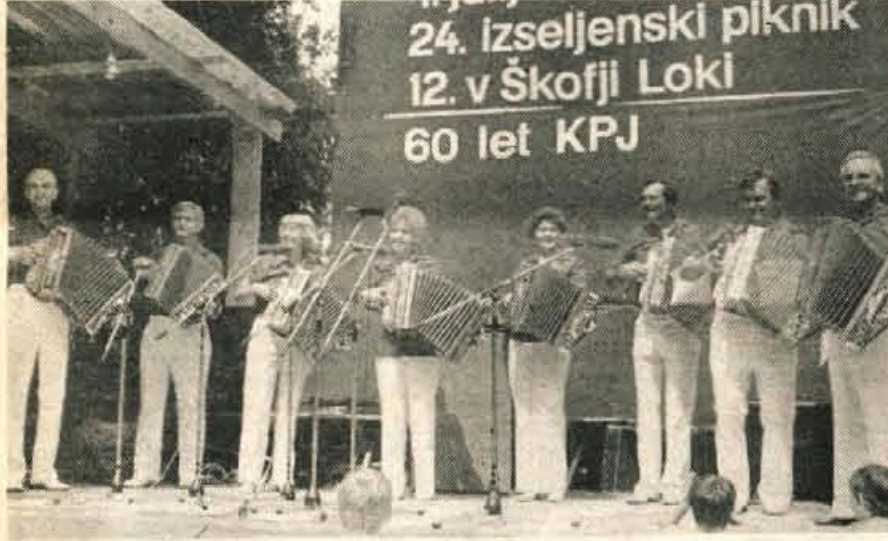
Iz daljnega Chicaga je prišel Čikaški slovenski harmonikarski klub in požel navdušeno ploskanje zbranih rojakov, borcev in občanov.