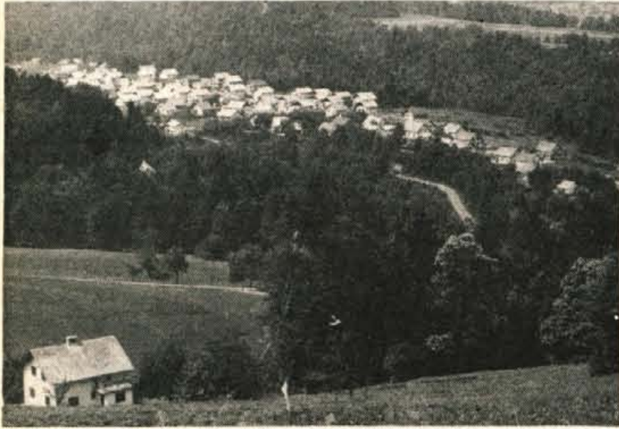
Iz Zabukovja se ponuja takšen pogled na novo naselje Pešnica. Nad 100 stanovanjskih hiš je zadnja leta že zrastle, ob njih pa silijo od tal še nove

V Besnici je večina najbolj prometnih poti in cest že asfaltiranih, po obnovi pa kličejo ceste v oddaljene kraje in zaselke ter cesta proti Kranju, ki je že ozko grlo — V mrzlem in pretesnem domu ni prijetno — Nezanimanje za gradnjo trgovine v Besnici