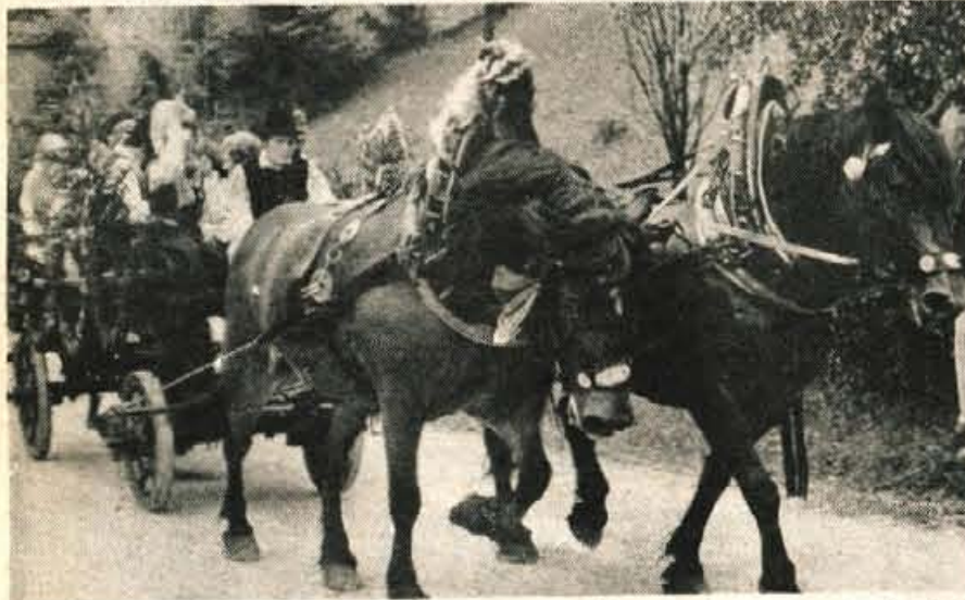
Domači fantje in dekleta so rojake sprejeli na Mestnem trgu, jim pripeli rdeče nageljne in jih na okrašenih vozovih odpeljali na loški grad. Šest parov konj je bila prava zanimivost piknika, saj jih vse redkeje vidimo na polju ali na cesti.