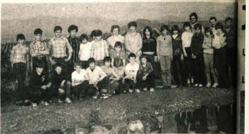
Folklorna skupina osnovne šole Matija Valjavec iz Preddvora s spremstvom

Do Beograda nam je pot kar hitro minila, saj je bilo vseskozi mnogo zanimivega in razburljivega. Najprej nas je v Trebnjem ustavila mileniška patrulja, ki je pripravljala pot za tov. Tita s spremstvom. Tisti dan je bil namenjen v Kumrovec. Postanek nam je kar prav prišel, čeprav se nismo bili daleč od doma. Za naše fante so bili seveda najzanimivejši motorji od »letečih«, ki so jih rado-vedno in poželjivo ogledovali. Kma-