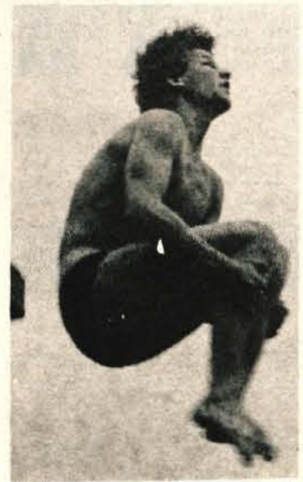
Moški so ob dnevu borca na mednarodnem tekmovanju nastopili tudi s stolpu.

JESENICE - Na letošnji mednarodni prireditvi v skokih v vodo na kopalniško Ukovo je nastopilo ob dnevu borca trideset tekmovalcev in tekmovalk iz Avstrije, ZRN, Egipta, Avstralije, Madžarske in Jugoslavije.