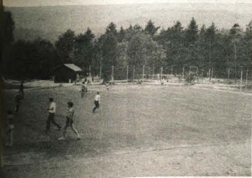
V kampu Šobec so letos opravili vrsto vzdrževalnih del, obenem pa v kampu tudi samopostrežno trgovino trgovskega podjetja Murka. V kampu imajo tudi več rekreacijskih igrišč, ki so jih letos asfaltirali.