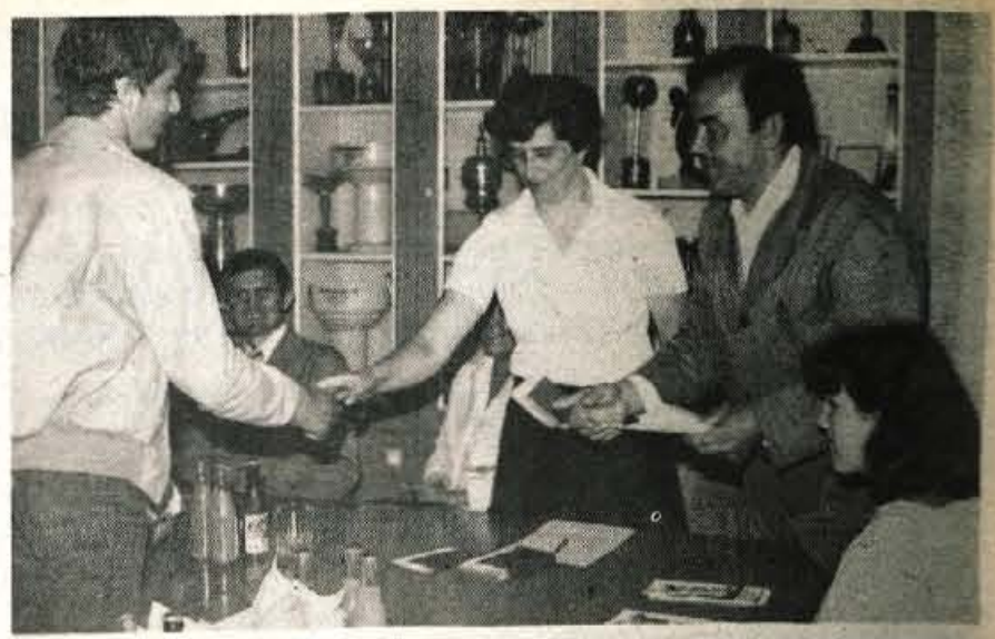
Tovarna gumijevih izdelkov Sava Kranj je letos že osmič pokrovitelj tekmovanj mladih matematikov iz višjih razredov kranjskih osnovnih šol. V soboto, 16. junija, se je v Savi zbralo 41 učencev z mentorji, kjer so jim bila podeljena srebrna Vegova priznanja. Poleg teh pa so najboljše učence, ki so zasedli 1., 2. in 3. mesto na tekmovanju, dobili hranilne knjižice z upisano hranilno vlogo, vsi ostali pa simbolična darila, izdelke tovarne Sava. Včeraj pa je Sava gostila mlade kemike z vse Gorenjske, katerim je tudi pokrovitelj že drugič. (dd)