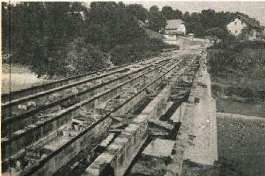
Podbrezje — Most so zaprl, tako, da ni prehoda niti za pešce, pozabili pa so zgraditi vsaj zasilnega ali primerno označiti obvoze. Prebivalci krajevne skupnosti Podbrezje so zato ogorčeni in zahtevajo, da se čimprej uredijo ustrezní prehodí preko tržiške Bistrice.

S pismom krajevne skupnosti Podbrezje so se organi izvršnega sveta in skupščine že seznanili ter sprožili postopek za raziskavo vzrokov za protest. Prve informacije bodo dane že na jutrišnji seji občinske skupščine!