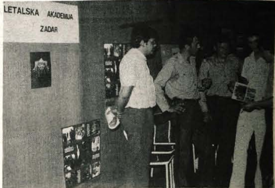
Gojenci srednje vojaške šole in vojaških akademij v pogovoru z obiskovalci razstave.