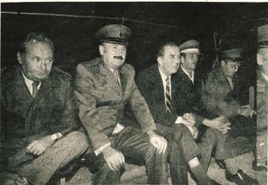
V soboto, 16. 6. 1979, so si mnogi gostje, predstavniki ObS Kranj, DPO Kranj, pokrajinskega štaba TO za Gorenjsko in JLA ogledali center za vzgojo in izobraževanje pripadnikov TO občine Kranj ter se udeležili svečanega pričetka sedemdnevnih vojaških vaj.

Celna trčenja avtomobilov so postala nekako najbolj običajen vzrok najhujših prometnih nesreč na naših cestah. To je pravzaprav presenetljivo, če vemo, da je hitrost na naših cestah omejena na 80 km na uro, le na avtocestah na 120 km na uro in na cestah rezerviranih za promet motornih vozil na 100 km na uro. Ni tako redko, da prihaja do pogostih in hujših prometnih nesreč prav v dneh, ko velja za določene številke omejitev vožnje. V takšnih dneh so ceste bolj proste, manj je prometa, možnosti za prehitavanje več; redke prometne ustvarja v vozniku varljiv občutek, da je sam na cesti, pazljivost se zmanjša, pa je nesreča tu. Zato ne kaže tudi v dneh, ko se promet zredči, pretiravati s prehitro vožnjo: bolje je upoštevati omejitve hitrosti kot tvegati življenje!