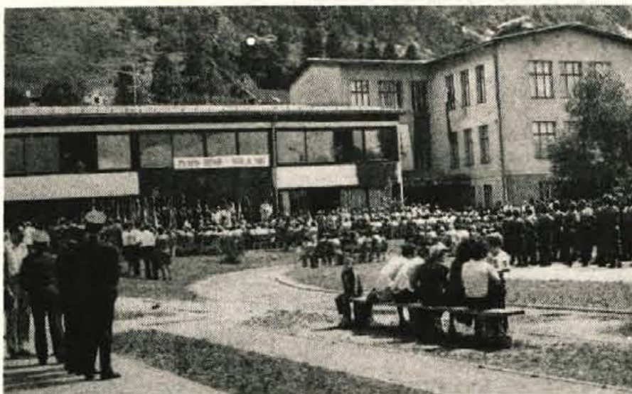
Zabreznica - Pred osnovno šolo v Žirovnici je bila svečanost, na kateri so osnovno šolo poimenovali v Osnovno šolo gorenjski odred NOV Žirovnica. Svečanosti so se udeležili nekdanji borci, granicirji, pripadniki planinske enote, predstavniki društev in organizacij ter krajanj.

Ljubljana bo dobila osrednji slovenski spomenik tovarišu Edvardu Kardelju, velikemu revolucionarju in tvorcu naše samoupravne socialistične ureditve. Spomenik bo stal na Trgu revolucije, v prihodnje pa naj bi ves Trg revolucije dobil drugačno podobo in značaj, da bi ga bolj ozelenili in umaknili z njega avtomobilsko parkirišče. Spomenik Edvardu Kardelju naj bi Ljubljana dobila že leta 1981, ob praznovanju 40-letnice ustaje.