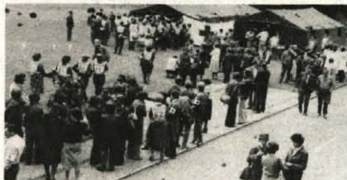
Jesenice — V soboto, 9. junija, je bilo na Jesenicah občinsko tekmovanje ekip civilne zaščite v prvi medicinski pomoči. Tekmovanje, ki sta ga organizirala občinski štab za civilno zaščito in občinski odbor Rdečega križa, se je udeležilo kar 72 ekip.

Številka glasila je zelo pestra in lepo oblikovana. Vse rubrike, ki prav gotovo zanimajo vsakega krajevanca, uredništvo si bo prizadevalo, da bi v bodočem oblikovanju glasila sodelovalo čimveč krajevanov.