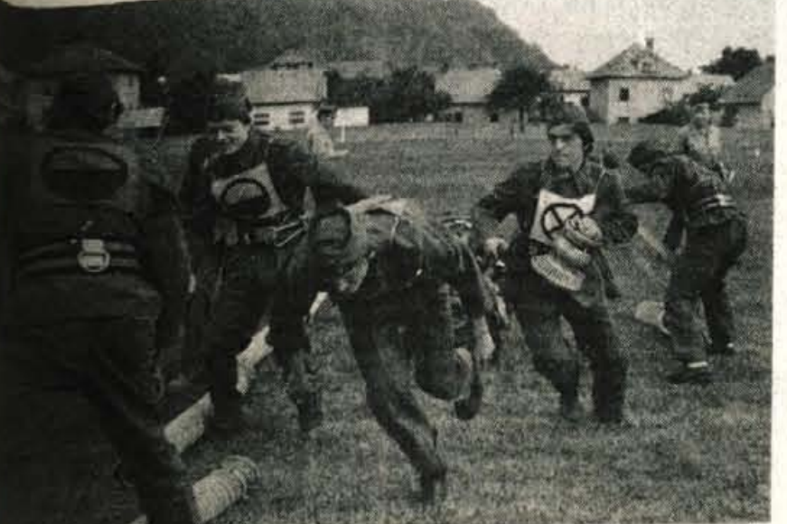
TEKMOVALI — Ze nekaj časa se vrstijo v kranjski občini občinska tekmovanja za vse kategorije. Udeležba na letošnjih tekmovanjih je bila v nedeljo so bila v Stratišču zadnja tekmovanja. Nastopile so mladinske, članske in veteranske desetine ter desetice.