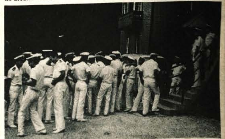
Kranjska gora - Gorenjsko je obiskala skupina 45 starešin in gojencev vojaške pomorske šole iz Splita, ki je na povabilo republiške konference ZSMS priplula s šolsko ladjo Galeb v koprsko luko. Gostje so si ogledali Bled in prek Mežaklje prispeli na Jesenice, kjer so obiskali železarski muzej in se z mladinci iz železarne zadržali v krajšem pogovoru. Popoldan so se v Gozd Martuljku srečali z brigadirji, ki so se udeležili lokalne delovne akcije na Srednjem vrhu, od tam pa odšli pod slap Peričnik, v Planico in Tamar. Za konec izleta so se iz Kranjske gore potzpeli do Erjavčeve kočice na Vrščicu, pred vrtnitvo v Koper pa so jim domačini v kranjskogorskem gostišču Erika pripravili sprejem s kulturnim sporedom. Obisk je poleg izmenjave izkušenj mladim omogočil tudi seznanjanje mladincev z možnostmi solanja v vojaških solah. Na sliki: gostje v Kranjski gori.