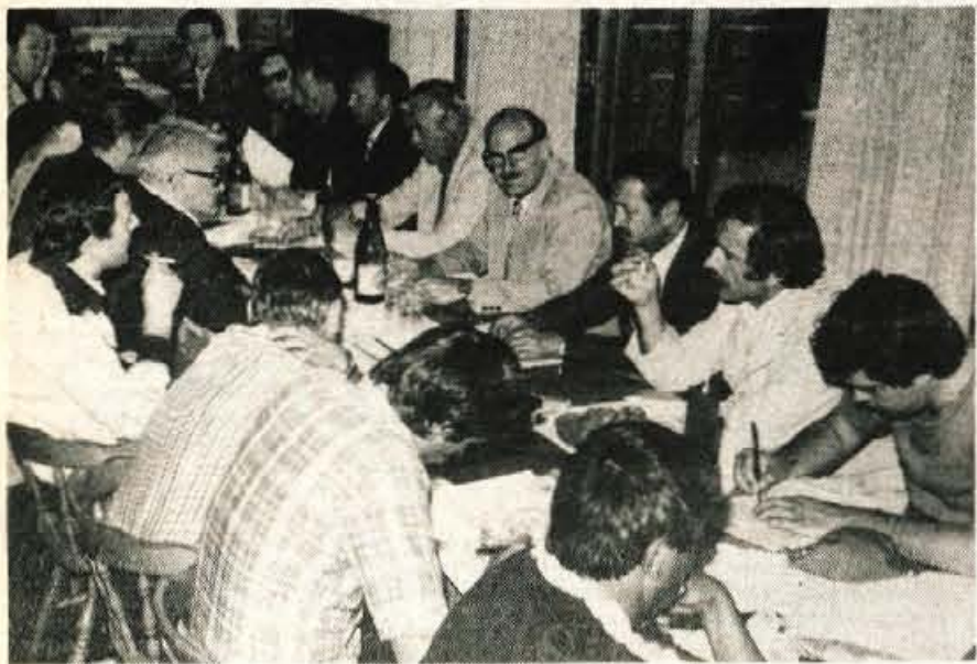
V restavraciji hotela Kompas so organizatorji letošnje dirke za svetovno prvenstvo v motokrosu v kategoriji do 125 ccm članikarje seznanili s pripravami na to prireditev. Le-ta bo v nedeljo na znani motokros progi v Podljubelju.

KRANJ - Šolsko športno društvo France Prešeren je bilo organizator področnega tekmovalnega v metu žogice. Med osemindesetimi tekmovalci in tekmovalkami sta obe zmagi ostali v OŠ France Prešeren. Rezultati - pionirji - 1. Samardžija (FP) 62,60, 2. Porenta (MV) 61,38, 3. Krivec (JM) 59,44, 4. Pestotnik (LS) 57,88, 5. Jakšič (MV) 56,46, 6. Krašovec (MV) 55,80, 7. Seljak (MV) 56,40, 8. Mencinger (FP) 55,14, 9. Leskovec (S) 54,42, 10. Vučković (HP); pionirke - 1. Skubic (FP) 43,40, 2. Sava (MV) 41,18, 3. Gramc (FP) 39,70, 4. Dragana (MV) 38,96, 5. D. Sava (MV) 38,30, 6. Benedičič (S) 36,82, 7. Vontina (FP) 36,00, 8. Tjalov (MV) 35,79, 9. Rupač (MV) 35,58, 10. Tisler (MV) 33,22. I. K.