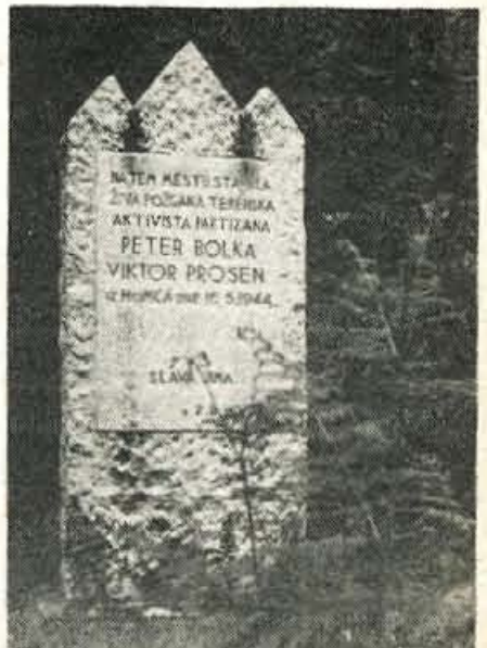
Pomnik na Homcu