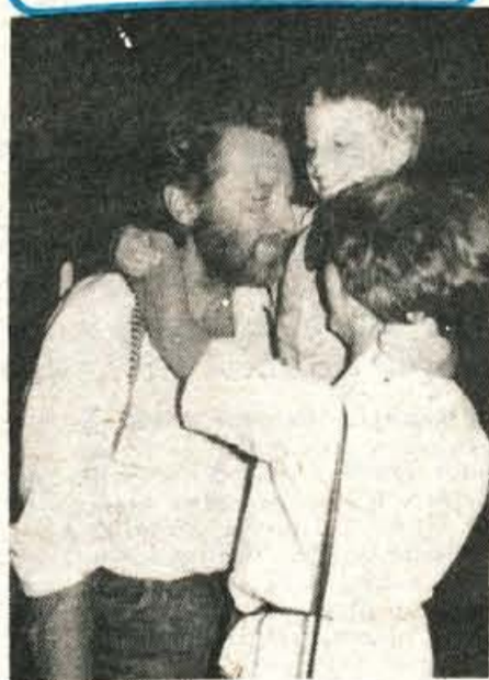
Najsrečnejši trenutek: srečanje s svojci, prijatelji, znanci