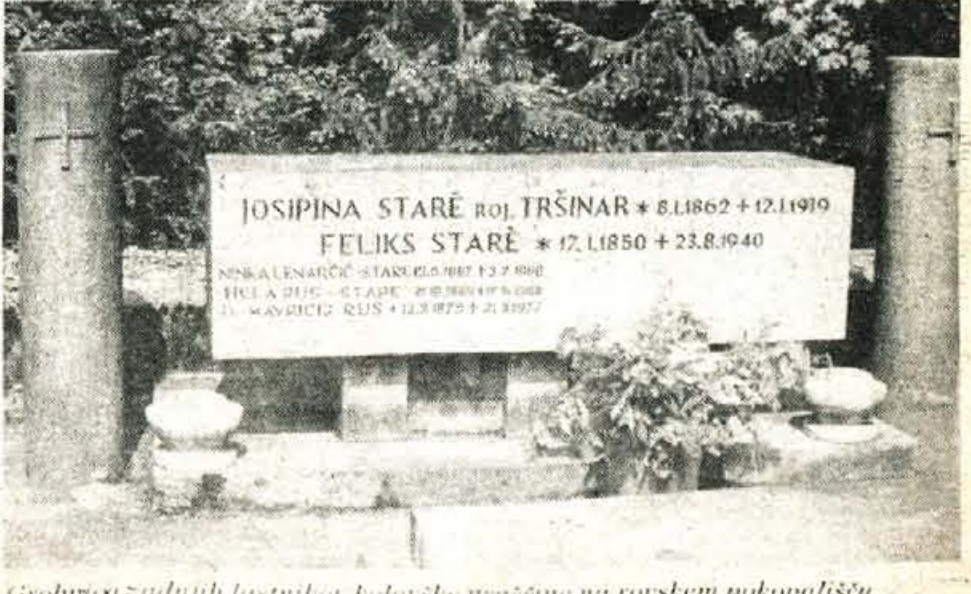
Grobniča zadnjih lastnikov kolovske graščine na rovskem pokopališču.