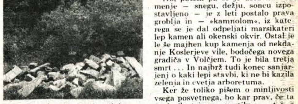
To je vse, kar je ostalo od lepega načrta: nadomestiti gradič v Volčjem potoku z gradivom Koslerjeve hiše, pripeljanim iz Ljubljane.

Pa tudi podoba »tretje smrti« grad Volčjega potoka. Prvič je premislil stari grad na visokem hribu (523 metrov) nad sedanjim parkom. Potem so si gospodarji sezidali nov grad v dolini (sredi sedanjega arboretuma) bilo je to v 17. stoletju. No, tudi ta grad je doživel svoj konec: dne 13. aprila 1944 je bil požgan, da