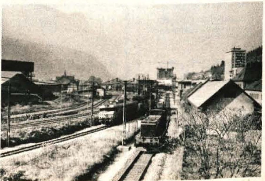
Pa končanih obnovitvenih delih bo tudi jeseniška železniška postaja sodobnejša