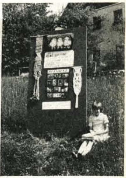
Vrba - Učenci osnovne šole iz Zirovnice so ob dnevu mladosti in v okviru praznovanja 40-letnice Prešernove hiše kot muzeja pripravili v osnovni šoli razstavo tapiserije in makrameja. Na razstavo so povabili tudi obiskovalce Prešernove rojstne hiše v Vrbi...

njegove afriške krajine, kjer je lahko do konca razvil tisto, kar je poskušal storiti že ob domačem motivu: slika je s tremi vodoravnimi pasovi razdeljena na najbližji prvi plan savane (v domačih pejzažih je bila to voda ali polje), ki popelje oko v globino, brez kakršnegakoli trika z v ospredje postavljenim optično perspektivnim pomagalom; pas je zaključen v gričevju, ki preide v nebo. Vmes je samo tu in tam nekaj efektnih dreves ali drugih dopolnil, vse pa je tako enostavno, da smo začudeni, kako je sploh mogoče na tako enostaven način tudi toliko povedati, v slikarskem smislu besede. Vse to pa Adamič obvladuje s perfekcionirano tehniko slikanja, poenostavljenega zopet in tudi zanj značilnega v skoposti, ki rezultira v bogastvu zaobseženega, tudi slučajnostnega, pa vendar zopet pravilno vtakanega v celotno tkivo slike. A. Pavlovec