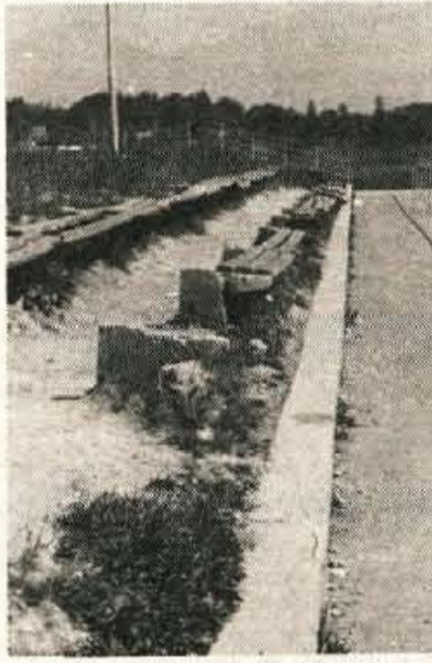
Takole uničujemo družbeno lastnino na stadionu Stanka Mlakarja...