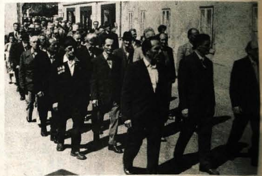
V svečanem sprevodu po Kranjski gori so bili najštevilnejši borci jeseniško-bohinjskega odreda.