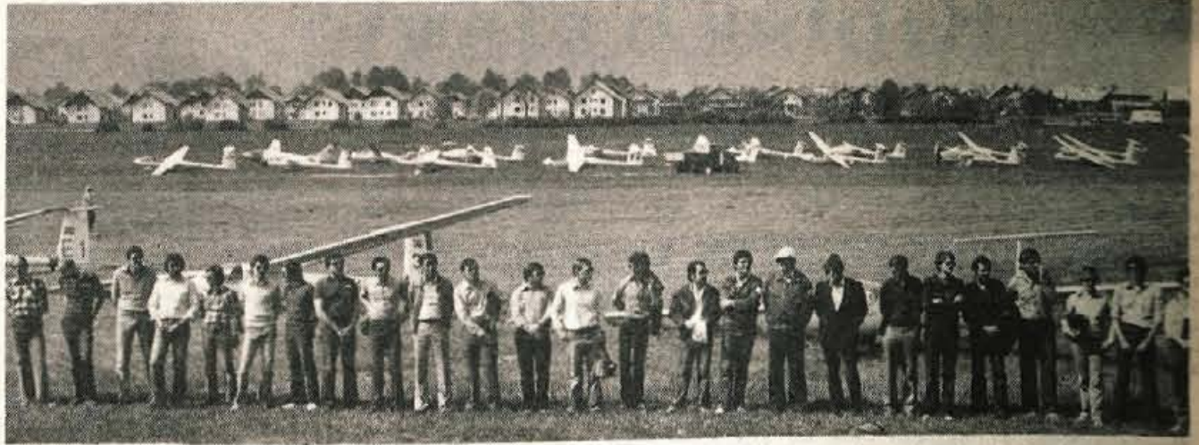
Lesce - Od 19. do predvidoma 25. maja poteka 17. prvenstvo Slovenije v jadralnem letenju...