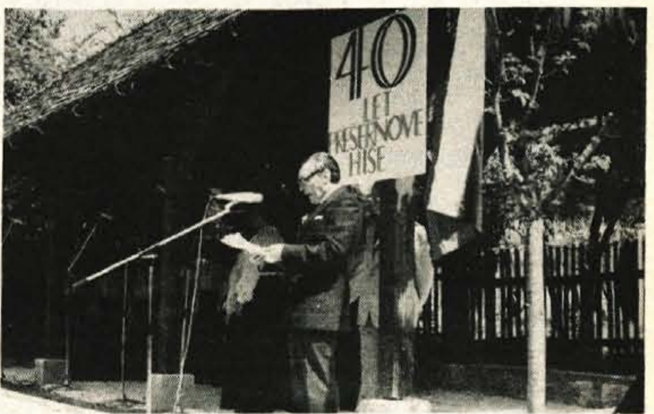
Vrba — Ob 40-letnici Prešernove rojstne hiše kot muzeja so minulo nedeljo pripravili v Vrbi proslavo, na kateri je bil slavnostni govornik podpredsednik slovenske akademije znanosti in umetnosti profesor Bratko Kreft.

Vrba — Letoš je minilo štirideset let, odkar je Prešernova rojstna hiša v Vrbi muzej. Jeseniška kulturna skupnost je zato v nedeljo, 20. maja, pripravila proslavo, s katero so počastili pomembno obletnico. Proslava v Vrbi je bila osrednja prireditev v kulturnem tednu, v okviru katerega so že pripravili več prireditev, med drugim tudi srečanje pevskih zborov z Jesenic in Koroške Bele, razstavo ročnih del učencev in krajanov v žirovniški osnovni šoli ter koncert slovenskega okteta v jeseniškem gledališču.