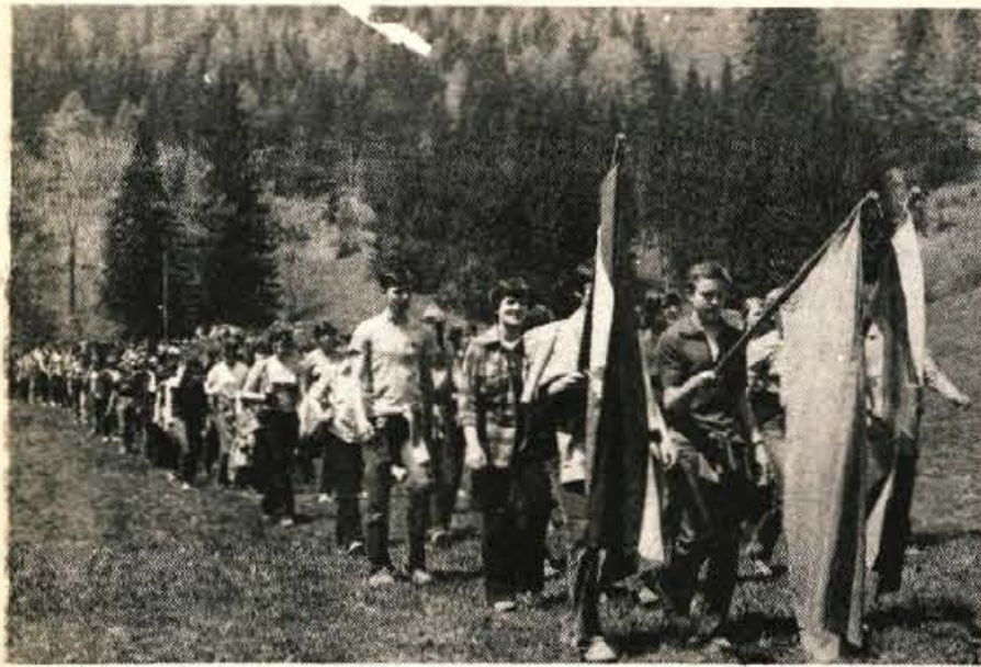
Prihod ene od devetih enot, ki so se udeležile pohoda po partizanskih poteh na Pristavo, na prireditveni prostor