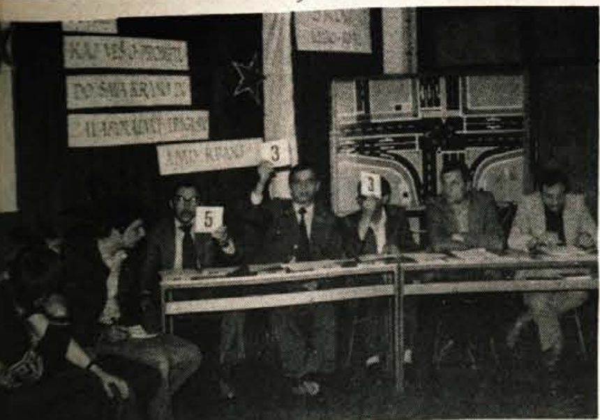
KRANJ – PIONIRJI OŠ »KAJ VEŠ O PROMETU« – Auto-moto društvo Kranj je v svojih prostorih organiziralo občinsko tekmovanje kranjskih osnovnih šol »Kaj veš o prometu.« Na tekmovanju je nastopilo petčlanskih ekip. Najboljša je bila OŠ Simon Jenko (H) – Foto: F. Perdan

Delo je pogodbeno, primerno za dijake, študente, gospodinje in upokojence. Prošnje pošljite do 1.6. 1979 Podružnici CGP Delo, Koroška 16, Kranj.