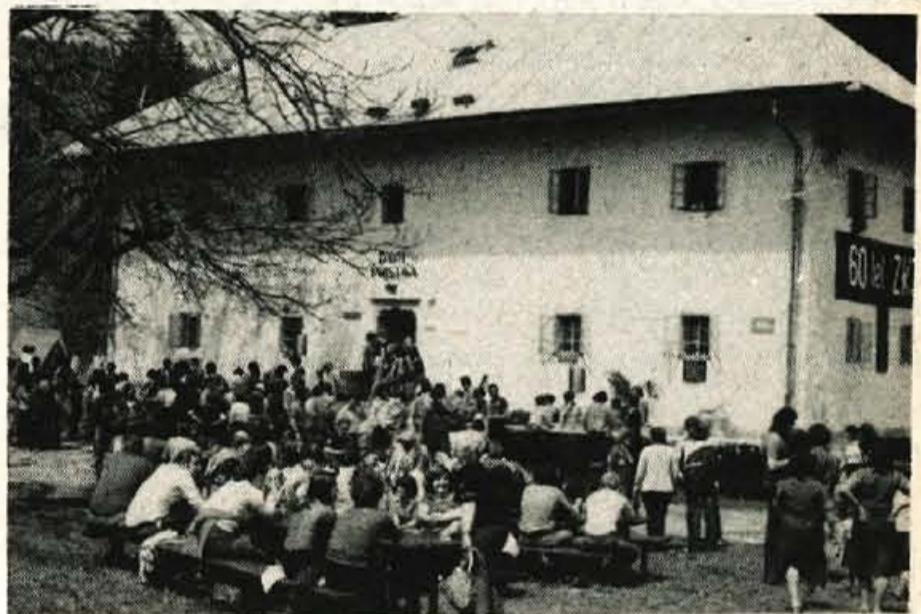
Po slavnosti je bilo na Pristavi tovariško srečanje udeležencev.