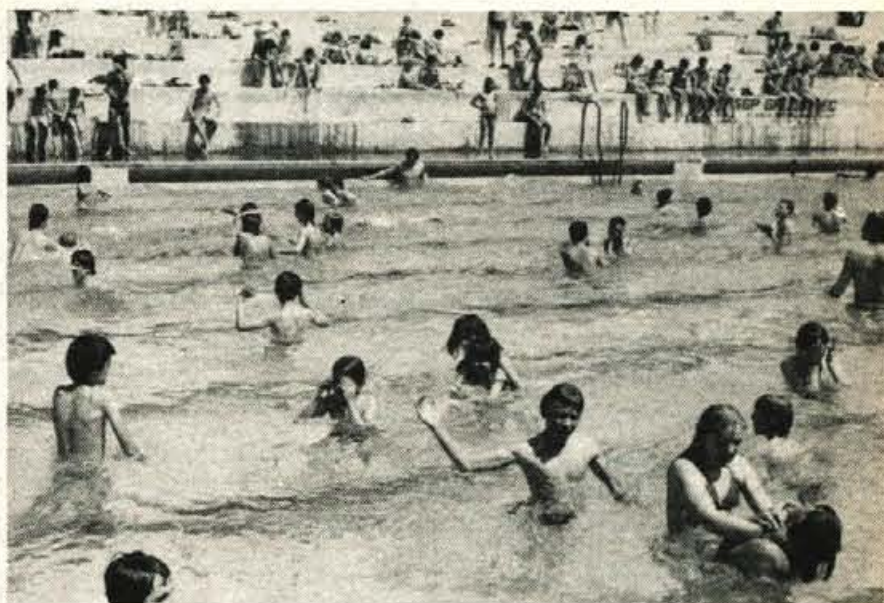
KRANJ – VROČ KONEC TEDNA – Vsak po svoje je te dni poskrbel za udobje pred prezgodnjo vročino. Čeprav koledarskega poletja še ni, je bilo te dni vroče kot v »pasjih dneh«. Tudi na kranjskem letnem bazenu so se številni ohladili; (H) – Foto – F. Perdan

Tržič – V četrtek, 17. maja, sta v Bistrici pri Tržiču dva brusilca nožev ponudila svoje usluge v hiši številka 17, kjer je bila doma samo stara mati. Ker sta tako silila, jima je res dala nekaj nožev v brušenje, za kar pa sta zaračunala 736 din. Ko jima je plačevala, je eden od njiju segel v denarnico in vzel bankovec za 1000 din, nato pa zahteval še 200 din ter trdil, da je vzel le bankovec za 500 din. Ko je mama odšla k sosedu, da bi si sposodila 200 din, sta oba brusača iz njene denarnice vzel še preostali drobiž in izginila.