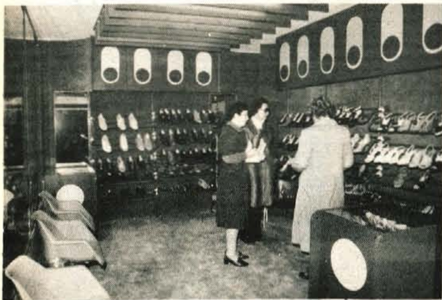
Prenovljena prodajalna čevljev – Pekova trgovska mreža je na gosto razpredena po vsej Jugoslaviji, saj ima v domovini kar 130 prodajalnih obutve. Trgovina v Radovljici na Gorenjski cesti je bila že nekaj časa premajhna in nj več zadoščala sodobni ponudbi. Zato so jo v Peku precej razširili, pridobili skladiščne in prodajne prostore in jo napravili tako, da bodo kupci radi zahajali vanjo. (H. J.)

Ob vsakem koncu sončne nedelje se promet že v Naklem zgosti in se ustavlja pred križiščem v Kranju. Tokrat je bilo drugače; promet je lepo tekkel, brez zastojev na železniškem nadvozu v Naklem, brez gnoče na kranjski obvoznici.