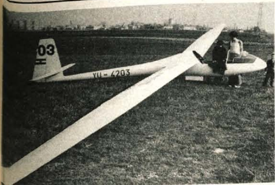
ZMANJKALO SAPE – Dnevi lepega vremena so razveselili pilote centralnih letal. Ure in ure so krmarili nad Gorenjsko, jadralci leskega centra so dosegli tudi nekaj rekordov v preletu in dolžini leta. Vsakdanost jadralskega pa je tudi zasilni pristanek, če zmanjka višine in nagajajo zračni tokovi. Za pristanek jadralca ni potrebna velika ravna površina. (jk)