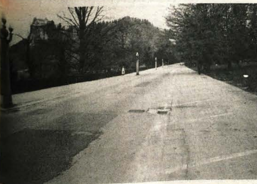
Polno praznega - Pravkar minuli vikend ni le zredil cest, pač pa so vozniki lahko izbirali tudi parkirni prostor. Tudi gostinci so bolj počivali in tolžili, da bo naslednji vikend drugačen.

GLASILO SOCIALISTIČNE ZVEZE DELOVNEGA LJUDSTVA ZA GORENJSKO