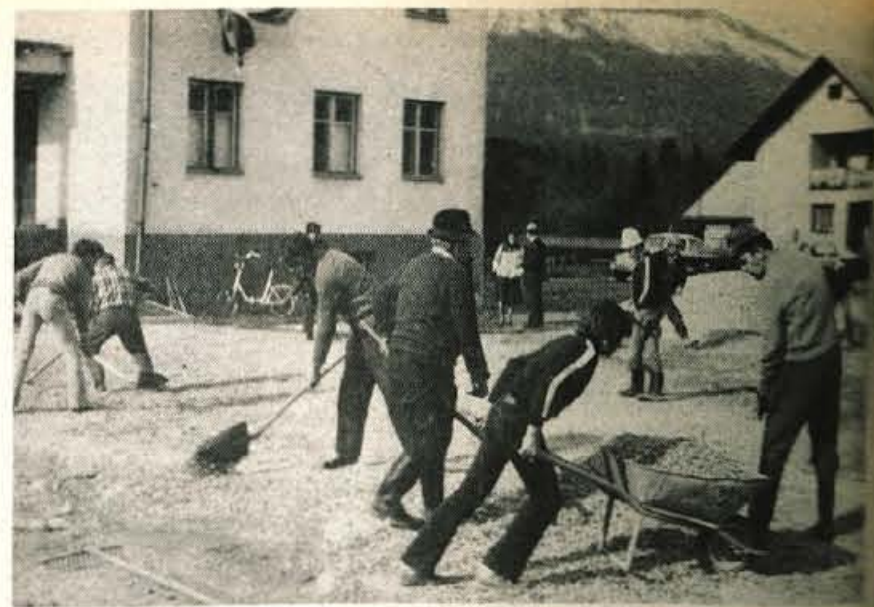
Mošnje – V okviru krajevnega praznika krajevnega skupnosti Mošnje ter 30-letnici DPD Svoboda Mošnje so prebivalci lepo uredili okolico doma prostovoljnimi delom. Vaščani so pred leti tudi sami zgradili kulturni dom sodelovali pri številnih akcijah v kraju.

Smučarska sezona še traja – Sobotno sneženje je nasulo po gorenjskih smučarskih štivalih dodatno metro snega. V zasneženi Kranjski gori se seveda žužnice niso vrtele, tem bolj veselo pa je bilo na Krivacu, kjer je po meter debel sneg na Njivicah vstalilo v nedeljo okoli 3000 smučarjev. Idealna smuka je bila tudi na Voglu, kjer je zapadlo 40 cm novega suhega snega. Ski hotel je svet zaprt, v brnaričah pa je prostora dovolj. Cesta na Po.