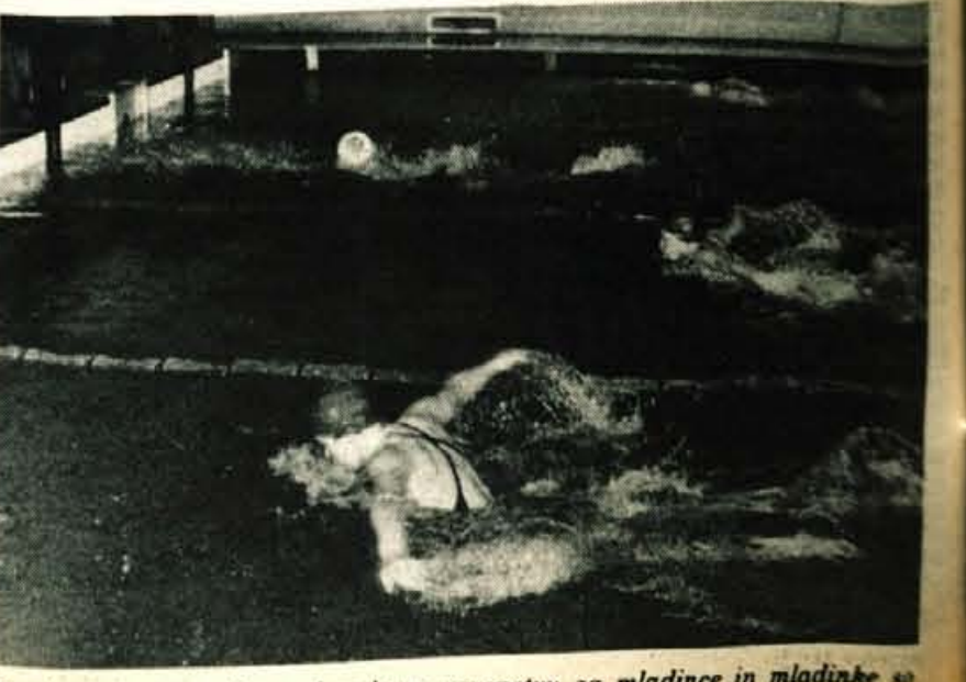
Na letošnjem zimskem plavalnem prvenstvu za mladince in mladinke so oboji startali tudi na 200 m delfin.