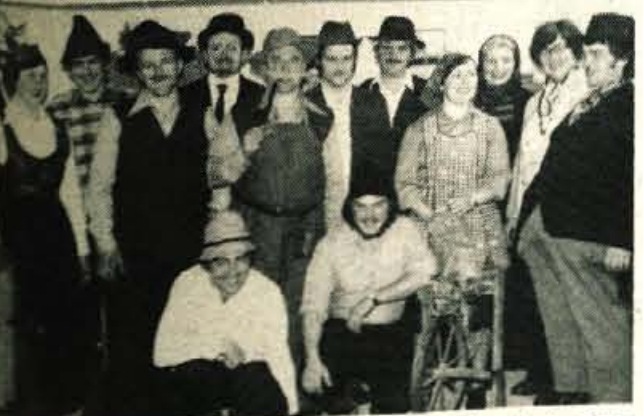
Planina pod Golico — V tem kraju je letošnjo zimo pričela z delom dramska skupina kulturno umetniškega društva Svoboda. Naštudirala in zaigrala je že ljudsko igrice »Najboljši je gasilec«. To pa predvsem v zahvalo domačim gasilcem, ki so ji v novem domu odstopili prostor za njeno delovanje. Na sliki: igralska skupina z režiserko iz Planine pod Golico, ki namerava nastopati tudi v drugih krajih. — B. B.