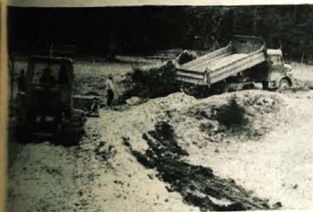
Mežaklija — Delavci Gozdnega gospodarstva z Bleda so lani poletje pričeli graditi gozdno cesto na Mežakliji. Zdaj so v teku gradbeni dela od Hrušice proti kamnolomu jeseniške železarnice, kasneje pa bodo cesto podaljšali vse do Poljan. Nova gozdna cesta bo omogočila sodobnejši način spravila lesa, ki ga posejajo na Mežakliji. — B. B.