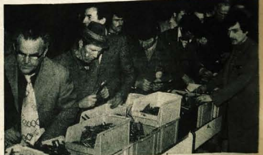
Na razstavnem prostoru kranjskega Merkurja je takoj po otvoritvi sejmca vladala velika gneča. Za 110 dinarjev je bilo mogoče dobiti kilogram najrazličnejših ključev.