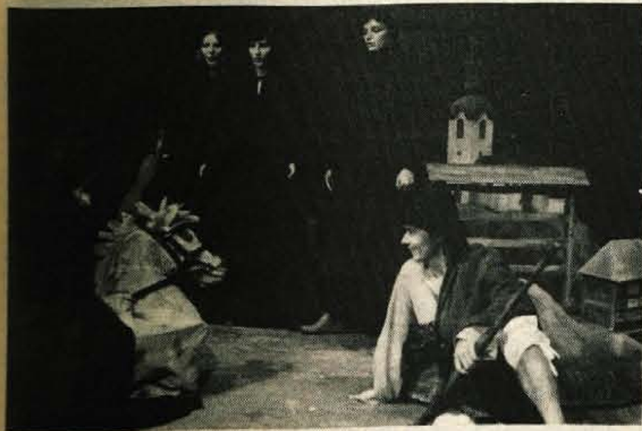
Deseti brat SNG Drame iz Maribora bo gostoval v Prešernovem gledališču v četrtak ob 19.30.

Mariborčani z Desetim bratom v Kranju, Kranjčani s Samomorilcem v Mariboru