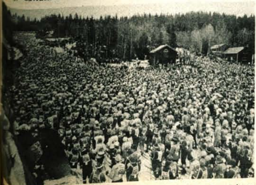
Do najst tisoč tekačev iz vse Evrope je to leto teklo na Vasa teku na

Zadnji dan pred tekmo je bil v Mori velik ceremonial (baklada, zvonjenje cerkvenih zvonov, proslava v cerkvi z udeležbo ministra, ognjemet, maša), ki se ga nismo udeležili. Vse preveč smo namreč bili zaskrbljeni in zasedeni s pripravami na tekmo. Največ skrbi nam je povzročila odjuga, saj je bila temperatura zraka v poznem popoldnevu 5 stopinj. Imeli pa smo srečo. Zvečer je zapihal severozahodnik in tempe-