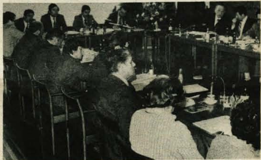
Dr. Anton Vratuša se je v petek zjutraj sestal s predstavniki kmetijstva kranjske občine. Staranje kmečkega prebivalstva, majhna akumulacija panoge, povezovanje s predeli s kmetijskimi surovinami, proizvodnja hrane, zemljiška politika in družbena pomoč hribovskim kmetijam so bile osrednje teme pogovora.

KRANJ — »S Kranjčani se nisem srečal prvič. Skupaj smo bili na zboru aktivistov in skupno smo razpravljali o razvoju brniškega letališča, o gradnji hidroelektrarn in zaščiti okolja ter drugih pomembnih zadevah. Srečujemo se v pravem trenutku po seji predsedstva centralnega komiteja ZKS, na kateri je bilo govora o žgočih problemih sedanjosti: razvoju družbenoekonomskih odnosov, uresničevanju zakona o združenem delu, svobodni menjavi dela in združevanju dela in sredstev. Kranj je mesto z dolgo tradicijo delavskega razreda in z vsemi značilnostmi slovenske industrije, zato so v kranjski občini njeni problemi še bolj izraziti. Pričakujemo izkušnje in stališča, ki nam bodo omogočila lažje delo. Kranj mora načeti vprašanje družbenoekonomskega položaja občinske skupnosti, vplivati na enotnem jugoslovanskem trgu in na