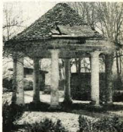
Takole pa je »ohranjena« vrtni paviljon pri gradu Češeniku

Delavstvo papirnice je ves čas vojne sodelovalo z OF. Skrbelo je, da partizanskim tiskarnam nikoli ni zmanjkalo papirja.