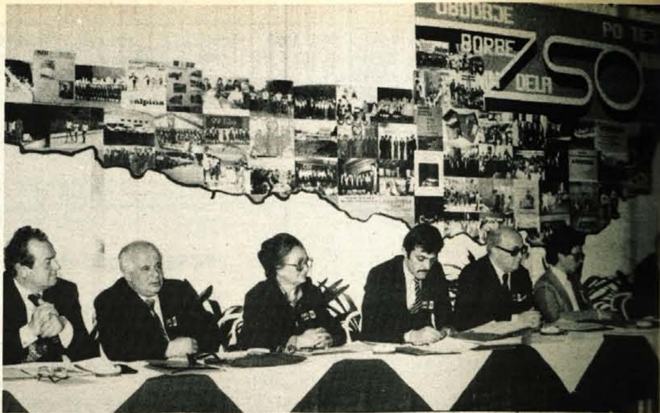
Nad 200 delegatov Zveze slovenskih organizacij na Koroškem iz vseh krajev dvojezičnega ozemlja je sodelovalo v delu sobotnega občnega zbora v Železni Kapli