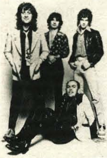
Ljubljana — V nizu koncertov, na katerih nastopajo zvezde svetovne glasbene scene, bodo v ljubljanski hali Tivoli 16. aprila zaigrali, zapeli in sploh razgibali sebe in poslušalce člani znane angleške skupine Slade.