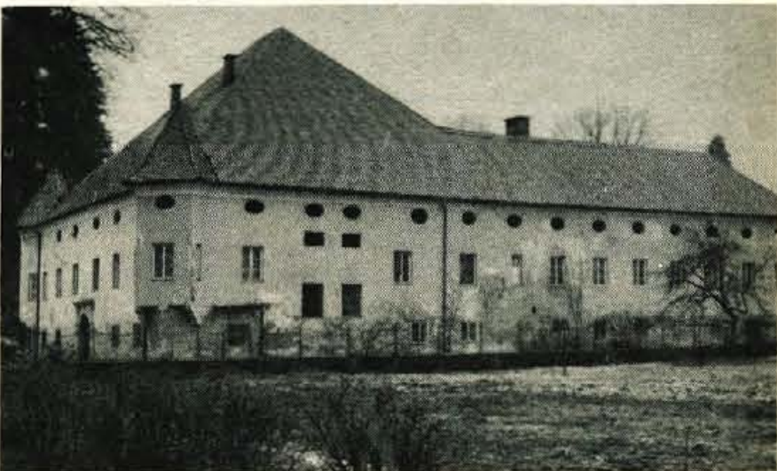
Današnji izgled gradu Češenika pri Radomljah (kakšnega je videl Valvačor, glej zapis št. 8).