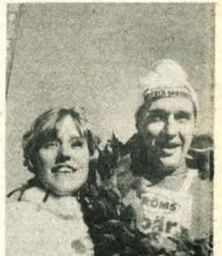
Zmagovalec teka Vasa je tekel in zmagal na Elanovih smučeh.

Zasedli smo mesta, vsak v svoji skupini. Še 2 uri do štarta ob 7. uri 45 minut. Velika zanimivost: mesto