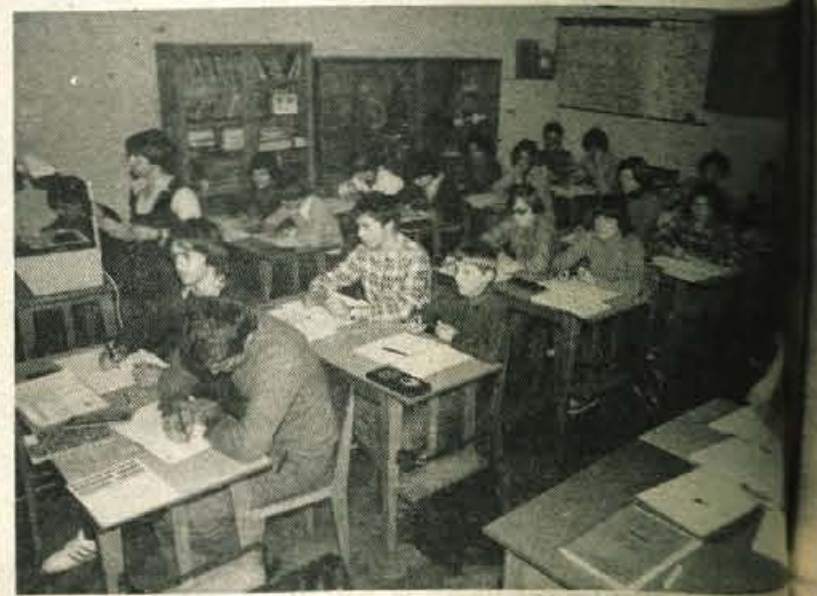
Pouk na žirovski šoli je zaradi pretesnosti v treh izmenah. F. Perdan

Omenjeni program gradnje prostorov, šolskega stadiona in šolske knjižnice, ki ga je tudi program uvedbe celodnevne šole, je že potrdil svet krajevne skupnosti. Starše bodo z obveščili na roditeljskih sestankih krajanov. Ker so starši lani veliko naredili, predvidevajo, da bodo prizadevanja podprla družbenopolitična skupnost.