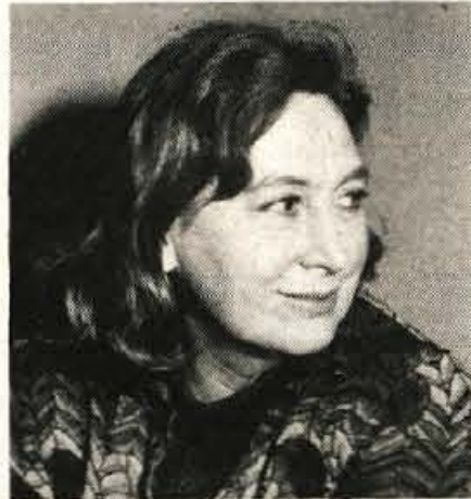
Teater je nenadomestljiv . . .

Ko je prijela v roko mikrofon in začela s Povodnim možem, se je zdelo, da ga bo interpretirala nekako vsakdanje, počasi, pripovedno. Skoraj razočaran si v začetku. Toda »ko pride se črni oblaki . . .«, plane iz nje taka sila, tak zagon, da ti stopi kurja polt, zažge vročica in v istem trenutku ti neka nepojmljiva sila dobesedno zavrti drobovje . . .