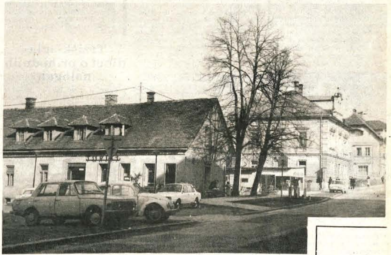
Finkova hiša dan pred rušenjem — Finkova hiša v Kranju in bližnja poslopja na nekdanjem Bekselnu so že pripravljena za rušenje. Okolica je že primerno zavarovana, prav tako pa so pripravljena dela že opravili mineri. Mine bodo predvidoma aktivirane jutri ob 16. uri, ko se bo Finkova hiša sesedla. Na tem mestu bo zgrajeno novo poslopje banke (jk)