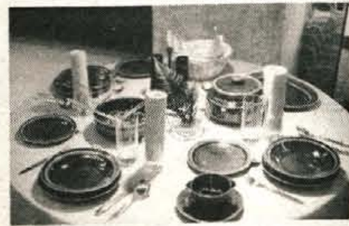
Praktična darila za 8. marec praznik žena

lahko dobite na oddelku MERKUR v veleblagovnici GLOBUS, kjer vam bodo prodajalci pri izbiri darila radi svetovali in po želji tudi aranžirali.