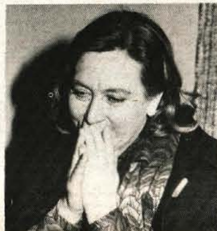
kamera pa ti pride dobesedno v bit, v žile. Vse lahko narediš, le če znaš, čutiš.

Vseh nians pa seveda ne moreš dobro zaigrati: neke se razživijo bolj, druge manj.