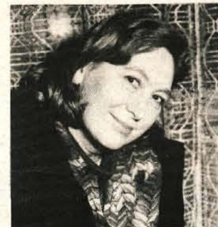
Prišla bi, če bi bili veseli tega.

šernovo nagrado za tri vloge: za dr. Zahndovo v Fizikih, za Kesonijo v Camusovi Kaliguli in za plesalko v Božičevih Kaznjencih. Leta 1977 pa prejme Severjevo nagrado za Staromodno komedijo, iz katere, po njenih besedah, veje neverjeten optimizem in volja do življenja. Rahla komedija, ki pa prav nič ne prizadene. Pred kratkim so z njo uspešno gostovali v Priničah.