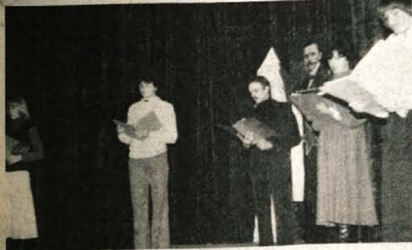
Recital v Podbrezjah — Člani osnovne organizacije Zveze socialistične mladine Slovenije iz Podbrezjaj razvijajo živahno kulturno življenje. Med drugimi so pripravili recital Prešernove poezije in Cankarjeve proze. Program je popestril moški pevski zbor iz Dupelj.