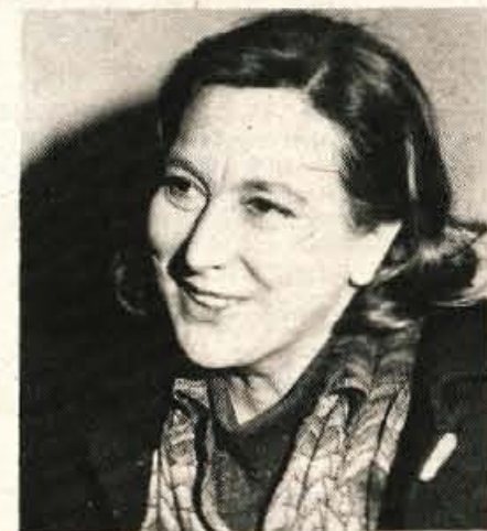
Življenje, ki sem ga preživela, je bilo tako bogato, tako polno, da praktično nimam več velikih želja.

Veliko je dala iz sebe v vseh teh letih in ostala bo nepozabna Ana Karenina, Agatija Tihonovna v Gogoljevi Zenitvi, Maša v Utvi, Marija v Delavnici oblakov, Tanja v Kozakovi drami Legenda o svetem Čeh, Helena v Shakespearovem komadu Trailus in Kresida, Francka v filmu Na klancu, nesrečna mati v Kukačevem Mišču . . . Za svoje veliko delo je leta 1959 dobila Prvomajsko nagrado Združenja dramskih umetnikov Slovenije, leta 1964 pa Pre-