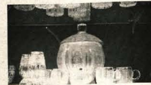
Oglejte si bogato ponudbo praktičnih daril — odlašajte z nakupom!