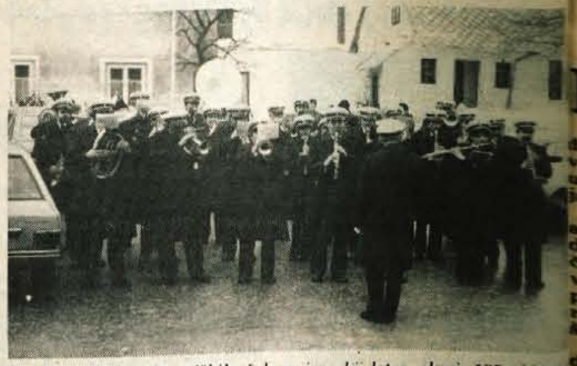
Pihalni orkester jeseniških železarjev, ki letos slavi 105. obletnico uspešnega delovanja, se je pred dnevi sestel na letnem občnem zboru. Na njem so godbeniki pregledali uresničevanje nalog v preteklosti in sprejeli program dela za bodoče. Le-ta je dokaj obsežen, saj jih razne nastope vabijo od vsepovsod. Na sliki: pihalni orkester jeseniških železarjev je februarja letos zaigral sredi Svec na Korobovcu.