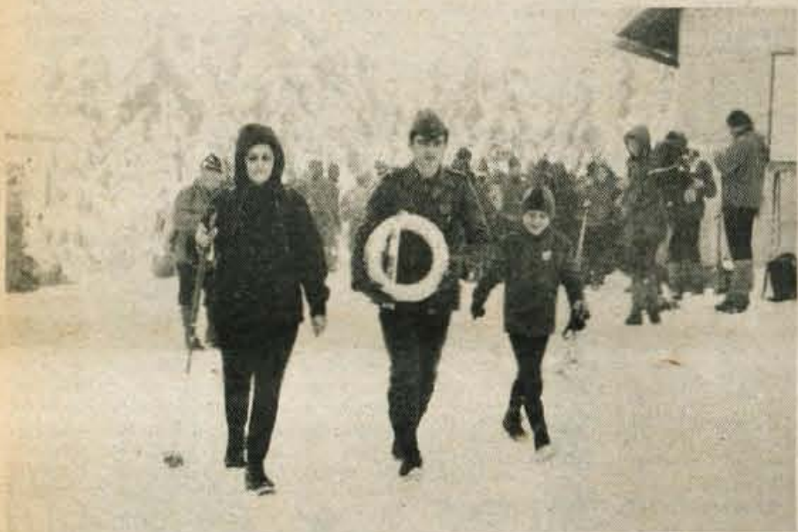
Predstavniki udeležencev pohoda nesejo spominski venec k Valvazorjevemu domu.