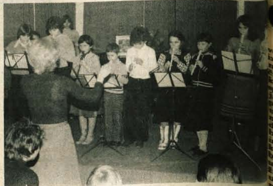
V petek zvečer je bil v graščinski dvorani v Radovljici spominski koncert ob smrti tovariša Edvarda Kardelja. Nastopali so solisti, zbor in instrumentalne skupine radovljiške glasbene šole, program pa je bil izbran iz pesniških partizanskih skladb.