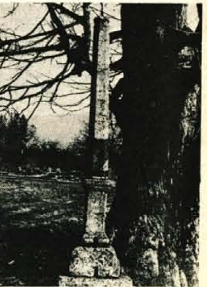
Kužno znamenje iz leta 1645 pod staro lipo na polju pri Cerkljah.

Ničkaj spodbudna ni tale pripoved. Je pač le spomin na našo bridko človeško preteklost.