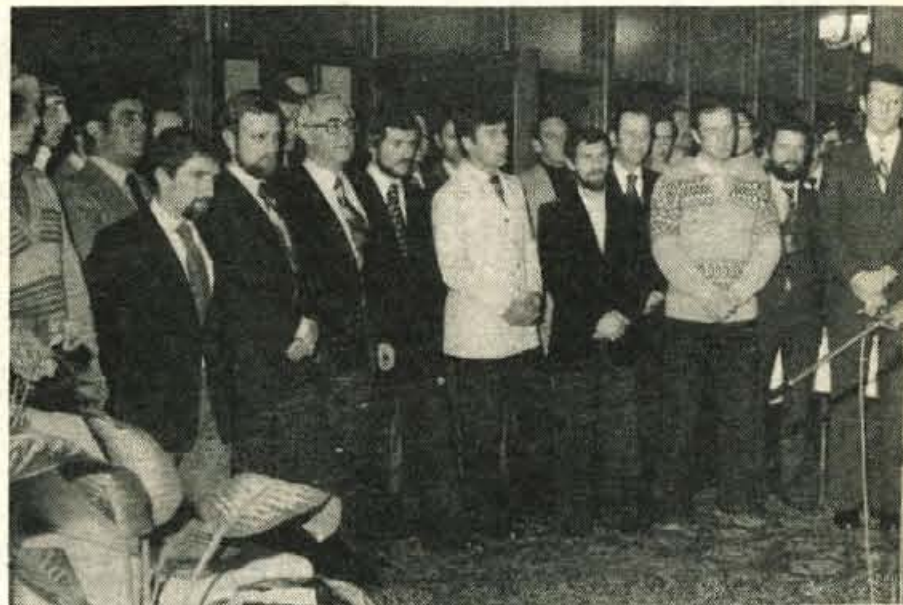
VII. jugoslovansko alpinistično himalajsko odpravo na Mount Everest je sprejel predsednik RK SZDL Mitja Ribičič.