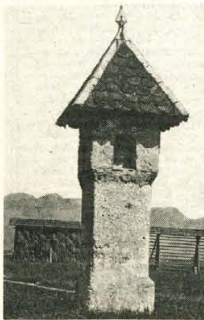
Kužno znamenje pri Domžalah (7. zapis)

V prejšnjem zapisu sem začel pripoved o kugi («črni smrti»), ki tudi okoličarji Domžal ni prizanašala. O tem priča vrsta kužnih znamenj ne le na domžalsko-mengeški ravnici, pač pa tudi drugod (Komenda, Skaručna, Cerklje idr.). Nekatera je zob časa (ali pa kakšne druge potrebe) že uničil. Tako Polževega kužnega znamenja v Zgornjih Domžalah in zanimivega slopatega kužnega znamenja v Stobu ni več. Pač pa še stoji Čebulovo kužno znamenje iz 16. stoletja v Stobu. Prav tako se je do današnjih dni ohranilo stebrasto kužno znamenje z vklesano letnico 1622 v Studi. — Nenavadno »krvavo znamenje« z vklesano letnico 1510 stoji v Podgorju pri Kamniku, tik ob železniški progi.