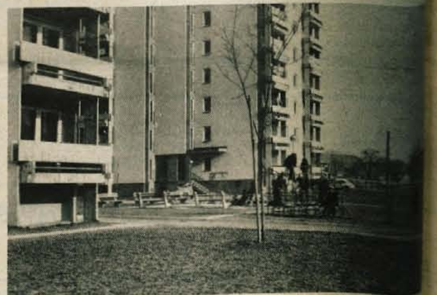
Hudo prostorsko stisko vzgojiteljice vrtca v Podlubniku blažijo s sprejemom igrari v naravi. Vendar je igrišče pred stolpnico odprto in tu se zbirajo otroci celotnega naselja.