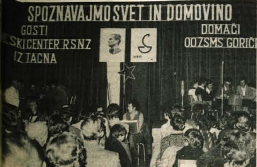
Golnik – V soboto je bilo v dvorani kulturnega doma na Golniku tekmovanje iz Spoznavajmo svet in domovino. V odgovorih na aktualna zunanje in notranje politična vprašanja sta odgovarjali ekipi Solskega centra republiškega sekretariata za notranje zadeve iz Tacna in osnovne organizacije ZSMS iz Gorici. Zmagali so bodoči miličniki. Bili so boljši za eno točko od mladincet iz Gorici.