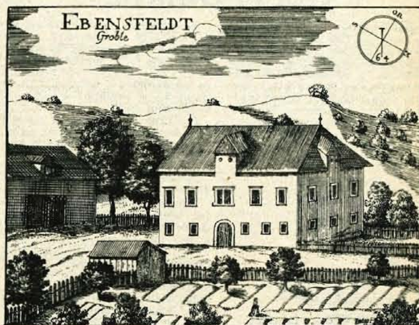
Gradič Groblje, kakor ga je videl Valvasorjev bakrorezec leta 1698