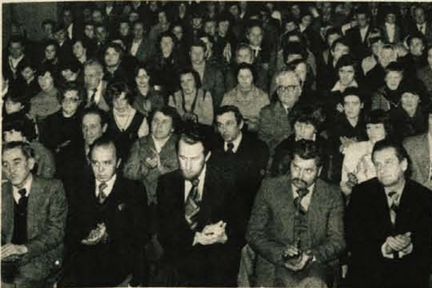
Začetek kulturnega tedna v Predosljah je v soboto zvečer privabil več kot dvesto gostov in krajanov.