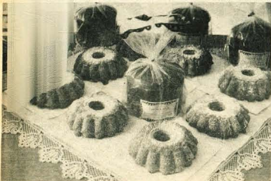
Tončkov kruh in snežni kolač, novost kranjske Pekarne, kmalu na policah trgovin in na mizah potrošnikov.