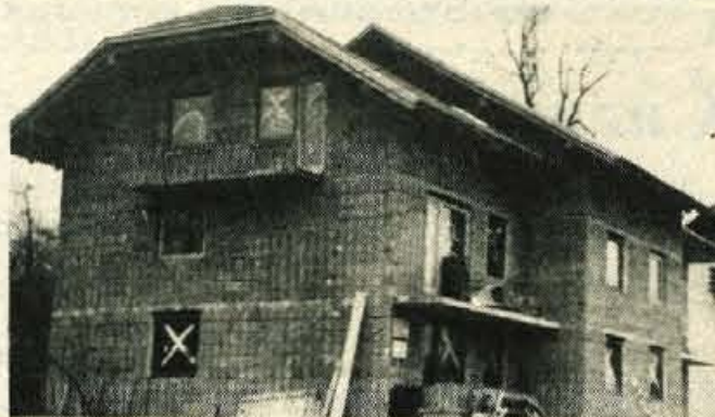
Zapuže – Za delavce tovarne Sukno v Zapužah so pred nekaj leti zgradili dva manjša bloka. Ker še vedno primanjkuje stanovanj, so lani začeli graditi še tretji blok, v katerem bo šest stanovanj. Blok je zdaj pod streho in predvidevajo, da bo useljav letos poleti. – B. B.