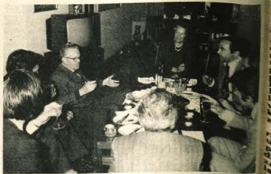
Tacen – Na svojem domu v Tacnu je lani Edvard Kardelj sprejel predstavnike kranjskega planinskega društva in predstavnike kranjskega družbenopolitičnega življenja; kot planinec in vnet lovec se je Kardelj še posebej zanimal za gradnjo in vzdrževanje planinskih postojank.