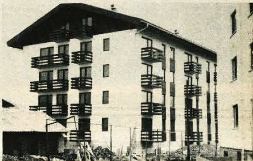
Lesce — Delavci SGP Gorenje grade v zahodnem delu Lesce not trinadstropni stanovanjski stolpič. Poslopje so začeli graditi lani, vseljiv pa bo letošnje pomlad. Sedaj opravljajo še nekatera notranja dela, urediti pa morajo še okolico. V nova stanovanja se bodo vselili delavci tovarne Veriga, ki so financirali gradnjo tega stanovanjskega poslopja.