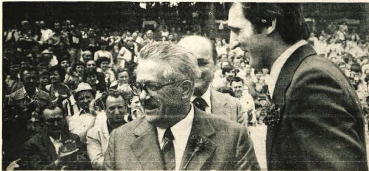
Škofja Loka – Prvo častno priznanje Iskre so ob dnevu Iskre podelili Edvardu Kardelju 1. julija 1978 v Škofji Loki in sicer za njegov izvirni ustvarjalni prispevek k razvoju in utrjevanju naše samoupravne socialistične demokracije.