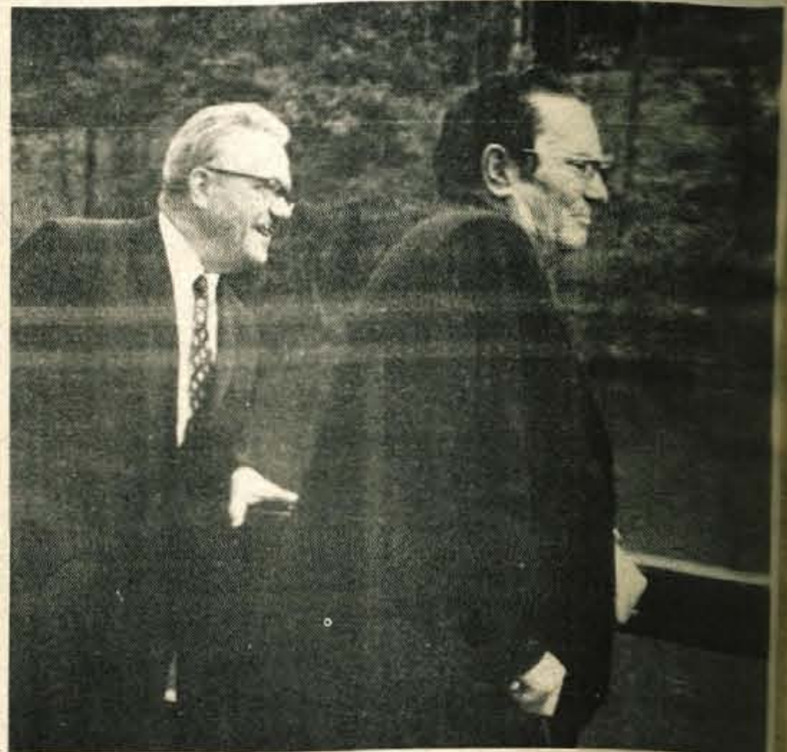
Brdo pri Kranju – Sproščen pogovor, dveh prijateljev, dveh soborcev, dveh velikih mož.

Srečanja, ki jih je imel Edvard Kardelj z gorenjskimi delavci, predstavniki družbenopolitičnih organizacij morda niso bila tako česta, kot bi si vsi skupaj želeli, toda kadar se je nametil v ta del Slovenije, so srečanja s tem vedrim, prijaznim in tako preprostim človekom, kot je Kardelj bil, vedno bila dogodek, ki ga prisotni niso pozabili. Zadnji čas, ko zaradi bolezni še ni več odhajal od doma, pa so bila vrata njegovega doma pod Šmarno goro odprta za obiske in delegacije, ki jih ni bilo tako malo tudi z Gorenjske. Od svojega doma je Kardelj zadnja leta lahko le od daleč gledal proti planinam, kamor je poprej, če mu je le delo dopuščalo, tako rad zahajal. Nema lokrat je bil tudi na Triglavu, pa na drugih slovenskih gorah. Če je le mogel, je zelo rad prišel v gozdove Jelovice in tam z užitkom poznavalca, saj je poznal desetine in desetine gob, preiskal jelovška prostranstva. Kot redni in kot častni član kranjskega planinskega društva se je zanimal tudi za Planinski dom na Ledinah v Karavankah, ki so mu bile še posebej znane: tja čez so ga namreč vodile njegove prve ilegalne poti. Kranjski planinci so na večerajnji žalni seji zato predlagali, naj bi ta njihov dom imenovali po Edvardu Kardelju.