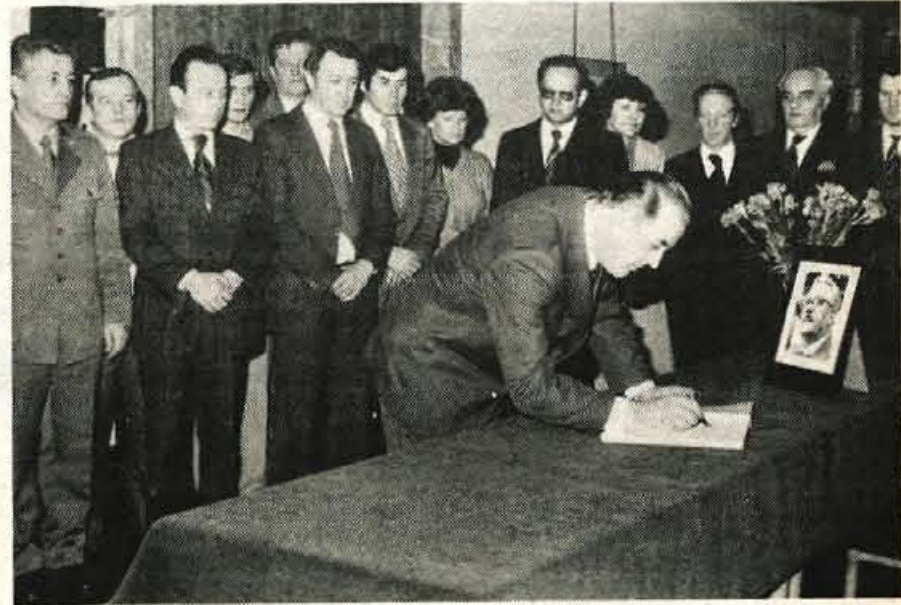
V stavbi občinske skupščine v Kranju je odprta žalna knjiga.