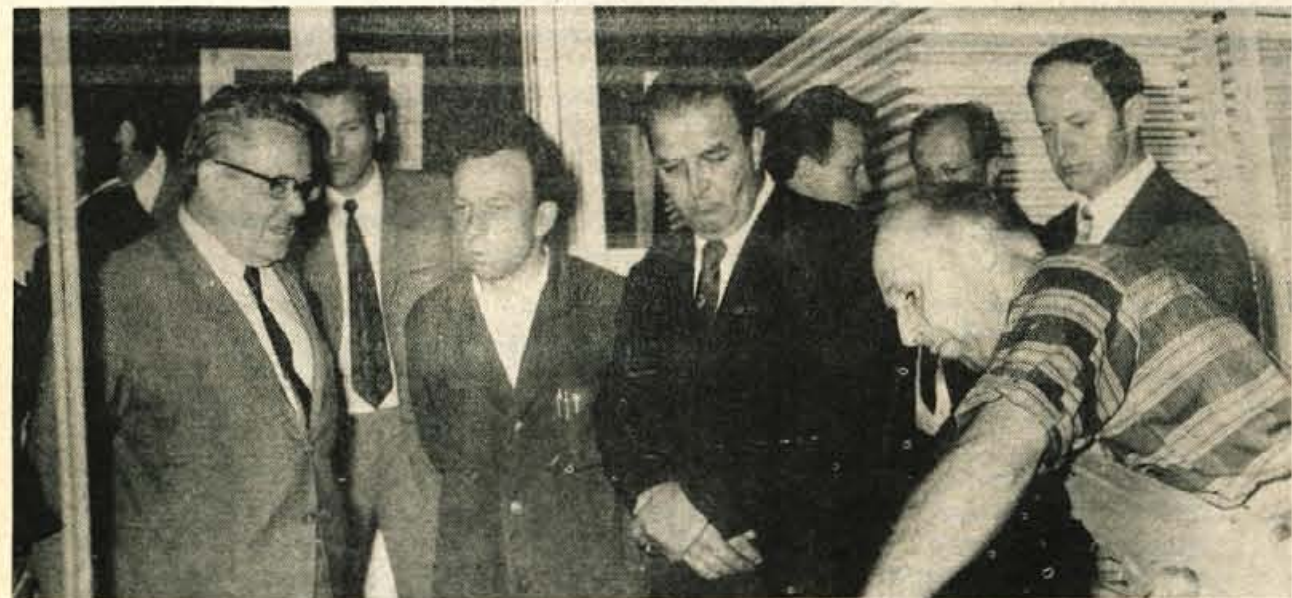
Škofja Loka – Na enem od obiskov v škofjeloški občini se je Edvard Kardelj po obisku več delovnih organizacij, slika je bila posneta v Jelovici, pogovarjal z loškim političnim aktivom o aktualnih gospodarskih in družbenih vprašanjih.