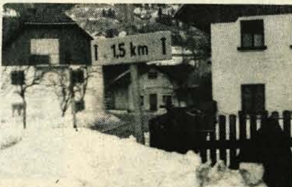
Mojstrana – Zima še vedno traja, zato tudi nevarnost poledice, posebno ob hladnih jutrih, še ni minila. Toda tabla, ki naj bi v Mojstrani opozarjala na poledico, že lep čas »počiva« za bližnjo ograjo. Ničče od odgovornih se ne spomni, da bi jo postavil na mesto, kamor sodi. In kdo bi odgovarjal takrat, ko bi zaradi manjkajočega prometnega znaka prišlo do nesreče! – A. Kerštan