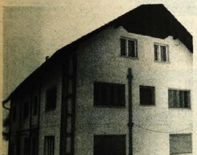
Vrtec v Smedniku – Delavci SGP Graditelj Kamnik so končali prenovo enote VVZ Medvode v Smedniku. Za prenovo bivše gostilne v vzgojnovarstvene prostore je SIS za otroško varstvo občine Ljubljana-Siška prispevala 2 milijona dinarjev. Končno bo 60 otrok dočakalo »uselitev« v nove prostore; kaže, da še ta mesec. -fr