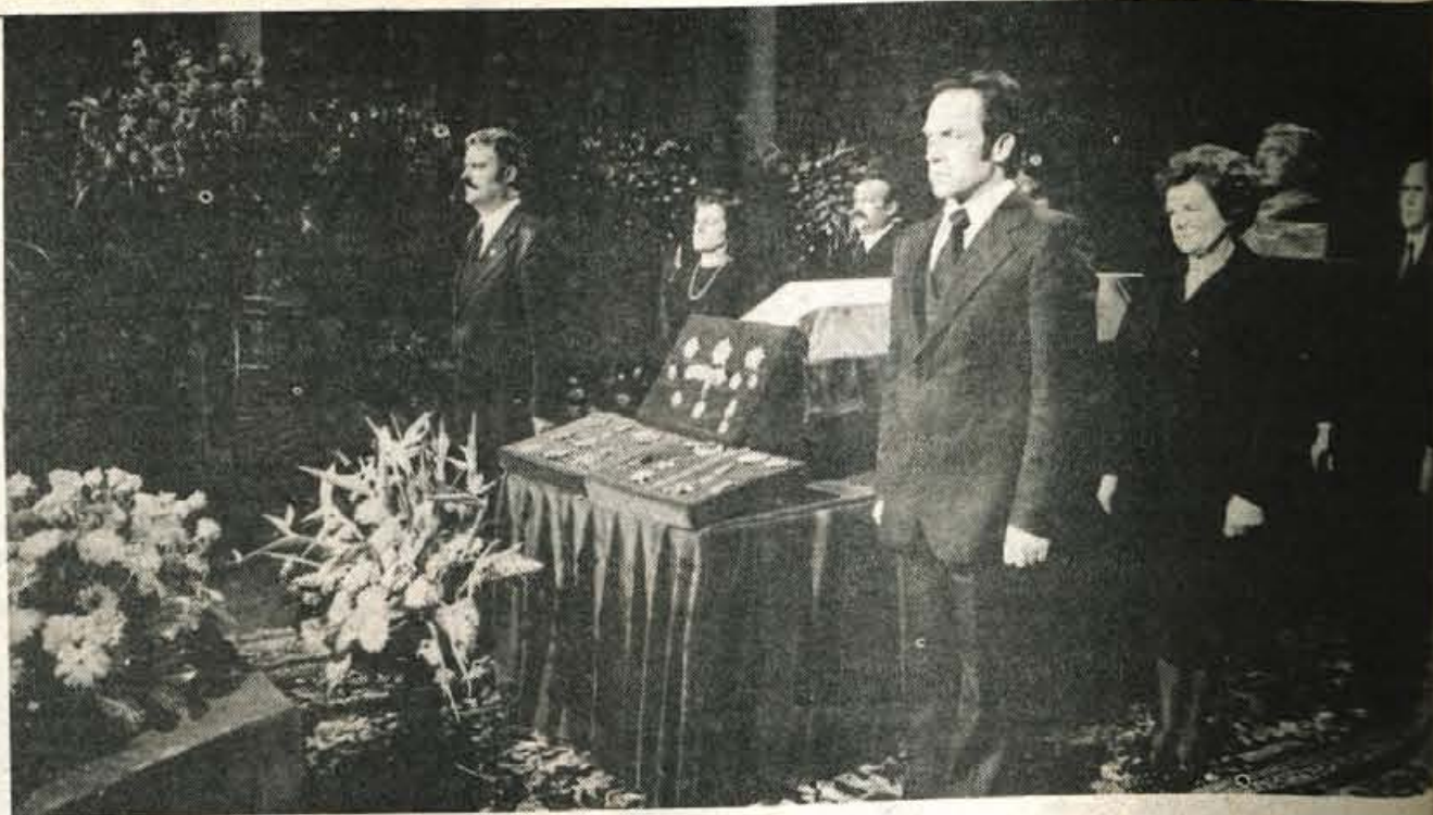
Nemo, z globoko bolečino v srcu, vendar ponosno, da je slovenski narod dal nam in svetu tako velikega sina, so se ob mrtvaškem odru v poslopju izvršnega sveta in predsedstva Slovenije menjavale častne straže. Spominu velikega revolucionarja so se poklonili tudi predstavniki gorenjskega družbenopolitičnega in gospodarskega življenja

Tovariš Kardelj, revolucionar – politik, je bil hkrati revolucionar – vojak. Tesno je povezoval marksistično teorijo z revolucionarno prakso in dal velik prispevek k zmagovitemu poteku NOB in socialistične revolucije. Vedno je s ponosom poudarjal, da je jugoslovanski narod in narodnosti s socialistično revolucijo uspelo ustvariti državno skupnost, ki je dovolj močna, da v današnjem svetu, v katerem se narodi še vedno soočajo z imperializmom in hegemonizmom, lahko zaščitijo vsakega izmed njih in vse skupaj, njihovo nacionalno neodvisnost in svobodno odločanje o poti socialistične izgradnje, ki si jo izberejo.