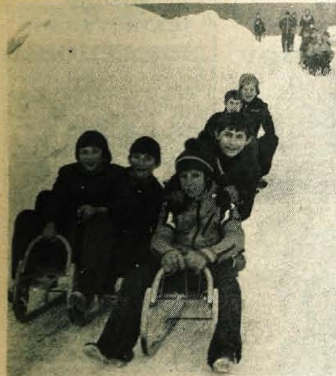
Zimake radosti – Učenci višjih razredov osnovne šole Matija Vlačič iz Labina so zimske počitnice preževali v Gozd-Martuljku. Vsak dan so se povzpeli tudi na Srednji vrh ter se odtod s sankami odpeljali v dolino. -fr