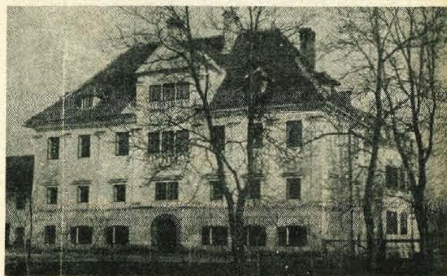
Gradič Groblje v letih med obema vojnama; zdaj stavbe ni več