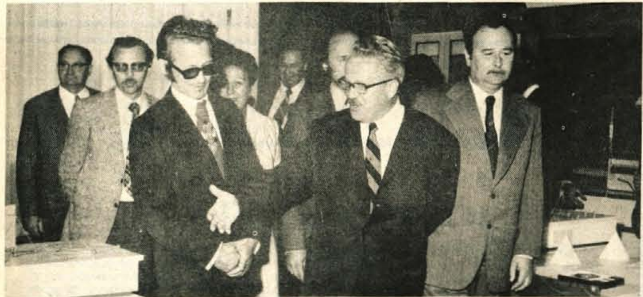
Kranj – Junija 1975 je bila otvoritev prizidka pri osnovni šoli Lucijan Seljak v Stražišču. Slovesnost, ki je bila ob krajevnem prazniku Stražišča, je počastil z obiskom tudi Edvard Kardelj ter si z zanimanjem ogledal sodobne šolske prostore.

Srečanja, ki jih je imel Edvard Kardelj z gorenjskimi delavci, predstavniki družbenopolitičnih organizacij morda niso bila tako česta, kot bi si vsi skupaj želeli, toda kadar se je nametil v ta del Slovenije, so srečanja s tem vedrim, prijaznim in tako preprostim človekom, kot je Kardelj bil, vedno bila dogodek, ki ga prisotni niso pozabili. Zadnji čas, ko zaradi bolezni še ni več odhajal od doma, pa so bila vrata njegovega doma pod Šmarno goro odprta za obiske in delegacije, ki jih ni bilo tako malo tudi z Gorenjske. Od svojega doma je Kardelj zadnja leta lahko le od daleč gledal proti planinam, kamor je poprej, če mu je le delo dopuščalo, tako rad zahajal. Nema lokrat je bil tudi na Triglavu, pa na drugih slovenskih gorah. Če je le mogel, je zelo rad prišel v gozdove Jelovice in tam z užitkom poznavalca, saj je poznal desetine in desetine gob, preiskal jelovška prostranstva. Kot redni in kot častni član kranjskega planinskega društva se je zanimal tudi za Planinski dom na Ledinah v Karavankah, ki so mu bile še posebej znane: tja čez so ga namreč vodile njegove prve ilegalne poti. Kranjski planinci so na večerajnji žalni seji zato predlagali, naj bi ta njihov dom imenovali po Edvardu Kardelju.