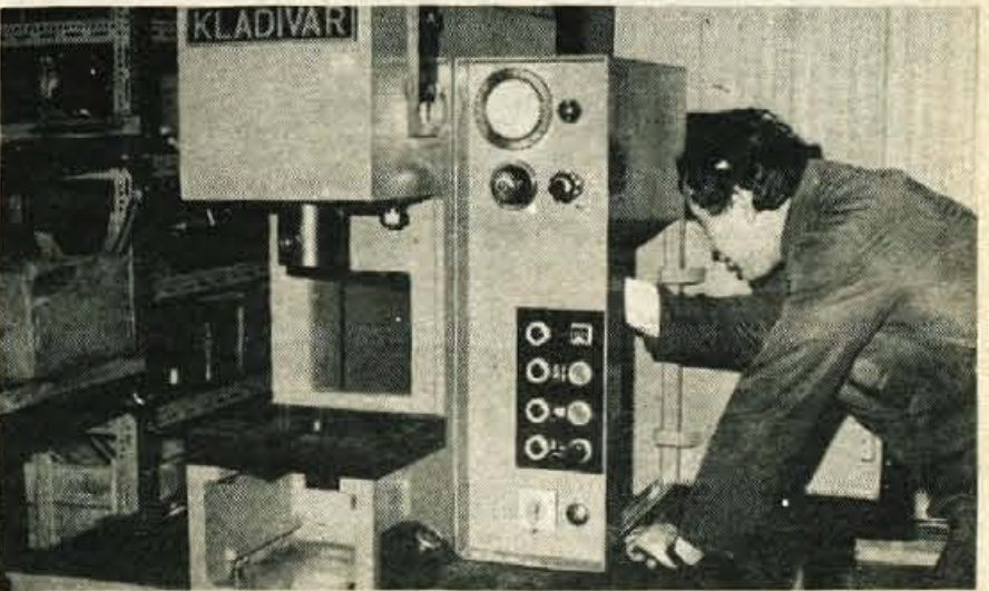
V žirovskem Kladvarju že nekaj let uvajajo sodobno tehnologijo proizvodnje. Zato so kupili veliko nove opreme, povezali pa so se tudi s fakulteto za strojništvo v Ljubljani, ki jim bo pomagala pri raziskavah proizvodnje hidravličnih komponent. — L. B.

Ker pozivi občinskega sindikalnega sveta za podpis sporazuma niso zalegli, so predlagali in pobuda je bila sprejeta tudi na občinski skupščini, da nobena temeljna organizacija združenega dela ne bo dobila soglasja za novo investicijo, če ne bo podpisala omenjenega sporazuma. L. Bogataj