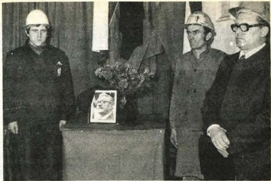
Jesenški železarji so počastili spomin na Edvarda Kardelja v nedeljo popoldne.