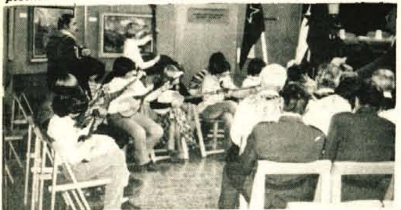
BOHINJSKA BISTRICA - Že vrsto let v Bistrici deluje tamburaški orkester, ki deluje v okviru šole dr. Janeza Mencingerja, sodi pa v okvir DPD Svoboda Tomaž Godec. Poleg številnih nastopov v bohinjškem kotu so igrali letos na srečanju planincev treh dežel v Bazovici, v Lescah, v Radovljici in drugod. Za svoje uspešno delo so lani prejeli posebno priznanje Zveze kulturnih organizacij Radovljica.