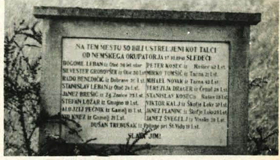
Spominska plošča na Lancovem, kjer je bila dne 17. oktobra 1941 poleg 16 moških talcev ustreljena tudi Rezka Dragar-Eva.

(55. zapis) Zdaj, ko gredo ti zapisi v mislih imam zapise iz Moravske doline in Črne grabna - h kraju in ker tudi zimsko vreme ni za potovanja po slabih kolovoznih poteh kaj prida prikladno - bom pač izbral predah in skušal dopolniti nekatere od prejšnjih zapisov.