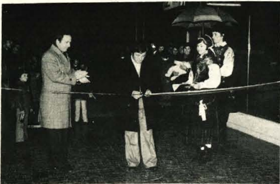
Poslovni in trgovski center Deteljica je odprl delavec SGP Tržič

V torek, 5. decembra, in v sredo, 6. decembra, bodo v občini ločene seje vseh treh zborov skupščine občine Radovljica. Na sejah bodo delegati razpravljali o poročilu o gospodarskih gibanjih v občini v devetih mesecih, o resoluciji o politiki ureditve družbenega plana občine Radovljica za obdobje 1976 do 1980 v naslednjem letu, o rebalansu proračuna občine ter o nekaterih drugih vprašanjih. Gradivo za seje zborov skupščine objavljamo na 5. strani, medtem ko objavljamo pod naslovom Dogovorili smo se na 6. strani sklepe delegatov z minule skupne seje vseh treh zborov.