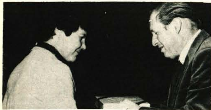
JESENICE - V kulturnem sporedu ob slavnostni podelitvi letošnjih Čufarjevih plaket, ki je bila 24. novembra v jeseniškem gledališču, je nastopil tudi mladinski pevski zbor z Jesenic. Zapel je dve pesmi domačih skladateljev. - S - Foto: J. Zaplotnik

Pismene ponudbe sprejema kadrovski oddelek Kranj, Koroška c. 5, 15 dni po objavi. Kandidati bodo o izbiri obveščeni v 30 dneh po izteku prijavnega roka.