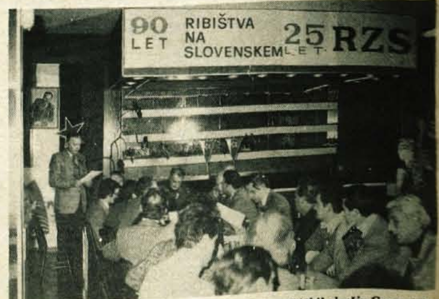
RADOVLJICA – Na zboru delegatov Zveze ribiških družin Gorenjske so se pogovorili o problemih gorenjskih ribiških družin in predvsem poudarili pomen nadaljnega varstva gorenjskih voda.