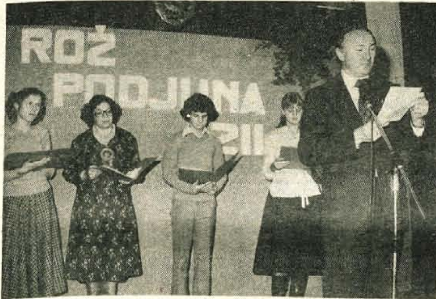
RADOVLJICA — Letos so v avli osnovne šole Antona Tomaža Linhart pripravili že tretjič Koroški večer, na katerem so se predstavili člani Linhartovega odra, koroški pesniki in ženski pevski zbor z Obirskega.