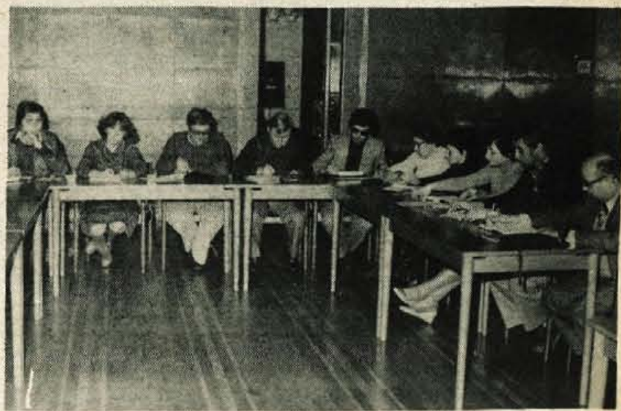
REDNE NOVINARSKKE KONFERENCE — Srečanja predstavnikov občinske skupščine in družbenopolitičnih organizacij Kranja s predstavniki sredstev javnega obveščanja bodo odslej redne. Pretekli teden je bila prva, sledile pa ji bodo druge, na katerih bo govora o aktualnih kranjskih problemih. (jk) — Foto: J. Zaplotnik

KRANJ — V petek, 24. novembra, ob 13.15 bo Kranj pričel pomembnemu dogodku. Pri tovarni Planika bo predstavnik republiškega izvršnega sveta vzdal temeljni kamen za nov most prek Save med Laborami in Planino. Prvih del so se graditelji že lotili. Most bo dolg 366 metrov in širok 24 metrov, grajen pa bo iz betona in jekla. Gradila ga bosta Gradbincev Kranj in Metalna iz Maribora. 17 milijard starih dinarjev, kolikor bo gradnja veljala, bosta zagotovila republiška skupnost za ceste in skupščina občine Kranj. Most bo predvidoma zgrajen do 1. septembra leta 1980 in bo rešil veliko sedanjih prometnih zagat v Kranju. —jk