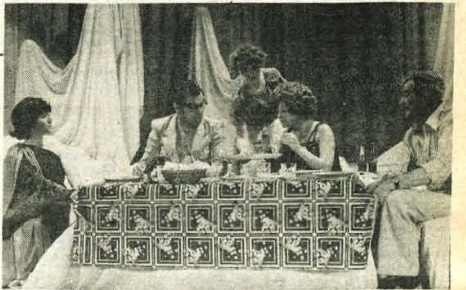
Prizor iz komedije Človek na položaju