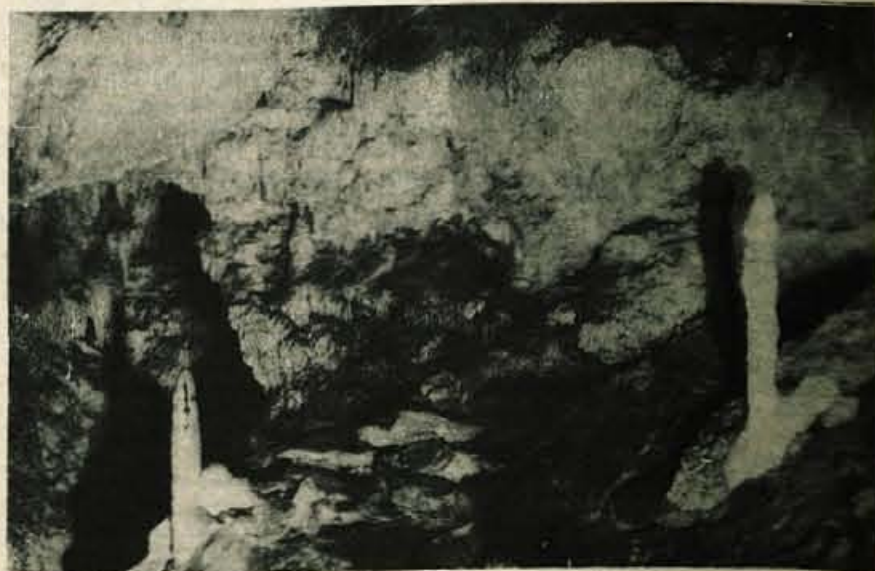
Ena od kapniških jam na gorjuškem področju se imenuje Miševa jama (na sliki le delec notranjščine).