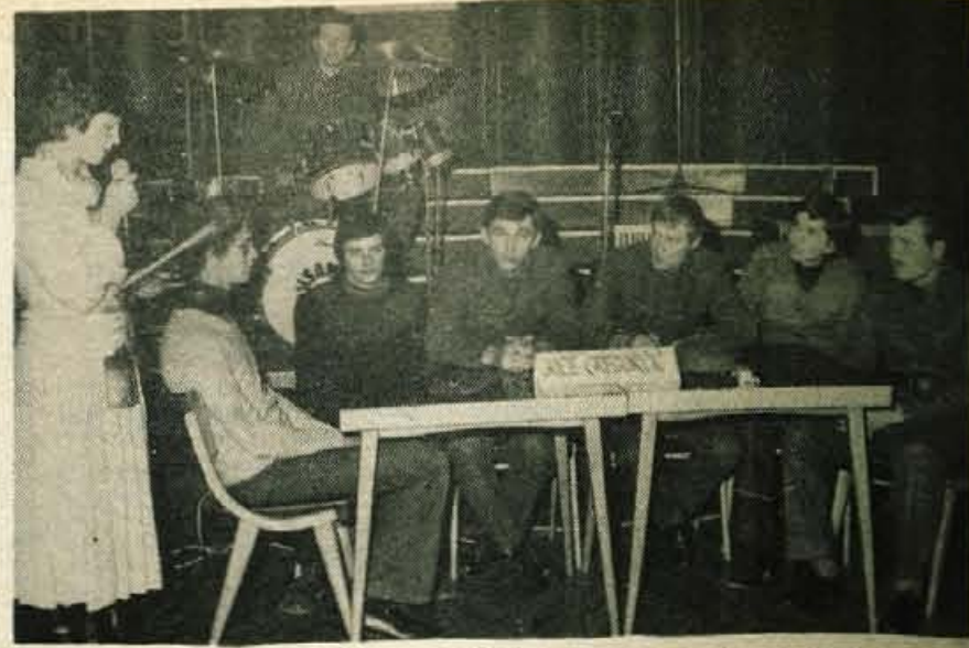
Ekipa Jože Gregorič iz Skofje Loke bo v znanju na temo 11. kongresa ZKJ nastopila na republiški prireditvi Mladost v pesmi, besedi in spretnosti.

Kranjski izvršni svet zasedal – Na 28. seji, ki se bo nadaljevala danes, se je sskel izvršni svet kranjske občinske skupščine. Razpravljali so o uresničevanju dogovora o kadrovske politiki, o odstranjanju posledice potresa in o osnutku predloga odluka o razvrščanju črnih gradenj. J. Kosnjek