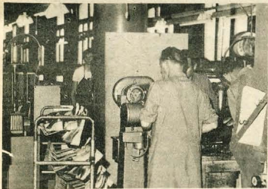
Več kot polovico obutve, ki jo naredijo v Planiki, prodajo na tuje.