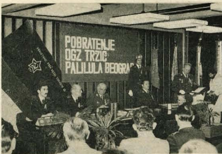
Predsednika občinskih gasilskih zvez iz Palilule in Tržiča sta podpisala listino o pobratenju.