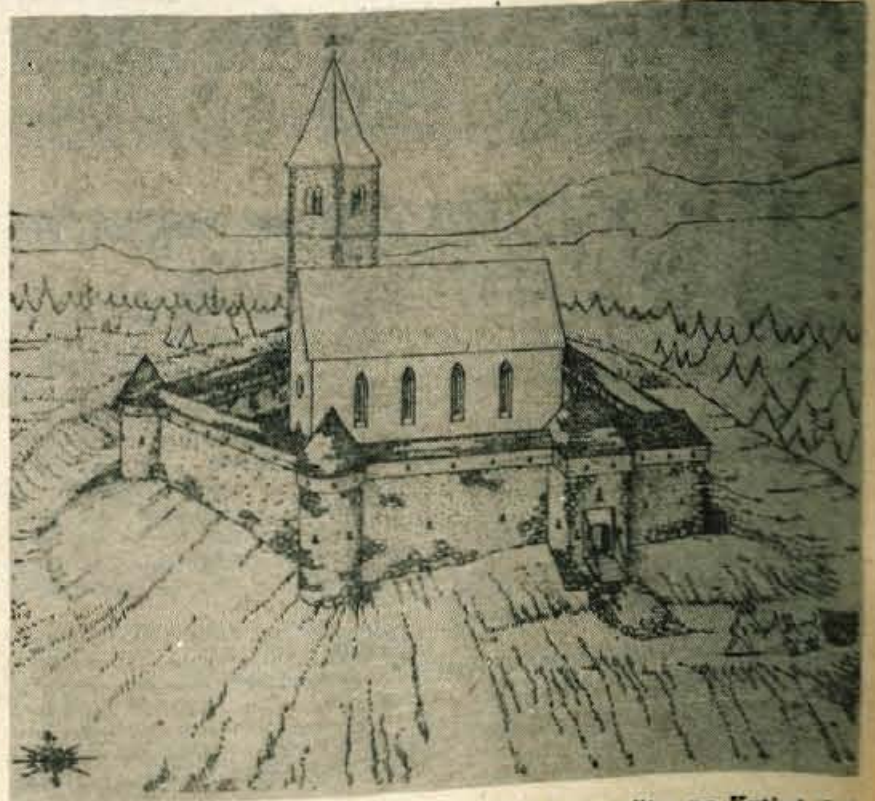
Domnevena podoba (rekonstrukcija) taborske ureditve na Krtini, kot si jo je zamislil arhitekt P. Fister.

TA HIŠA JE BILA ŽE VEČ LET PRED DRUGO SVETOVNO VOJNO ZANESLJIVA POSTOJANKA PARTIJE.