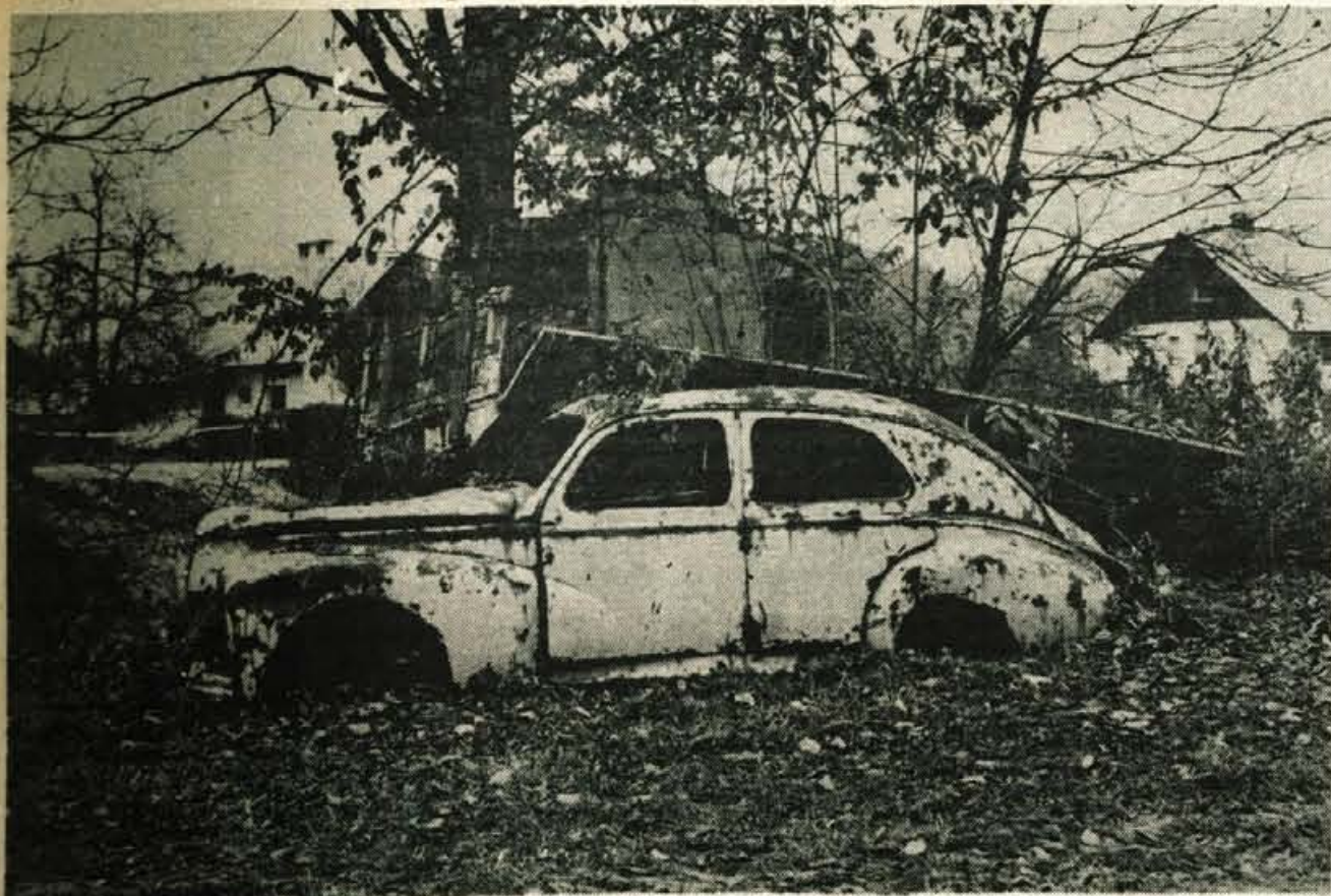
SPOMENIK MALOMARNOSTI – Lastniku teh razpadajočih avtomobilov očitno ni mar za okolje, saj že leta in leta počivata njegova razbita avtomobila tik ob cesti Nova vas – Zapuže.