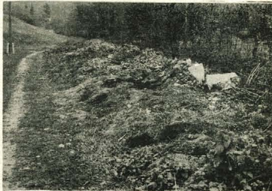
ODPADKI OB SPREHAJALNI POTI – Psihiatrična bolnica Begunje bi morala poskrbeti, da ob sprehajalni poti ne bi bilo toliko odpadkov in da prav to odlagališče ne bi veljalo za enega največjih in najbolj spornih v krajevni skupnosti.