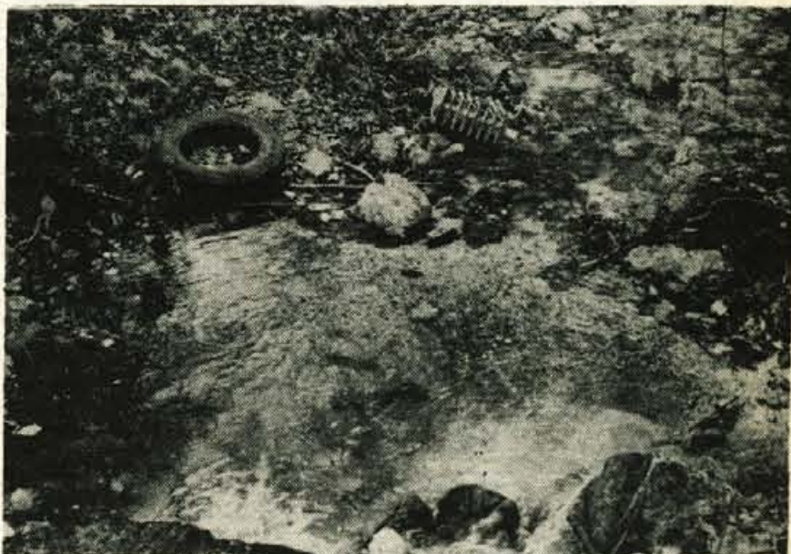
NEČISTA BEGUNJSČICA – Potok je očitno onesnažen, vzdolž struge, ki se vije ob naselju, je vse polno papirja, vrečk, polivinila in skratka vsega tistega, kar sodi v smetnjake.

skupnost še nima kontejnerja in ker so le nekateri krajanji nabavili posode za smeti. Turistično društvo samo nima namenskih sredstev za nabavo kontejnerja in prav gotovo bi morali v okviru krajevne skupnosti poskrbeti za to, da se čimprej nabavi. Krajanji plačujejo komunalni skupnosti denar za odvoz smeti, odpadki pa ostajajo ob potokih, pokopališču, na travnikih, kar je prav gotovo nasprejemljivo.