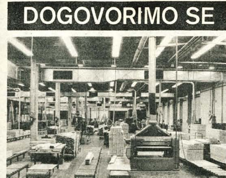
Vse investicije Alplesa so izredno skrbno pripravljene.