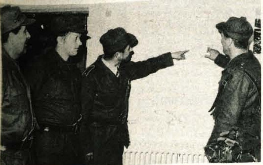
PRESKUS BOJA Z DESANTOM - Čeprav je nedeljsko slabo vreme preprečilo desant padalcev, ki tudi v vojnih razmerah ne bi bil izvedljivo, je skoraj dvodnevna vojaška štabna vaja »Bistrica 78« v bližini občine uspela. V vaji so bile preskušene skoraj vse faze priprav na teritorialno obrambo z desantnimi enotami v sodelovanju z avtoroboroženim prebivalstvom. Vaja ni združila le vojaškega dela vseobsežno, temveč tudi vse organe za ljudsko obrambo krajevne obrambe, prav tako pa je bila dosežena in sprotno analizirana dinamika vaje. Sprožena je bila tudi akcija posredovanja enot civilne zaštite. (jk)