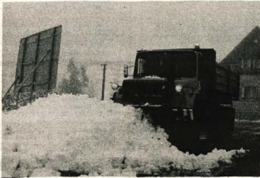
Za snežne pluge Cestnega podjetja Kranj je bil letošnji počitek kratak. V nedeljo je morala prva ekipa že na Jezerski vrh, kjer je zapadlo kar 30 centimetrov snega