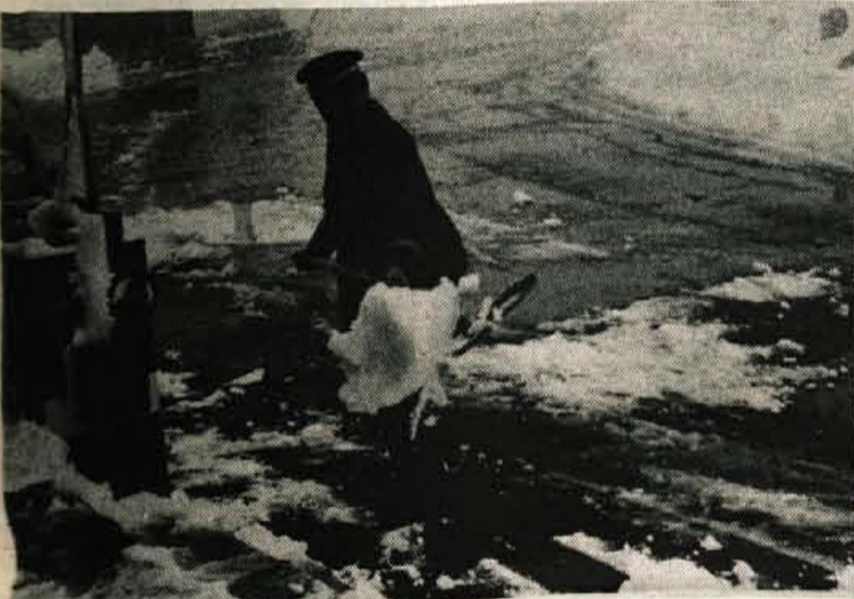
Tudi lopata je bila dobrodošla

Zaradi močnega deževja se je v Sp. Gorjah pod cesto Bled—Jesenice sprožil zemeljski plaz v širini petih metrov in zdrsel kakih 100 metrov po strmini do reke Radovne ter pri tem polomil nekaj dreves. Občani so sami zavarovali cesto, o oviri pa je obveščeno Cestno podjetje Kranj.