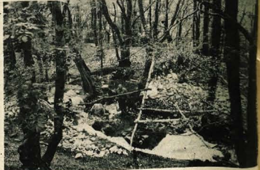
Narvhu Ajdne je bogastvo, ki prekaša vse »zaklade«