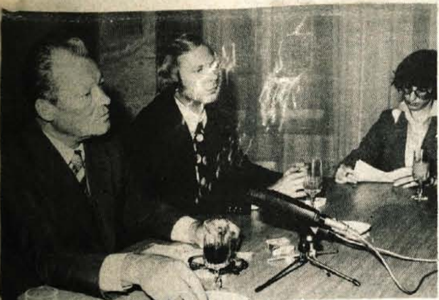
Willy Brandt med novinarsko konferenco na Bledu, kjer je ocenil mednarodni položaj in menil, da bo njegov obisk prispeval k sodelovanju med SPD in ZKJ ter med Jugoslavijo in ZRN.