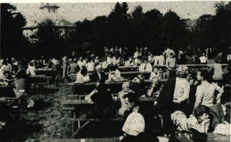
Tovariškega srečanja na Okroglem se je udeležilo okrog 1500 slepih in slabovidnih ter njihovih spremljevalcev iz vse Slovenije.

vsakega našel prijetno besedo in čas za prijateljski stisk roke.