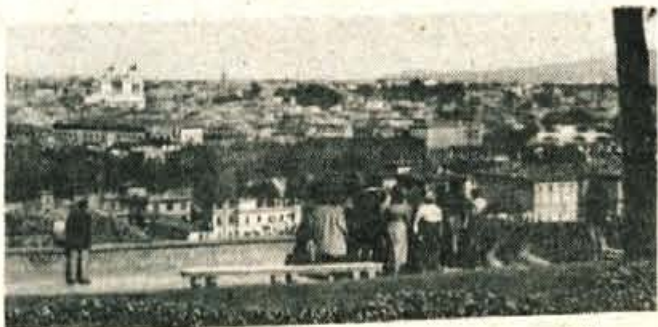
Panorama Rima z enega od sedmih rimskih gričev - Gianicola.