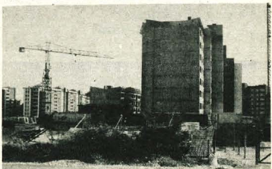
Kranj — Na prihodnji seji vseh zborov kranjske občinske skupščine bodo razpravljali tudi o spremembah urbanističnega načrta mesta Kranja. Gre za spremembo na območju, ki bo urejeno s predvidenim zazidalnim načrtom Planina II. To območje je namenjeno za stanovanjske in druge spremljajoče objekte.

Prometno se industrijsko središče navezuje na železnico z novim industrijskim tihom preko novega nadvoza. Načrt vključuje tudi regulacijo struge Save vzdolž novega središča. D.S.