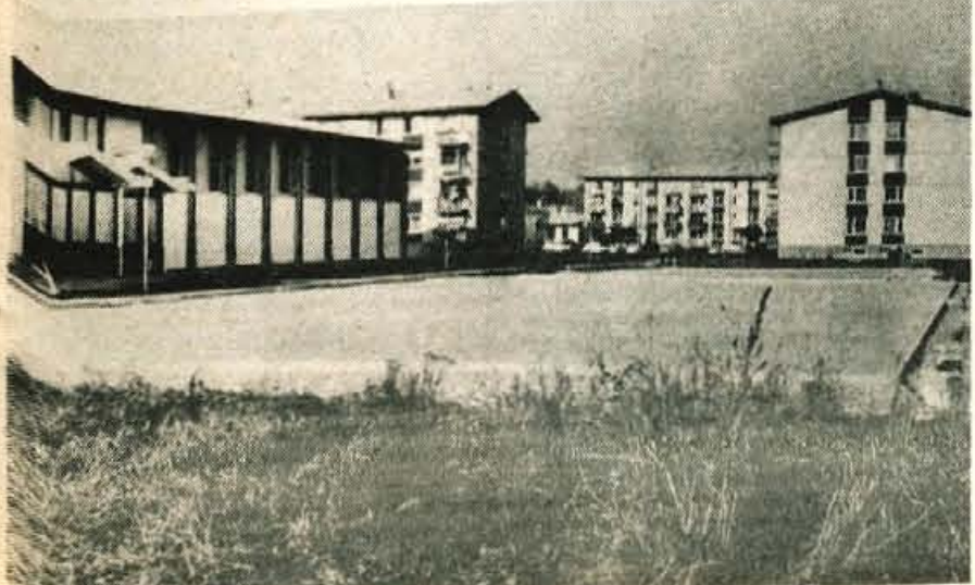
Izvršni svet kranjske občinske skupščine za sredino zasedanje vseh zborov predlaga več stališč in sklepov o urejanju prostora in urbanizma v občini.

Delegati vseh zborov sredinega zasedanja kranjske občinske skupščine bodo razpravljali in sklepali tudi o izvolitvi delegata v odbor podpisnikov družbenega dogovora o načinu uporabe in upravljanja s sredstvi solidarnosti za odpravljanje posledic naravnih nesreč. Odbor deluje na območju republike Slovenije. V njem je predlagan za prihodnje dveletno mandatno obdobje za območje gorenjske in ljubljanske regije predsednik kranjske občinske skupščine Tone Volčič. Zdaj je bil v tem odboru za obe regiji predstavnik iz ljubljanske regije.