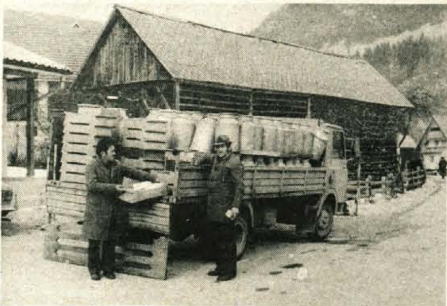
Stara Fužina - Vsakdanji prizori v bohinjškem kotu, kjer še vedno odzamejo dnevno precejšnje količine mleka in ga odpeljejo v mlekarino v Srednji vasi, kjer mleko predelujejo v mlečne izdelke.

Do zdaj so zbrali 9 milijonov 146.000 dinarjev, ki so jih prispevale delovne organizacije in zasebniki. Za dogovorjenim sklepom predvsem zaostajajo zasebni obrtniki, saj je od 100 podpisnikov poravnalo svojo obveznost v letu 1975 le polovica, v letu 1976 pa le 11 obrtnikov.