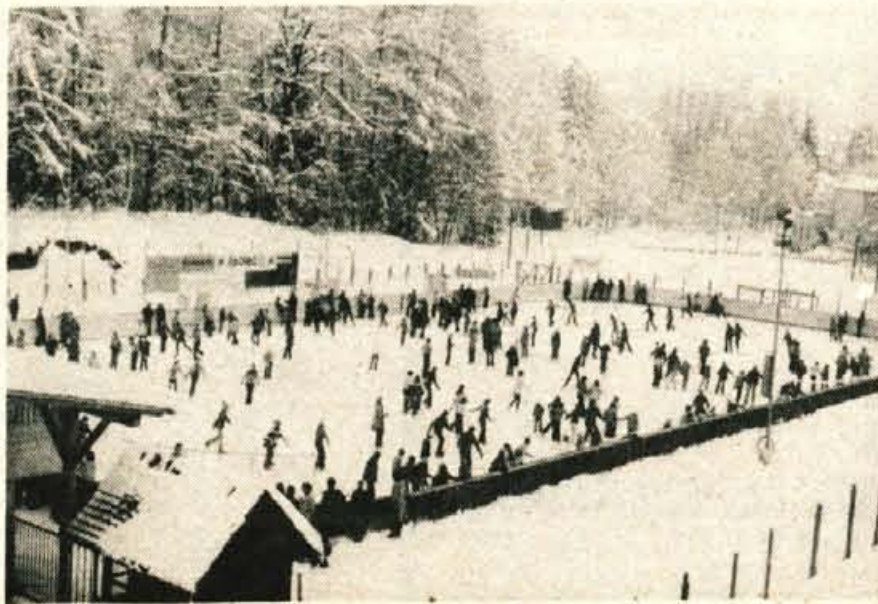
Bled – Blejsko drsališče je vedno polno, komaj kaj prostora pa bodo našli drsalci v teh dneh, ko so šolske zimske počitnice.

Pri Turističnem društvu Bled, kjer bodo obiskovalcem Bleda poskušali še najti prosto ležišče, se med drugim pripravljajo na organizacijo tradicionalne pustne povorke, obenem pa so se z vso resnostjo lotili tudi dela ob izdaji novega barvnega prospekta Bleda. Izdali ga bodo v 300.000 izvodih. – D. S.