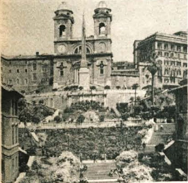
Španske stopnice - polne cvetja in hipijev. Če zavijete levo, v ulico Via Condotti, pridete v kavarnico Caffe Greco, kjer se je nekoč zbirala smetana evropske piščice in inteligence

Pri Berninijevem vodometu zavijemo v ulico Via Condotti, kjer čepi znamenita antična kavarnica CAFFE GRECO, s slikami Bleda in Blejskega gradu po stenah hodnika, da človeka prijetno stisne pri srcu.