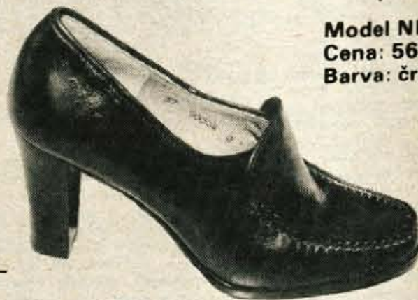
Model NIKA Cena: 563,35 din Barva: črna, mocca