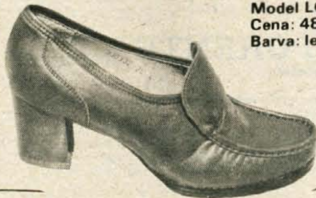
Model LOLITA Cena: 488,90 din Barva: les, teak, črna