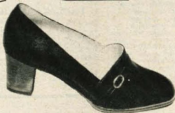
Model DUŠA Cena: 458 din Barva: črna, rjava