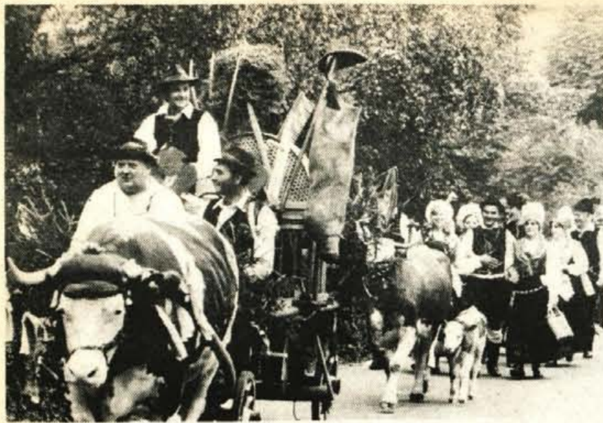
Posteljo, zibelko, kolovrat, posodo, sklednik, koš, kokoši, kravo in še marsikaj bo potrebovala Kežjarjeva »tamlada« na novi življenjski poti. Prevoz bale z nevestinega doma pri Piberču na ženinov dom h Kežjarju je spremljalo tudi mnogo turistov in domačinov.