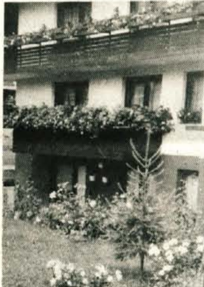
Bled - Na Gorenjskem so se vsa turistična društva vključila v prizadevanja za lepšo okolico. Pri gojitvi rož in krasitvi svojih stanovanjskih okolišev pa so vsakor zelo prizadevni prebivalci stanovanjskih blokov na Jaršah pri Bledu, posebno na Alpski cesti 3.