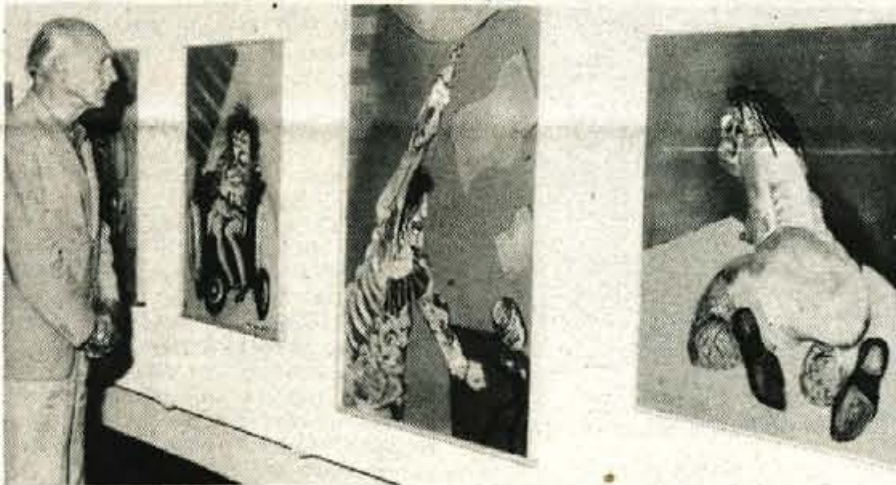
KRANJ – V galeriji mestne hiše v Kranju je do 17. avgusta odprta razstava akad. slikarja Marjana Skumavca.