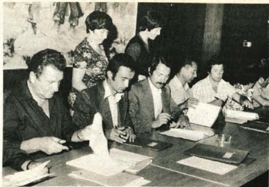
Podpisu pogodbe v prostorih samoupravne stanovanjske skupnosti občine Kranj so prisostvovali tudi predstavniki družbenopolitičnega življenja občine.

Tržaška menjalnica in nekatere banke menjajo večino vzhodnih valut, čeprav niso konvertibilne. Za češkoslovaško krono se dobi 33 lir, za bolgarski lev 300 lir, romunski lej 25,5 lire, poljski zlot 6 lir, grško drahmo 26 lir, turško liro 30 lir, za drobni madžarski forint 26,5 lire in za debeli 28 lir. Najnižje kotirata poljski zlot in sovjetski rubelj.