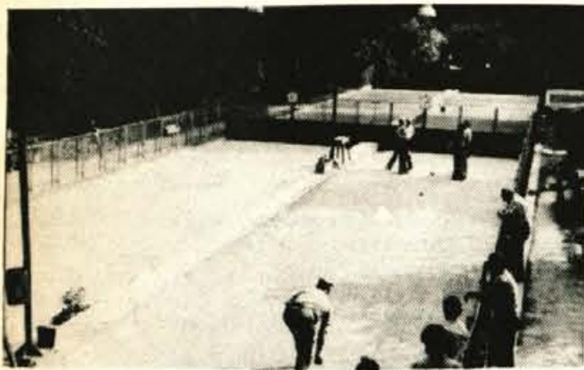
UREJENO BALINIŠČE - Prizadevalni člani Balinarskega kluba Jesenice so v logu Ivana Krivca uredili še dve balinarski stezi, pri čemer so opravili veliko prostovoljnega dela, pomagale pa so jim tudi delovne organizacije. Prva velika prireditelja na novem balinišču je bil mednarodni turnir v počastitev občinskega praznika - B. B.