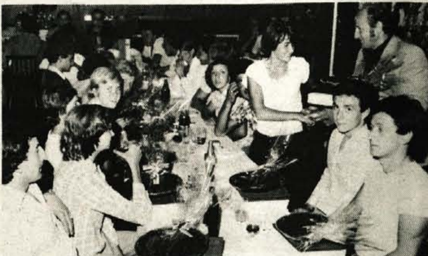
Tovarna IBI iz Kranja je bila pokrovitelj reprezentance Bolgarije. Za svoje goste so pripravili sprejem v hotelu Grajski dvor v Radovljici.