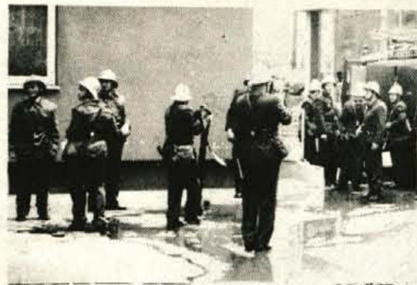
Jesenice - Poklicna gasilska in reševalna enota Železarne Jesenice ima v jeseniški občini pomembno nalogo obrambe pred ognjem in nudenja pomoči v naravnih ter drugih nesrečah. Enota je zdaj dobro opremljena, manjka ji le še avtomatska lestev za gašenje in reševanje iz visokih stavb. Vendar kaže, da bodo gasilci tudi to napravo kmalu dobili. Na sliki: Poklicni gasilci jeseniške železarne med mokro vajo. - B. B.