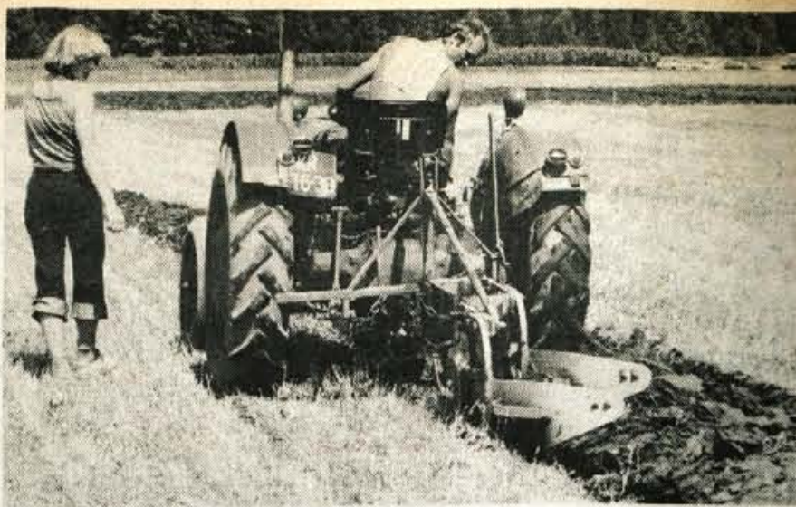
Gorenjsko tekmovanje traktoristov je potekalo na polju za Vasco. Paziti je bilo treba zlasti na globino oranja, sicer splošni videz parcele ni bil najlepši.