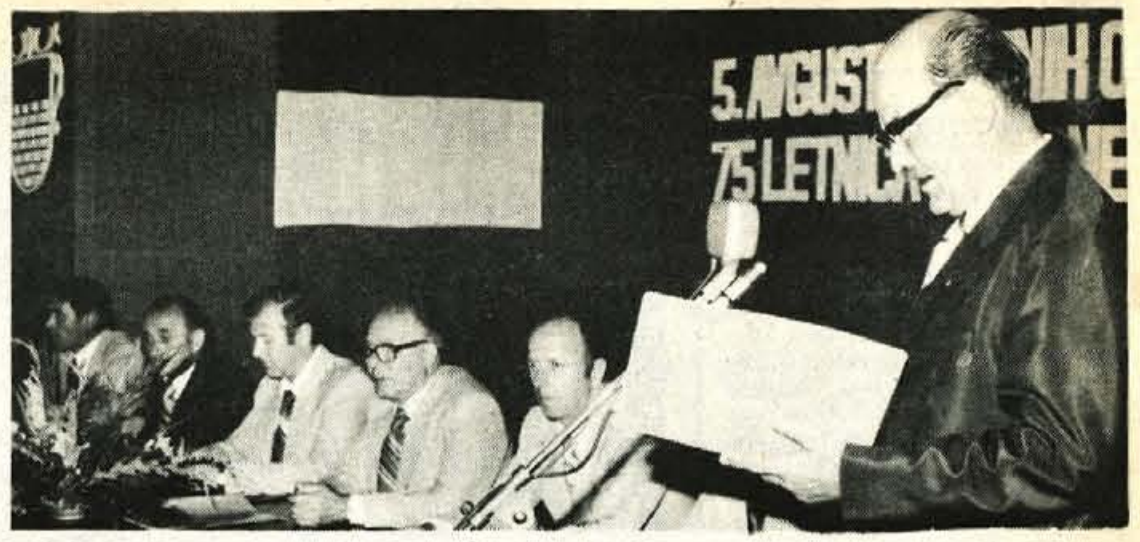
RADOVLJICA – S slavnostno sejo skupščine v novem skladišču Žita v Lescah so konec prejšnjega tedna nadsečno svečano proslavili občinski praznik, ki so ga spremljale tudi številne kulturne in športne prireditve.