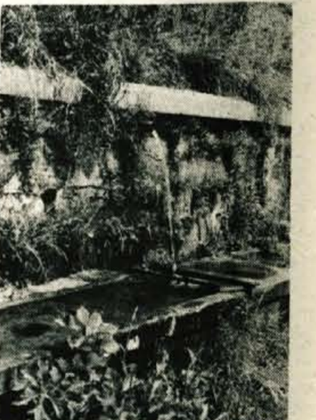
V vaškem koritu pa vre in pění se bistri studenec - v njem partizani gase žejo si mimo gredé.

Blagovica je v času vojne mnogo prestala. Tu so imeli sedež nemški žandarji - zato so bili spopadi med njimi in partizani kar česti. Lep, visok granitni spomenik NOB stoji ob cesti. Vklasan napis pove, da je padlo za svobodo 19 domačinov, 10 jih je umrlo na posledicah fašističnega terorja, 3 so umrli v taborišču; kot talci so omahnil v smrt tudi trije. - 35 življenj je položila na oltar domovine mala Blagovica!