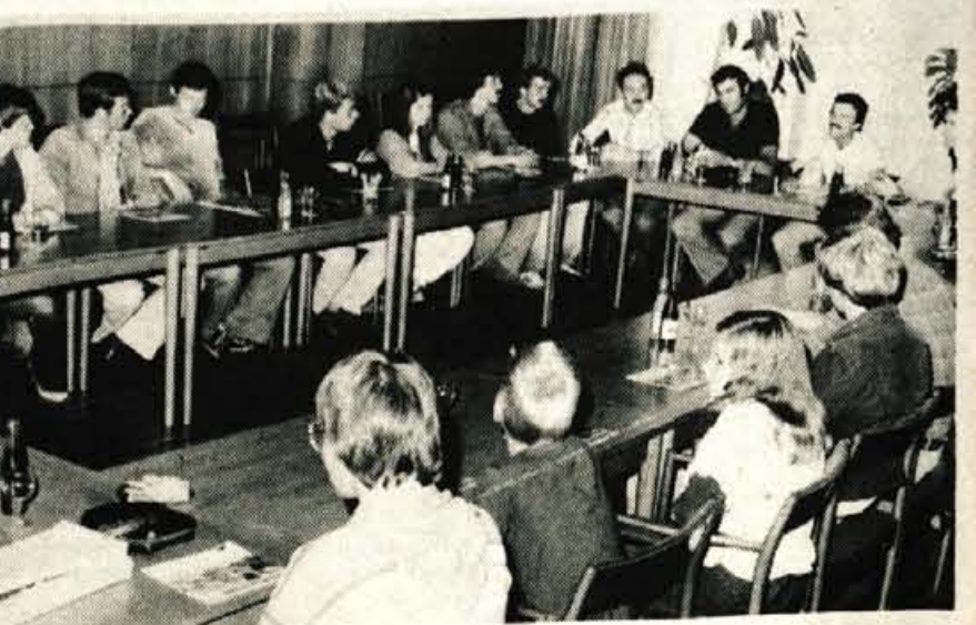
KRANJ — Na povabilo VK Triglav so v Kranj prišli vaterpolisti iz Greningena (Nizozemska). V prostorih skupščine občine jih je sprejel podpredsednik IS SO Kranj Milan Bajželj. Gostje iz Nizozemske so igrali tudi prijateljsko tekmo s Triglavom. Zmagali so prvotigaši. Izid srečanja — Triglav : Greningen 16:4. Danes zvečer ob 18. uri se bo člansko moštvo Triglava v letnem bazenu pomerilo z mladinsko reprezentanco iz Budimpešte (Madžarska). To so vaterpolisti centralne madžarske vaterpolske šole. Le-ta je v njihovem glavnem mestu. (h)