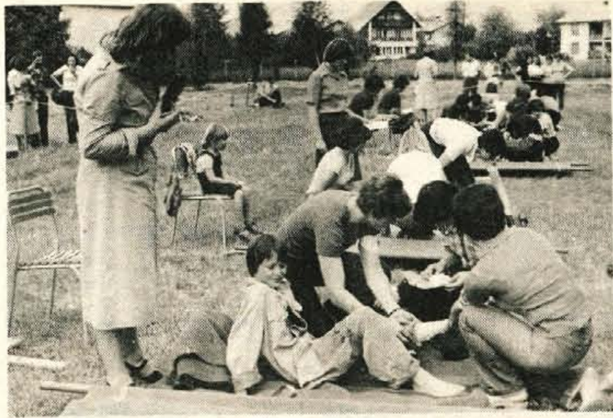
Radovljica - V petek, 9. junija, je bilo na kopalnišči v Radovljici občinsko tekmovalna ekip civilne zaštite za prvo pomoč, kar je le ena izmed prireditelj, ki jih pripravlja občinski štab civilne zaštite občine Radovljica ob 20. juniju, dnevu civilne zaštite. Ob tej priložnosti so v graščini odprli tudi razstavo Divilna zaštita kot pomemben člen ljudske obrambe in družbene samozastite, pripravili pa bodo tudi slavnostno sejo občinskega štaba, razstavo pa prenesli še na Bled v dvorano Gozdnega gospodarstva Bled in v osnovno šolo Bohinjska Bistrica.

Reteče - V Kulturnem domu v Retečah pri Škofji Loki so gorenjska društva invalidov pripravila za svoje težje prizadete člane že četrto tovrstno srečanje. Na srečanju so govorili o skupnih problemih, predvsem pa o usposabljanju invalidov za delo ter o težavah, s katerimi se srečujejo pri tem. Društva invalidov štejejo na Gorenjskem okoli 2500 članov in v večini občin sodijo med najdelavnejše organizacije. Na srečanju so pripravili tudi pester kulturni program.