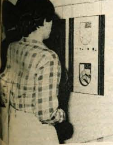
Deleži za kranjski grb — V galeriji Prešernove hiše v Kranju bo še nekaj dni razstava osnutkov za novi grb kranjske občine. Razpravljenih je pet predlogov, od katerih je pet dokaj sprejemljivih. To so »Nageljska«, »Kranj 27«, »23347« in »2000«. Obiskovalci razstave lahko v knjigo svoje mnenje ali predlog, kateri osnutek bi bil po njihovem mnenju bolj primeren za novi grb občine Kranj. Ogled razstave še posebej priporočamo delegatom kranjske občinske skupščine.

Na koncu mi je še zaupal, da gre z učenjem kar lepo in da je »potrebno« poprečno oceno presejel.