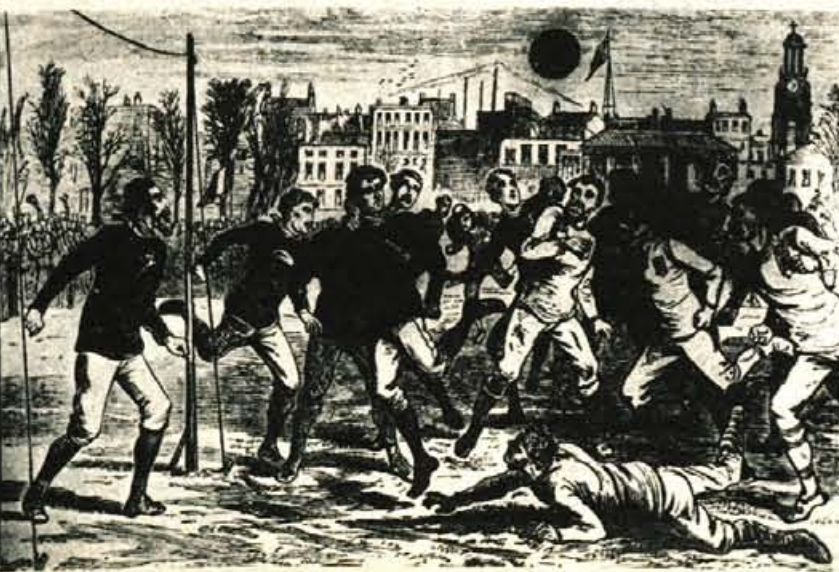
Motiv z ene prvih mednarodnih nogometnih tekem v zgodovini nogometa. Odigrali sta jo reprezentanci Anglije in Škotske leta 1873 v Glasgowu.

ski državi preganjale bradate Barbare, prav gotovo z enako »zavezatostjo« (ali »krvoločnostjo«, če povemo še bolj po pravici) podili tudi za žogi podobnim okroglim predmetom.