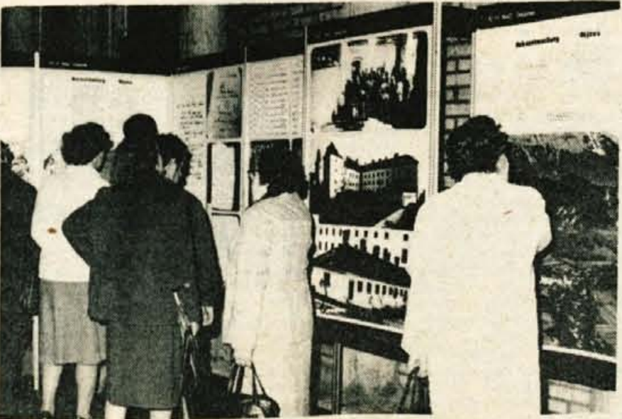
Talci na Gorenjskem — Gorenjski muzej iz Kranja je pripravil v hali A Gorenjskega sejma v Kranju razstavo o talcih na Gorenjskem. Razstava je bila prijetna popestritev X. jubilejnega zborna gorenjskih aktivistov in borcev. (jk)

Strokovno in organizacijsko delo, ki ga opravljajo Zveze kulturnih organizacij, je brez dvoma letos pokazalo lepe sadove. Kranjčanom, ki že dolgo časa potrjujejo, da so v samem vrhu gledališke ustvarjalnosti, je izbor za Borštnikovo srečanje profesionalnih gledališč le še eno potrdilo več o njihovi kvaliteti. Radovljiški Linhartov oder pa je po komaj enoletnem obstoju zacvetel s klasičnim Matičkom: prav škoda bi bilo, če bi prostorske težave, v Radovljici namreč ni nobene primerne dvorane, takšno vitalno ustvarjalnost zadušile. L. Mencinger