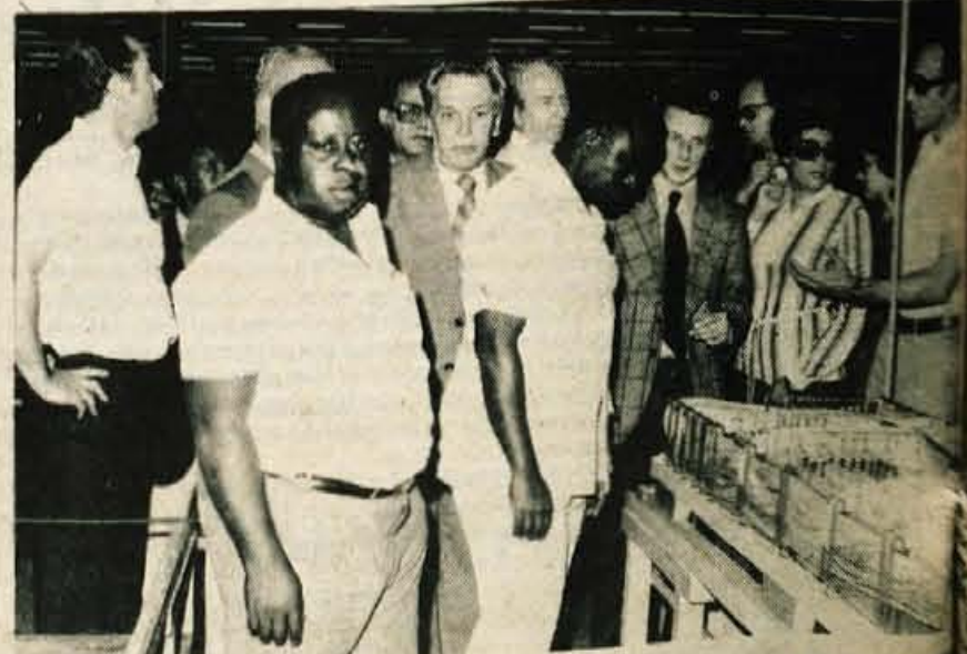
V petek so Iskra obiskali predstavniki bank iz dežel v razvoju, ki so se na večdnevnem obisku v naši republiki. S predstavniki vlade, bank in delovnih organizacij so se pogovarjali o boljši bančništva v deželah v razvoju, pomenu sodelovanja med njimi za boljše mednarodne odnose in boljši spodarstvo ureditve.