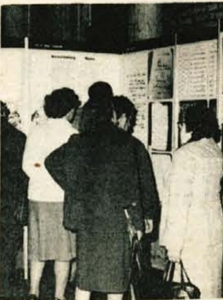
Talci na Gorenjskem — Gorenjski muzej iz Kranja je pripravil v hali A Gorenjskega sejma v Kranju razstavo o talcih na Gorenjskem. Razstava je bila prijetna popestritev X. jubilejnega zborna gorenjskih aktivistov in borcev. (jk)

Če bodo knjižarne priznavale 5-odstotni popust zaradi nabave na debelo, bodo šole ta dobiček namenile delno nabavi novih učbenikov, delno pa raznim stroškom. Akcija za brezplačne učbenike pomeni tako prvi korak k uresnitvi naloge, da bi učenci dobivali učbenike zastoj. Šola bo povsem prevzela od staršev odgovornost, kje in kdaj kupiti potrebne učbenike, delovne učbenike in delovne zvezke, kar pomeni znaten prihranek pri času. Na šolah le upajo, da bodo prav vsi starši akcijo podprli in bodo tako učenci dobivali učbenike zastoj, ob enem pa bolj cenili in lepše ravnali s knjigami. D. S.