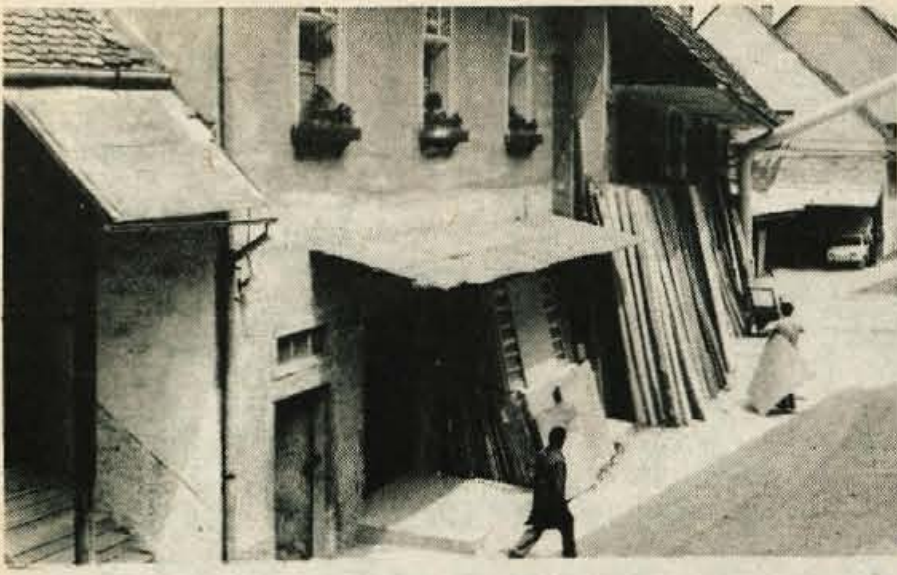
Obrtnik iz Škofje Loke se stiska v starih grajskih hlevih, zato pripravljajo gradnjo novih delavnic na Grencu.