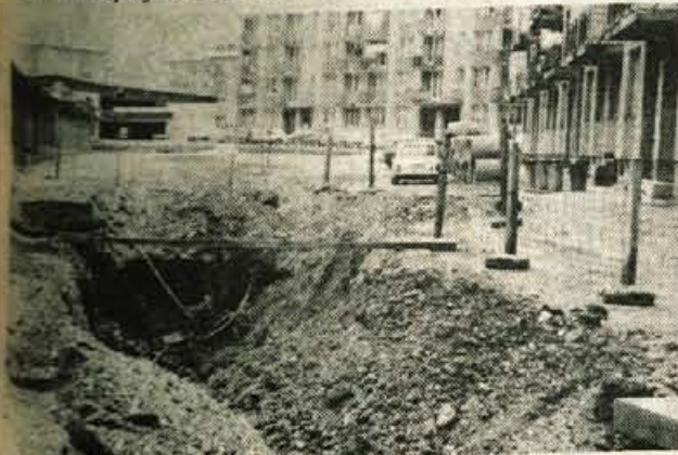
Lesce — Za ogrevanje poslopij šolskega centra napekujejo delavci Kovinarja in IMP Ljubljana toplovod ter prave ob enem tudi kanalizacijo. Na sliki: gradnja kanalizacije po cesti revolucije ob gradbišču novega šolskega centra na Plavžu.