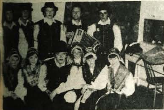
Dovje — Na Dovjem in v Mojstrani že vrsto let deluje folklorna skupina KUD Jaka Rabič Dovje — Mojstrana. Vedno se vanjo vključuje dovolj mladih, člani skupine pa vedno nastopajo. — B. B.