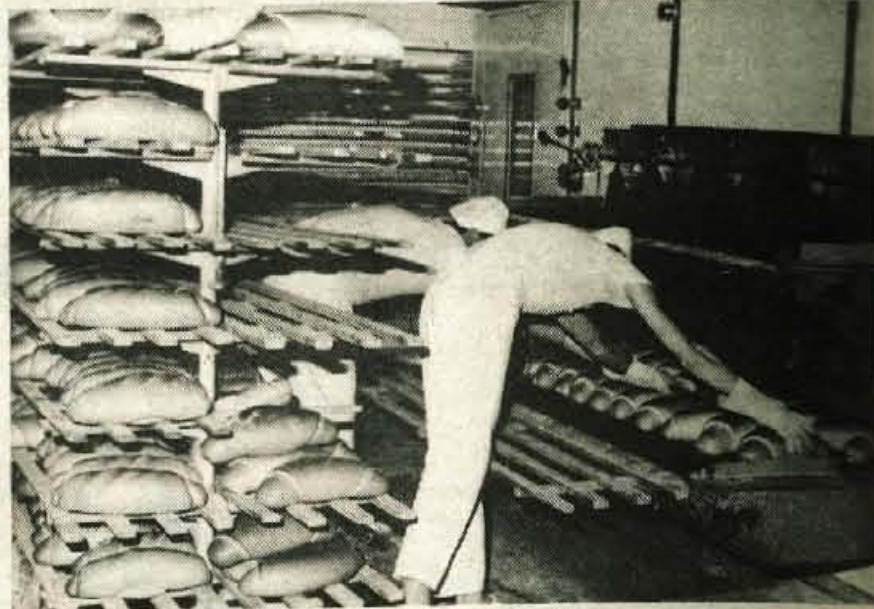
Da lahko napečejo dovolj kruha, so peči že trikrat predelali.

Ker so zmogljivosti pekarnice premajhne in je ob koncu tedna potrebno napeči kruha za dva dni, delajo peki nepretrgoma od druge ure v petek do osme ure v soboto. V slaščičarni pa v petek začnejo ob treh in delajo do štirnajstih, potem spet pridejo ob 22. uri istega dne in končajo v soboto zjutraj.