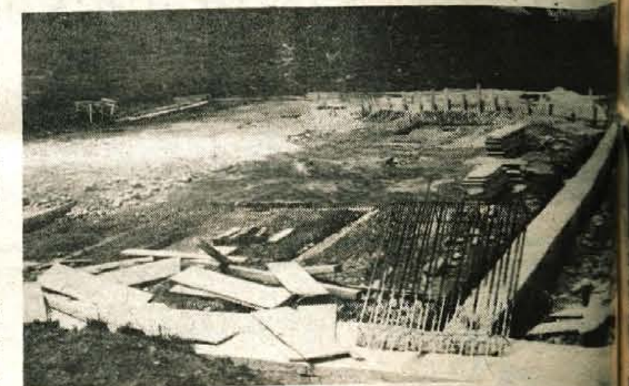
Radovljica — Občani krajevne skupnosti Radovljica plačujejo krajevni samopriopek za izgradnjo mrliških vežic in pokopališča ter dostopa na pokopališče, SGP Gorenjec pa zavlačuje z izgradnjo ob veliki nejevolji vseh radovljčanov.

Jesenice — V nedeljo, 21. maja, ob 18.30 se je na cesti med Jesenicami in Planino pod Golico pripetila prometna nezgoda. Voznik osebnega avtomobila Božo Gagič (roj. 1953) iz Jesenic se je v desnem ovinku pri Žerjavcu zaletel v začetek drsne ograje in se pri tem hudo poškodoval. Zdravi se v jeseniški bolnišnici.