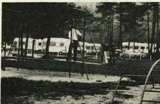
Lesce — V kampu Šobec se je že pričela turistična sezona. V prvih turističnih dneh so zabeležili večji obisk kot lani. Kamp Šobec je pripravljen na obisk. — B. B.