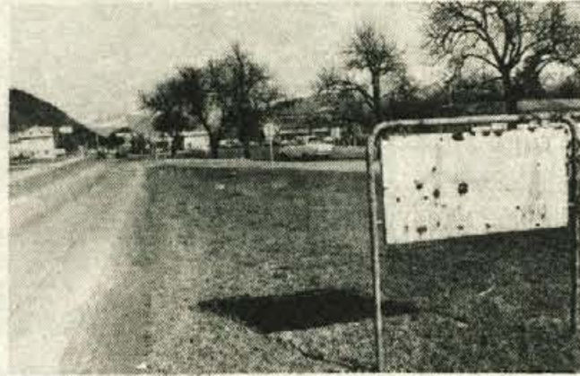
Kranj — Tako kot je dotrajala letališka steza na Brniku, tako je dotrajal tudi obvestilni prometni znak pred vhodom v Kranj z ljubljanske strani. Upajmo le, da bo ostalo nekaj denarja tudi za obnovo znaka, ki sicer letališču ni v ponos. — fr