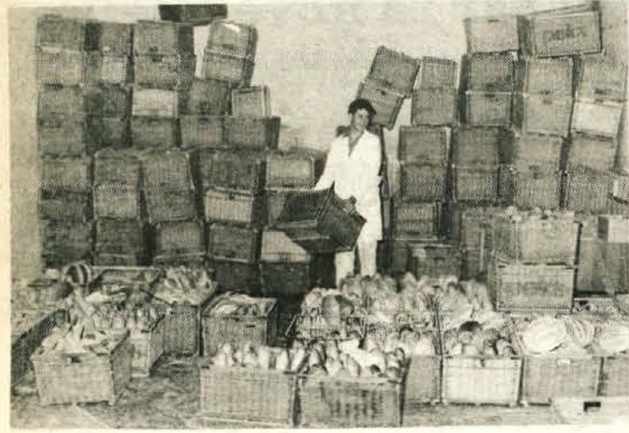
Eden najhujših problemov škofjeloške pekarnice je pomanjkanje skladiščnega prostora.