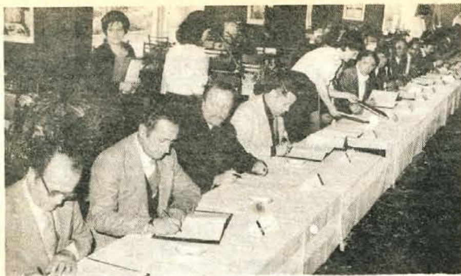
Bled — V hotelu Toplice so v petek, 19. maja, ob prisotnosti številnih predstavnikov proizvodnih in trgovskih delovnih organizacij z vse Slovenije in sosednjih republik ter ob navzočnosti predstavnikov skupščine občine in družbenopolitičnih organizacij Radovljice slovesno podpisali samoupravni sporazum o trajnem poslovnem sodelovanju na družbeno ekonomskih osnovah skupnega prihodka in skupnega dohodka med Murko in drugimi organizacijami.