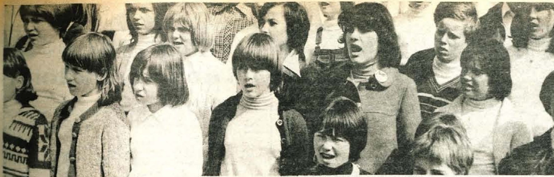
25. maj ni le praznik tovariša Tita. Je tudi praznik vseh mladih, ki z marljivim delom dokazujejo ljubezen do Tita in domovine, saj jo je, svobodno in enakopravno, v največji meri oblikoval prav on. Zato ne bomo dovolili, da bi bila kdaj drugačna, ne bomo se oddaljili od poti, ki nam jo je zažrtal tovariš Tita.