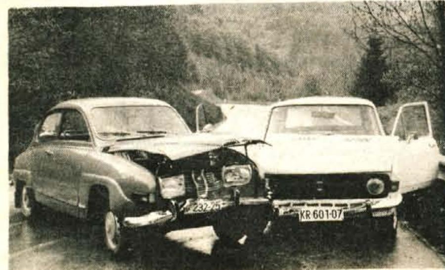
Malo nepazljivosti, malo preveč plina za ovinkasto in ozko poljansko cesto in nezgoda je tu. Tokrat se je na srečo končala le z zvito pločevino.