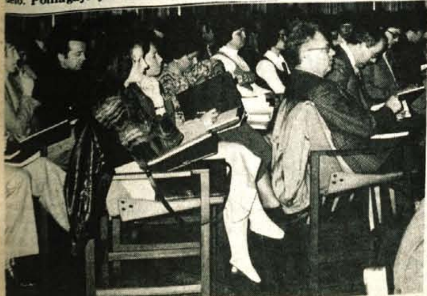
Bled - Kemična tovarna Podnart je za svoje poslovne sodelavce organizirala strokovno posvetovanje pod naslovom Poursinska zaščita 1978. Posvetovanje, ki je bilo 10. in 11. maja v prostorih Golf hotela na Bledu, se je udeležilo okoli 250 predstavnikov delovnih organizacij z vse Jugoslavije.

Če želite poceni opremiti vaš dom se oglasite v Lesnini na Primskovem.