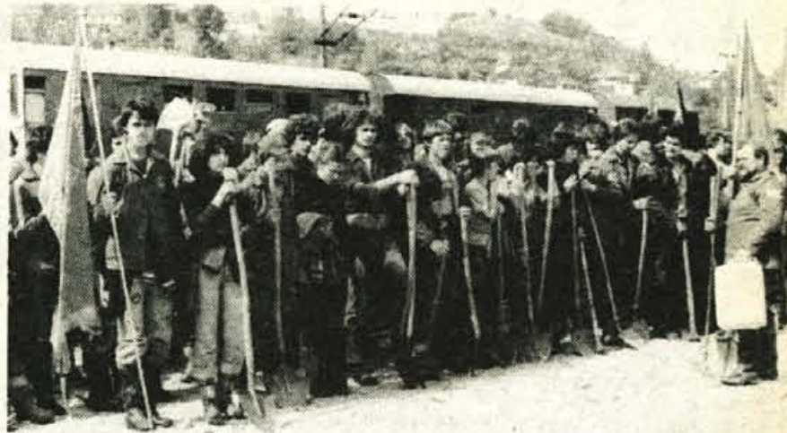
Zbor brigadirjev po končanem delu