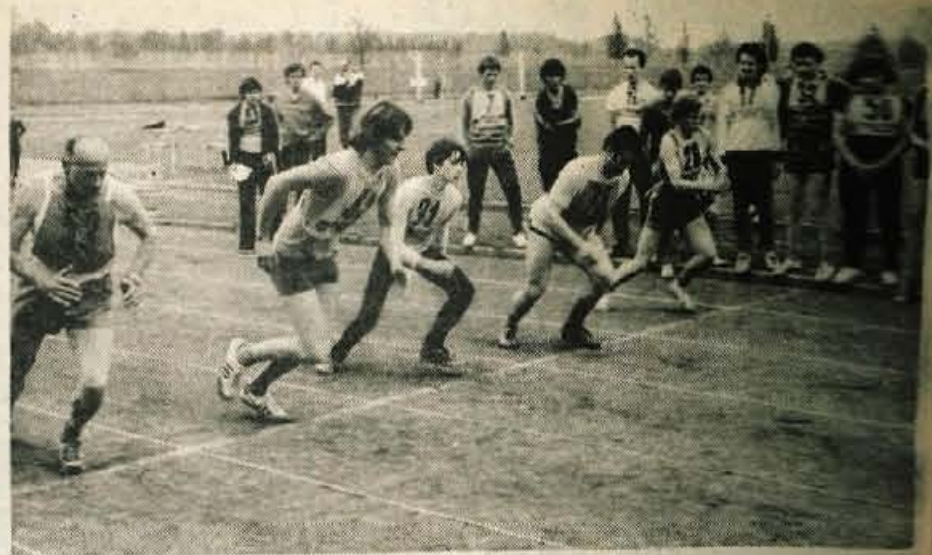
Preskus telesne vzdržljivosti - Partizanski mnogoboj, ki združuje hitri tek in tek vzdržljivosti, dviganje telesa, predklon in metanje bombe v cilj, je med najprimernejšimi oblikami preskusa telesne vzdržljivosti. Mnogoboj je bil tudi v nedeljo v Kranju, uspešno pa ga je pripravil TVD Partizan Kranj. Več sto ljudi se je zbralo na stadionu. Večina jih je pokazala dobro vzdržljivost. Prireditev kaže, da se bo treba zanjo še pogosteje odločiti. (jk) - Foto: F. Perdan

Cicibanom športna značka - TVD Partizan Kranj je v počastitev dneva mladosti v petek, 19. maja, v telovadnici osnovne šole Franceta Prešerna v Kranju pripravil tradicionalno telovadno akademijo, na kateri so se predstavili člani vseh starosti, učenci kranjskih šol in karateisti iz Naklega. Na akademiji so cicibanom podelili športne značke, prihodnje leto pa namera vajo upeljati tudi pionirske športne značke. Cicibanom so dosegli značke hodili na planinske izlete, kolesarili, kotalkali, smučali in metali žogo v koš. Kranjski Partizan se zaveda, da je treba že pri mladih vzgojiti navdušenje za stalno telesno vadbo. Žal za vse, mlade in starejše, v kranjskih telovadnicah ni prostora. Tudi po 100 ali celo več se jih naenkrat gnete v telovadnici. Čim prej bo treba razmišljati o telovadnicah, namenjenih zgolj za telesno vadbo. Le šolske telovadnice so kljub dobri volji vodstev šol preredko na voljo! (jk) - Foto: F. Perdan