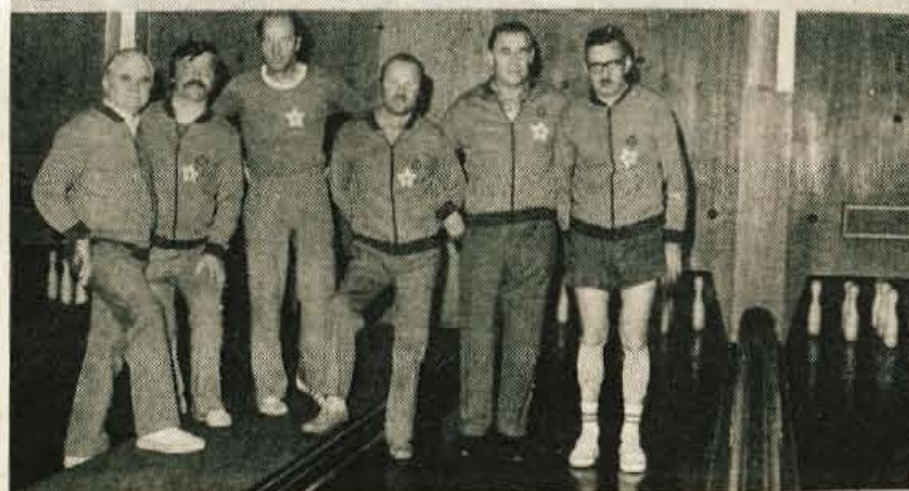
Invalidi kegljali - Društvo Borec iz Kranja je priredilo v soboto, 20. maja, na kranjskem kegljišču invalidsko kegljaško tekmovanje, katerega pokrovitelj je bila zavarovalna skupnost. Na fotografiji moštvo kranjskega Borca, društva za rekreacijo in šport invalidov. (jk) - Foto: F. Perdan