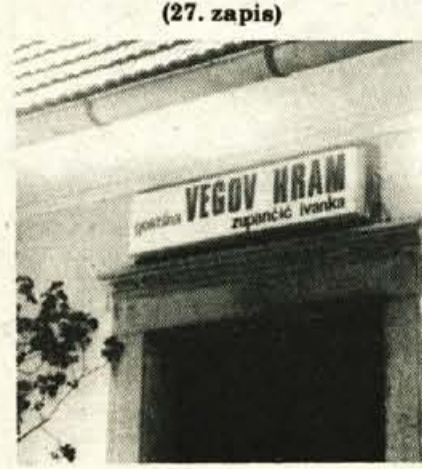
Vhod v Vegov hram v Dolskem pri Ljubljani