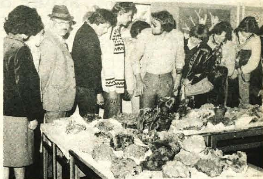
Uspela razstava mineralov - Skoraj 5000 ljudi je v nedeljo obiskalo VI. razstavo mineralov in fosilov v Trzinu, edinstveno tovrstno prireditev pri nas, ki ljudi seznanja z vsestransko uporabnostjo mineralov in fosilov, obenem pa omogoča tudi nakup obdelanih in neobdelanih mineralov. Posebnega pomena je bilo posvetovanje jugoslovanskih občin, kjer se nahajajo minerali, na katerem so soglašali s podpisom družbenega dogovora o trajnem financiranju prireditve. Dogovor bo uresničen že do prihodnje prireditve. Pobudnika za dogovor sta bila Društvo prijateljev mineralov Trzin in občinska skupščina Trzin, uresničila pa ga bo stalna konferenca mest Jugoslavije. (jk)

LJUBLJANA - Skupina slovenskih časnikarjev in zastopniki skupnosti za zaposlovanje SRS in sekretariata za informacije slovenskega izvršnega sveta se je po tridnevem obisku pri slovenski katoliški skupnosti v Zahodnem Berlinu v nedeljo vrnila v domovino. V Zahodnem Berlinu smo tri dni živeli z našimi rojaki in v soboto zvečer pripravili ustni časopis, ki se ga je udeležilo skoraj 300 naših rojakov z družinami. Na prireditvi je sodeloval tudi ansambel Toneta Zagarja. Slovenci, v Zahodnem Berlinu jih je okrog 1500, so nas izredno toplo sprejeli na svojih domovih in se zanimali za razmere v domovini in za možnosti vračanja. Povedati velja, da naši rojaki na vsakem koraku kažejo pripadnost k domovini in prav zaradi tega uživajo pri Nemcih večje spoštovanje. V treh dneh bivanja v Zahodnem Berlinu smo srečali tudi nekaj Gorenjcev. Več o Berlinu samem in življenju naših rojakov bomo še pisali! -jk