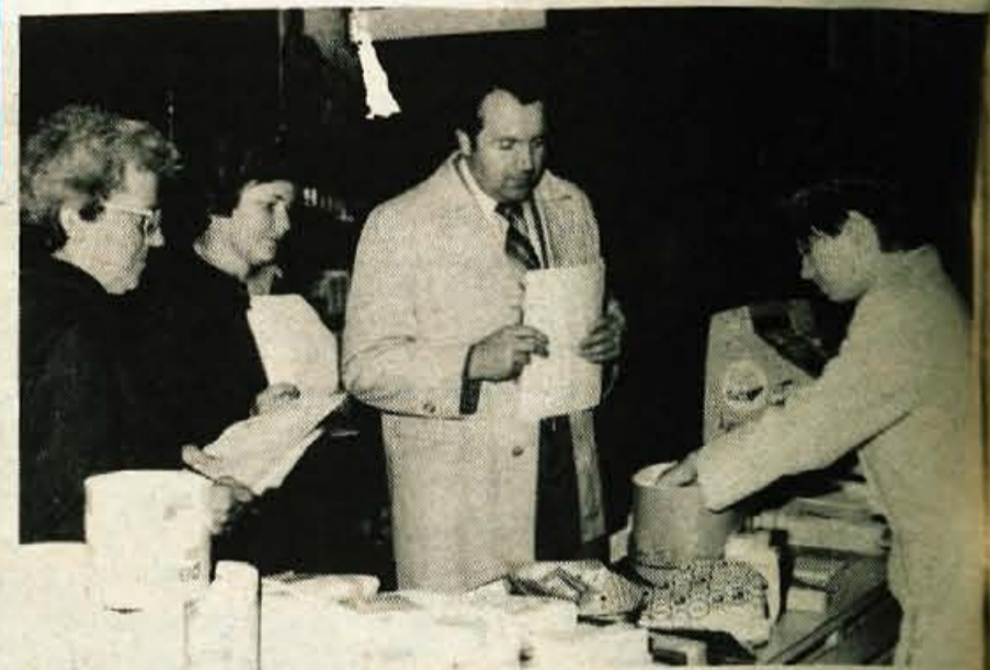
Strokovna komisija ocenjuje tehniko prodaje in kvaliteto trgovske usluge na petkovem tekmovanju učencev trgovske stroke iz Slovenije v Kranju.