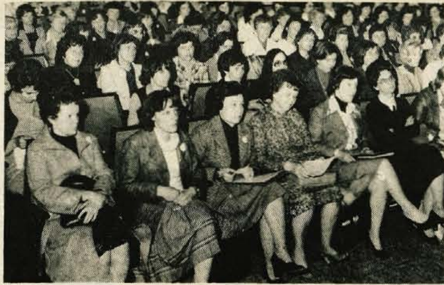
Kranj - V četrtek in petek je bil Kranj gostitelj okoli 600 udeležencev prvega strokovnega posveta slovenskih vzgojnovarstvenih zavodov. Program posveta je pripravila delovna skupina Skupnosti VVZ SRS, udeleženci pa so poslušali predavanja o idejnosti predšolske vzgoje, porazdeljeni v skupinah pa so si ogledali tudi varstvo v družinah v Kranju, nekaj vrtecev, posebno osnovno šolo ter se pogovorili nasploh o vrstah strokovnega dela s predšolskimi otroki v varstvu - L. M.

Včeraj se je v Ljubljani začel 10. jubilejni mladinski kulturni teden, ki poteka pod pokroviteljstvom izvršnega sveta skupščine SR Slovenije. Predvidenih je 31 priziditev, na katerih bo sodelovalo več kot 10.000 mladih iz vse Slovenije.