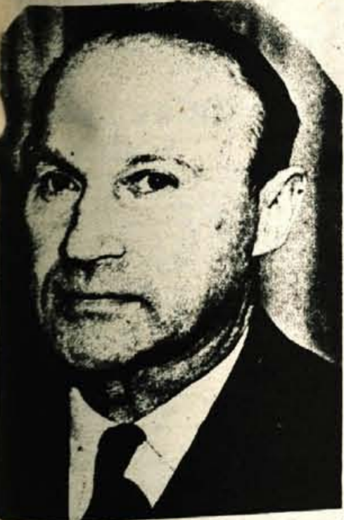
Čeloten načrt za umik ogroženih britanskih čet čez morje v Anglijo je nastal v glavi admirala sira Bertrama Ramsaya.

Jedki in žaljivi značaj takšnega mnenja je bil značilen za vse, ki so nasprotovali generalu Gortu. Temu so se pridružile še druge kritike, češ, general Gort kar naprej gleda prek rame proti morju. Ob vsem tem pa je bila pomembnejša Gortova osebnostna moč, saj je bil odgovoren za vse britanske ekspedicijske čete v Franciji, kar je za vse britanske ekspedicijske čete v Franciji, kar je za vse britanske ekspedicijske čete v Franciji, kar je za vse britanske ekspedicijske čete v Franciji.