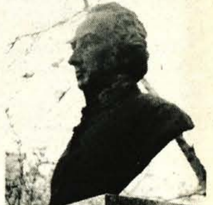
Spomenik Juriju Vegi v Ljubljani (pred Elektrotehniško fakulteto)