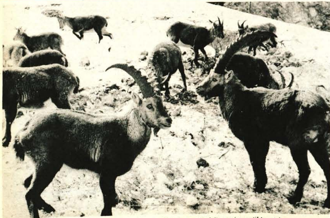
Ljubelj - Kozorogi so se umaknili visokemu snegu na Ljubelju; prav v dolino se je spustil trop teh čudovitih živali, ki se prav nič ne bojijo hrupnih avtomobilov in radovednih oči ...

Prijave z dokazili o izpolnjevanju pogojev sprejemamo 30 dni po objavi na naslov: Triglav konfekcija Kranj, Savska c. 34. Kandidati bodo o izidu izbire obveščeni najkasneje v 30 dneh po veljavnosti razpisa. Kandidati bodo vabljeni na informativen razgovor.