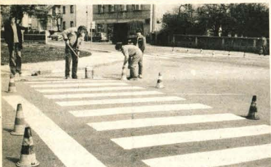
Prehodi za pešce — Delavci Cestnega podjetja so te dni začeli z deli na prehodih za pešce. Zimsko spanje »zebera« se je končalo. Za ponovno prebarvanje prehodov na gorenjskih cestah bodo porabili okoli pet ton barvila (-h); Foto — F. Perdan