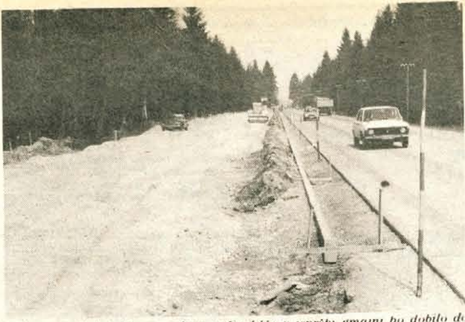
Jeprca — Dolga leta neurejeno počivališče v jeprski gmajni bo dobilo do začetka glavne turistične sezone povsem drugačno podobo.

»Kolektivni dopust imamo sredi julija in je pri nas nujen zaradi tehnologije proizvodnje. V tem času je namreč treba opraviti vse večje remonte, ki jih v enem ali dveh dnevih ob koncu tedna ni mogoče. Ker imamo dopust na višku sezone, smo se morali resno lotiti organizacije letovanja. Imamo sicer majhen počitniški dom na Pokljuki, 30 avtomobilskih prikolice na jadranski obali, vendar je to premalo. Zato smo morali izdelati posebna merila za letovanje v prikolicah in sicer imajo letos prednost tisti, ki še niso letovali med kolektivnim dopustom, če sta v Savi zaposlena oba zakonca in če imata več otrok. Vedno pa upoštevamo tudi zdravstvene in socialne razloge. 96 naših delavcev, ki delajo na izredno težkih delovnih mestih pa so letovali skoraj zastonj. Za vse druge delavce pa bomo organizirali letovanje prek turističnih agencij.