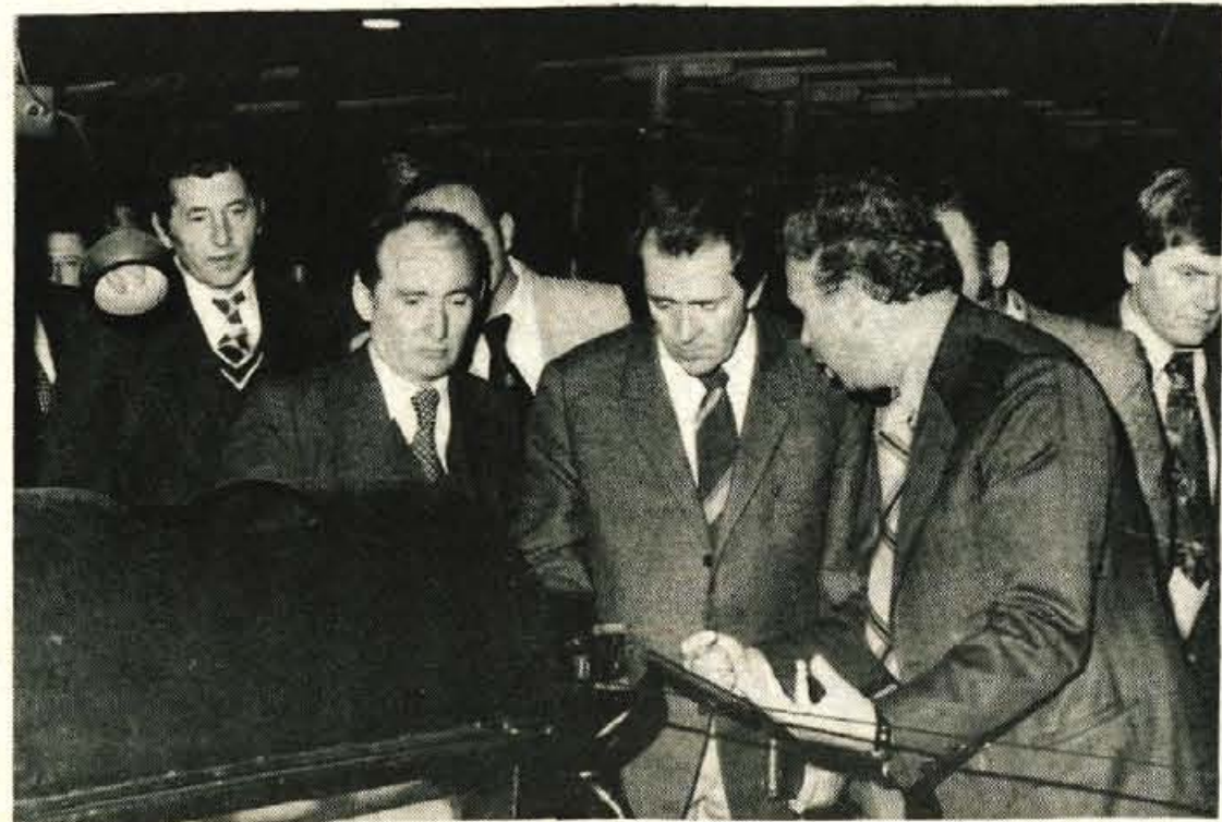
Predstavniki AMZJ v Savi - Včeraj so obiskali kranjsko Savo predstavniki jugoslovanske in republiških zvez avto-moto društev. Ogledali so si proizvodnjo, nato pa so se seznanili s prednostmi savskih avtoplaščev, ki jih bodo odslej lahko natančneje posredovali kupcem oziroma uporabnikom teh izdelkov po vsej Jugoslaviji.

Tudi o pezebi ni mogoče govoriti, saj se do torka zvečer temperatura še ni spustila pod kritičnih sedem stopinj pod ničlo, ko se je za brsteče sadje že treba bati. Vendar nevarnost še ni mimo. V gorah je veliko snega, kar utegne pogosteje povzročiti mrzle noči in jutra ter slano. To je takomenovana »radiacijska slana«. V mrzlih nočeh se težji hladni zrak z gora spusti v kotanje in povzroča slano. Nasad Resje je sicer na vzdignjenem zemljišču, vendar kljub temu ne kaže biti brez skrbi. Podvinski sadjarji so za to uredili posebne čistine in prehode med sadnim drevjem, kjer naj bi se ustalile plasti hladnega zraka, povzročitelja »radiacijske slane«. jk