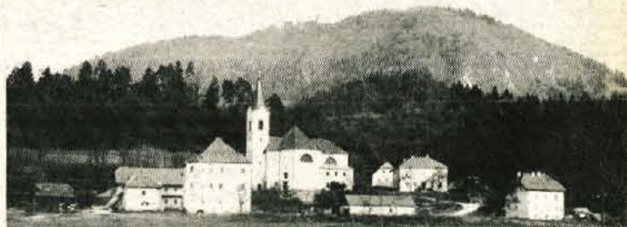
Sv. Helena ob Savi pri Dolskem, izhodišče za pot na Zagorico, rojstno vas Jurija Vega. — V ozadju 740 m visoka Murovica.