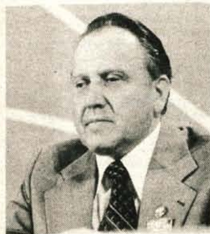
Predsednik CK ZKS France Popit je odprl kongres in spregovoril o nalogah komunistov v razvoju socialistične demokracije v Sloveniji...

nizaciji pa mora biti tudi povezan z interesom delavca in občana v krajevni skupnosti.