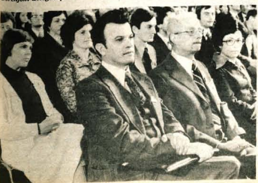
Delegati in gostje z Gorenjske med kongresom...