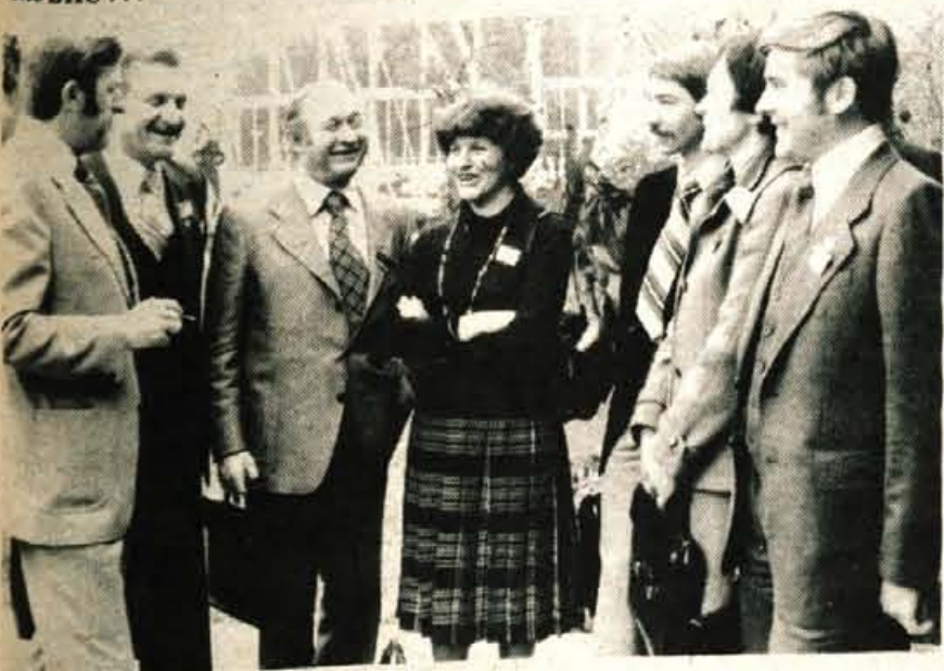
Gorenjski delegati pred začetkom kongresa...