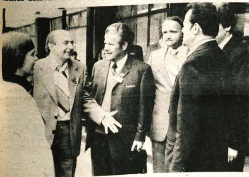
Iz vseh gorenjskih občin so v ponedeljek prihajali delegati občinskih konferenc ZKS...

Med letom 1965 in 1971 je bilo v Sloveniji veliko gospodarskih sporov in sicer med 70.000 in 86.000. Potem je bilo število gospodarskih sporov nekoliko nižje, zadovoljiv učinek pa je prišel šele z zakonom o zavarovanju plačil, saj je leta 1976 padlo število sporov na 15.326, kaže pa, da bo v letu 1977 še nižje, saj jih je bilo v prvem polletju le 3855.