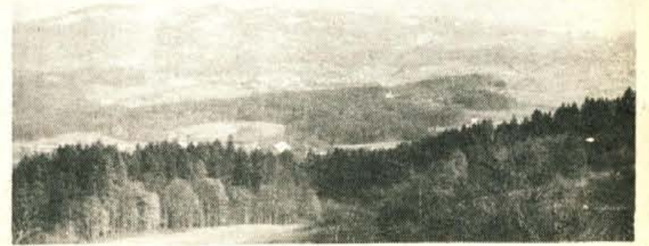
Moravška dolina - v ozadju na levi Limbarska gora - kot v varni dlan

Svedo o zlatih starih časih ni kaj modro govoriti, ta zlati čas je danes, ko ljudem ničesar ne manjka in ko žive tako dobro, kot še nikoli v zgodovini. Toda v mišlih imam stare zaposlitve, stare obrti, npr. suknarstvo, pletenje slamnatih kit, mlinarstvo, umno kmetovanje - danes je na Moravškem pravih kmetov komaj petina. No, o teh, posebno o pletenju slamnatih kit, bo stekla beseda kdaj drugič.