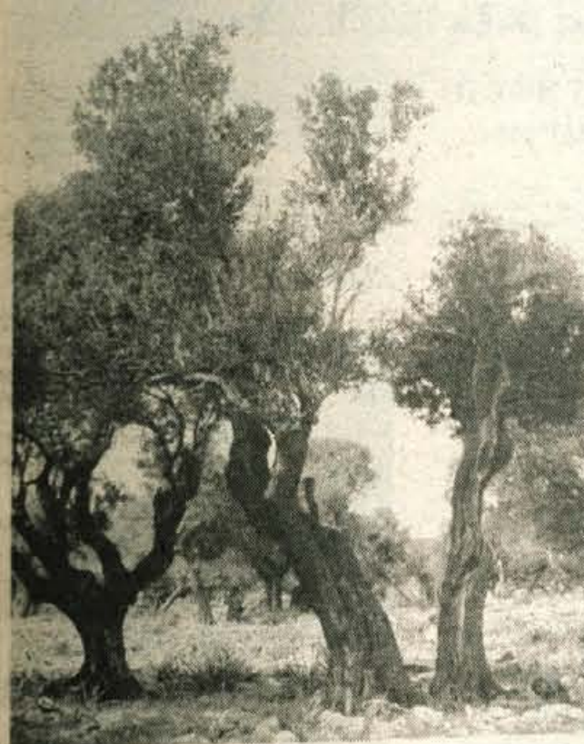
Stoletni oljni gaji na SICILIJI.

Kako je uglašen sekstet gorenjskih študentov (fanta sva bila v manjšini) prekrižaril našo sosedo od Benetk do Sicilije