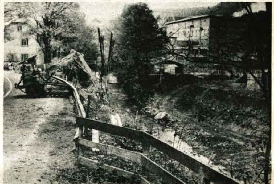
Tržičani so lani začeli graditi most čez Bistrico pri tovarni Peka, ki je del celovitega popravila ceste vpadnice od Peka do križišča pri Bombažni predilnici in tkalnici. Dograditev mostu in ceste je ena letošnjih najpomembnejših negospodarskih investicij v tržiški občini

Druga inačica predloga pa predvideva skupno prispevno stopnjo med majem in decembrom 30,01 odstotka, poprečna letna stopnja pa naj bi znašala 29,63 odstotka.