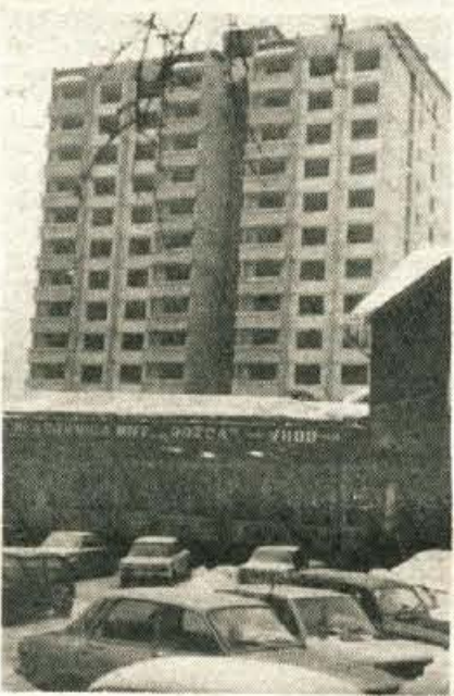
Jesenice - Kljub zimi so delavci SGP Gradbinec, temeljne organiza-cije Jesenice zgradili stolpnico S2 na Plavžu. V tej stolpnici bo 84 sta-novanj, dokončano pa jih bodo uredi-li spomladi. - B. B.

Odstraniti te pomanjkljivosti bi pomenilo presekat vozeli, v katerega se je zapletla stanovanjska gradnja v Tržiču. J. Košnjek