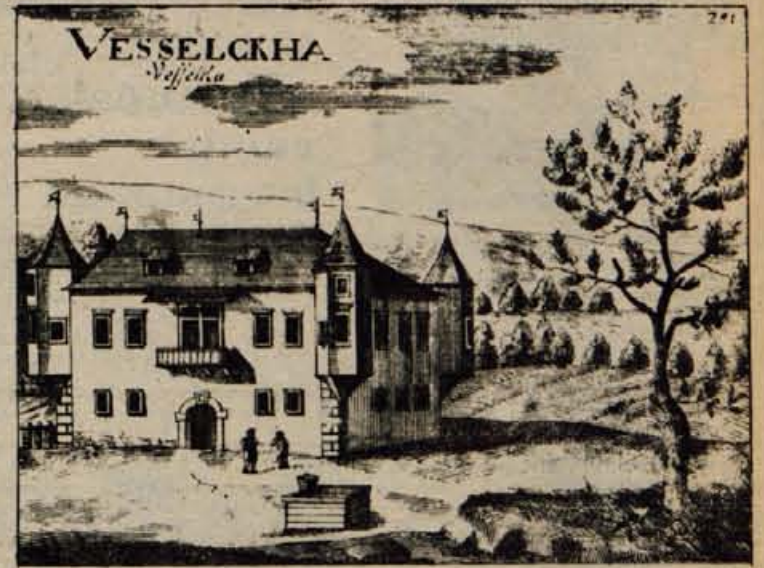
Gradič Veselka, kakršnega je videl še Valvasor