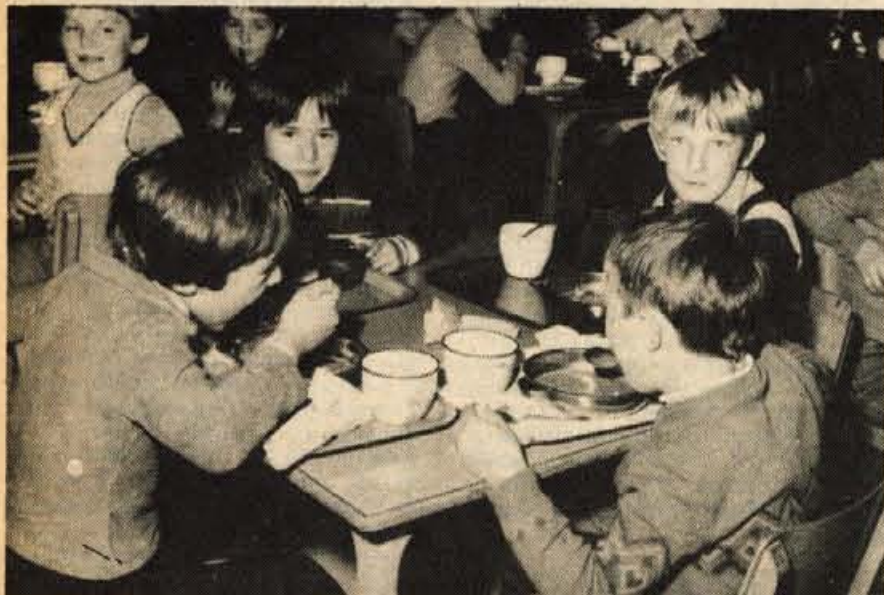
Najprej naj bi iz »skupne kuhinje« dobivali hrano šolarji, gojenci dijaških domov in oskrbovanci iz domov upokojencev ter najmlajši v vrtcih.

Termika sodeluje pri gradnji termoelektrarne v Nigeriji. Termičarji delajo izolacijo na kotlih in cevovodih TE. Glavni izvajalec del je italijanska firma Snapzoti iz Milana, izvajalec montažnih del je EMH iz Maribora, gradbeni material pa prispeva in opravlja nadzor firma AEG iz Dortmund. Celotna kvadratura izolacij, ki jih bo opravila Termika bo znašala skoraj 13.000 kvadratnih metrov.