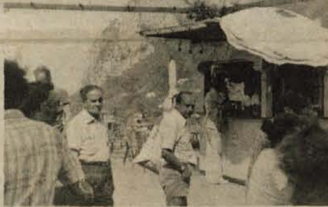
SICILIJA. Kamnita, tu pa tam kakšna skromna okrepčevalnica, kjer ti steže pomaranče zmiksajo v sok prijetnega okusa...

Zažene cev za namakanje po tleh, ugasne črpalko in - oddide.