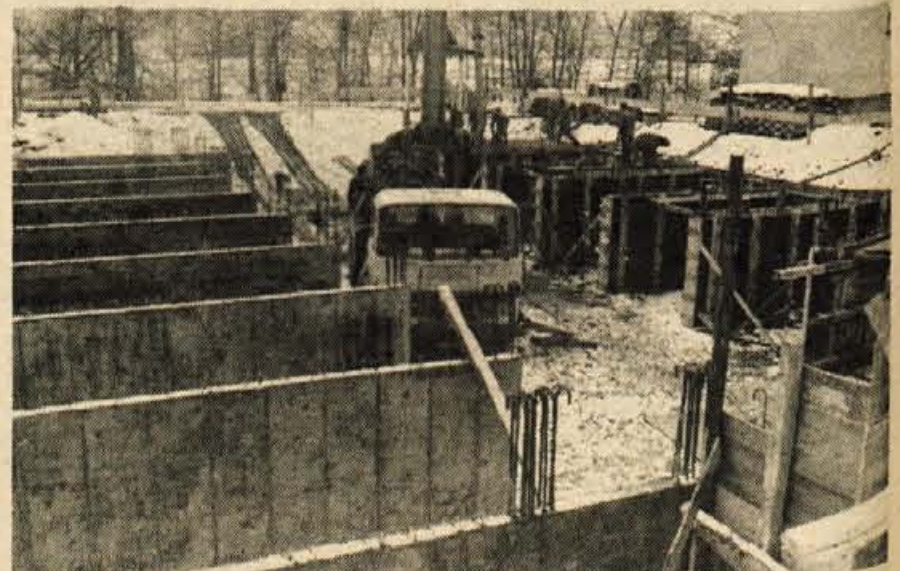
Nova garažna hiša - Medvode - Delavci SGP Tehnik iz Škofje Loke gradijo v novem stanovanjskem naselju v Medvodah garažno hišo Triplex z 48 prostori. Garaže veljajo od 60 do 65 tisoč dinarjev, odvisno od etaže, nared pa bodo v mesecu juniju letos. - fr