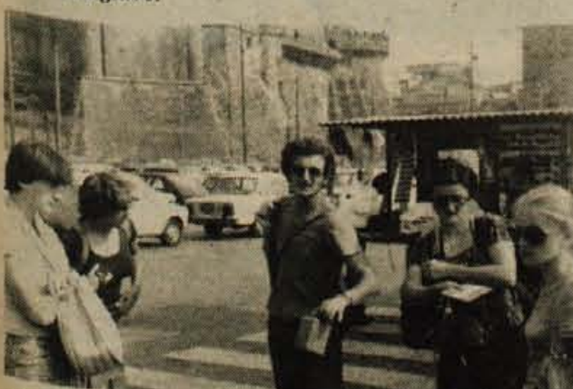
NEAPELJ - med odločanjem - ITI ALI NE ITI NAPREJ! Pasja vročina, prešvicane kavbojke, utrujenost - Capri pa je že daleč za nami...

»Sendvič!« sem zloben. Začnem podzavestno brskati po torbi, ona pa postane nesramna. Zmrdne se in odkima z glavo.