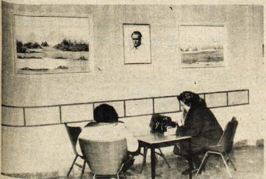
Radovljica - Med delovnimi organizacijami, ki prizadevno skrbijo za kulturo, je tudi poslovalnica Ljubljanske banke v Radovljici, kjer pripravljajo občasne razstave.