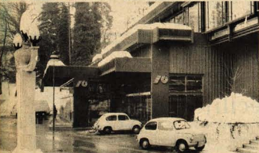
Bled – V petek, 17. februarja, so v spodnjih prostorih Park hotela na Bledu slovesno odprli nove prostore Ljubljanske banke. Nova poslovalnica je za turistični Bled izredna pridobitev, delavci pa bodo zdaj lahko delali pod ugodnejšimi pogoji. Ljubljanska banka na Bledu nudi usluge občanom in delovnim ljudem ter turistom in agencijam, število tistih, ki obiskujejo banko pa se neprestano povečuje. Zdaj imajo več kot 5000 hranilnih vlog in okoli 2500 žiro računov, tekočih računov in deviznih računov. Nove poslovne prostore je omogočil kolektiv Viatorja, poslovalnico pa je oblikoval inž. arhitekt Milošević s sodelavci službe banke za gradnjo in opremljanje poslovnih enot.