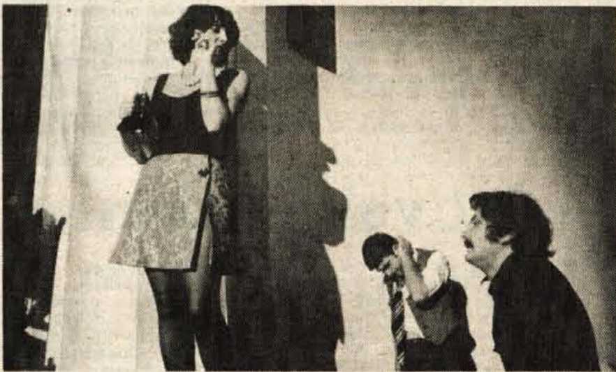
Prizor iz Generacij Dušana Jovanovića , ki jih je na TSD 78 uspešno predstavilo Narodno pozorišče Bosanske krajine iz Banja Luke.

vostmi (predstave izven hiše organizatorja Tedna, številne spremljevalne prireditve) popestril gledališko življenje, tako je Kranj deset dni dobesedno živel z gledališčem. Letos je prireditelj tudi bistveno vplival na izbor repertoarja TSD. Načelno stališče preteklih Tednov (vsako gledališče lahko sodeluje z eno predstavo, ki jo sam izbere) je bilo letos bistveno korigirano, saj so gledališča prijavljala po več predstav, organizator oziroma umetniško vodstvo kranjskega gledališča pa je v soglasju z gledališči odločilo o predstavi na Tednu. Letošnjo prakso, ki se je obrestovala, velja s