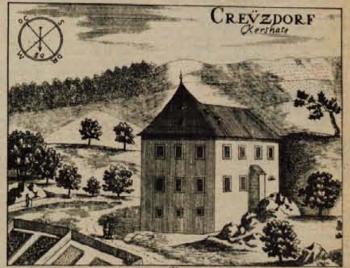
Gradič Križate v Valvasorjevem času