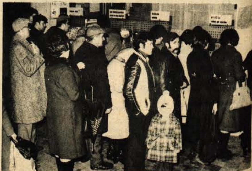
Seveda bi bilo idealno, da bi se v dneh, ko gripozna obolenja kar preskakujejo med ljudmi, lahko izognili večjim gnečam: čakanje med kašljajočimi in prehladenimi ljudmi pa bi lahko morda prihranilo vsaj otrokom.