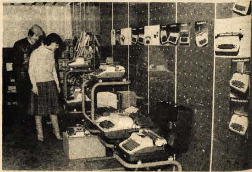
Kranj – Razstava pisarniške opreme in materialov je v Mladinski knjigi na Majstrovem trgu v Kranju postala že prav tradicija. Tudi letos ni izostala. Od včeraj so v prodajalni na ogled vseh vrst pisalnih stroji OLYMPIA, elektronski kalkulatorji OLYMPIA, DIGITRON in TRS, fotokopirni aparati in razmnoževalni stroji. Tako bodo podjetja in ustanove, ki se prav zdajle po zaključnih računih odločajo za te vrste nakupov, z lahkoto izbirala. Razstavitelji bodo do konca februarja.

V četrtek, 23. februarja, ob 19. uri bo v ciklusu četrtkovih večerov poezije na sporedu komentirani večer zvočne poezije. V baročni dvorani kranjske mestne hiše bo v organizaciji Kluba kulturnih delavcev večer vodil prof. France Pibernik. J. P.