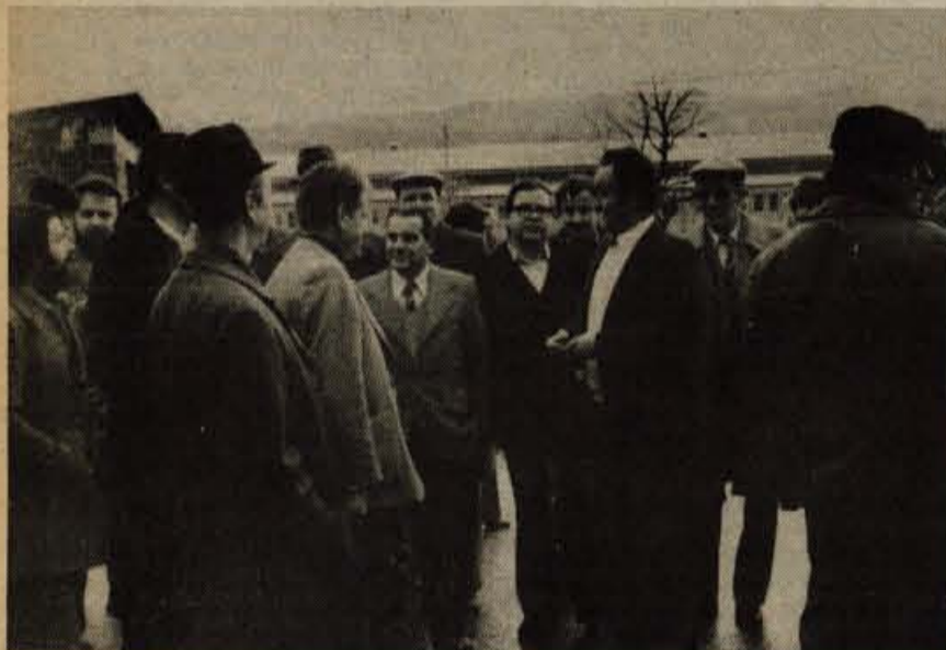
Obiskali smo tudi tovarno Mlinotest v Ajdovščini.