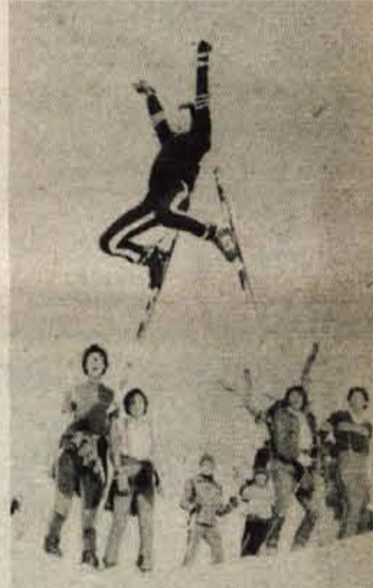
Poleg takšnih skokov tudi salte, za zdaj le enojne, za kranjske člane Hot-dog kluba niso skrivnost.

Takšni so njihovi načrti za prihodnost. In kakšno so njihove težave? Imajo jih mnogo, vendar jih s svojo mladostno vztrajnostjo uspešno premagujejo.