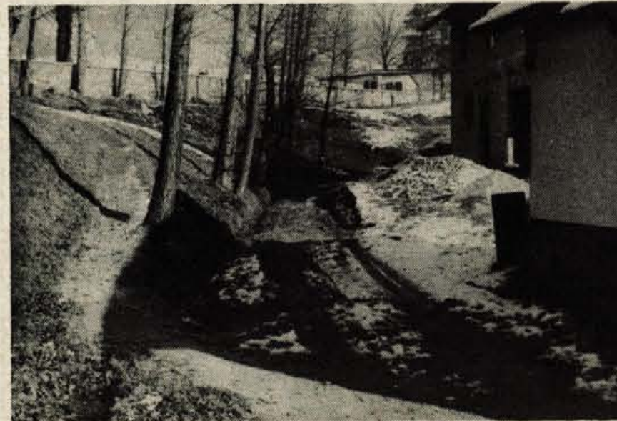
Dostop do žirovskega pokopališča na Dobračevi je vsa leta deležen mnogih kritik. Pot do njega je slaba. Z denarjem iz samopriskpevka pa Žirovci nameravajo urediti boljši dostop, poleg tega pa ob njem tudi večje parkirišče. Zemljišče je krajevna skupnost Žiri že odkupila, projekt pa je v izdelavi. Vrednost del je ocenjena na 1 milijon din. Z denarjem iz samopriskpevka pa na pokopališču na Dobračevi nameravajo zgraditi tudi mrliške vežice.