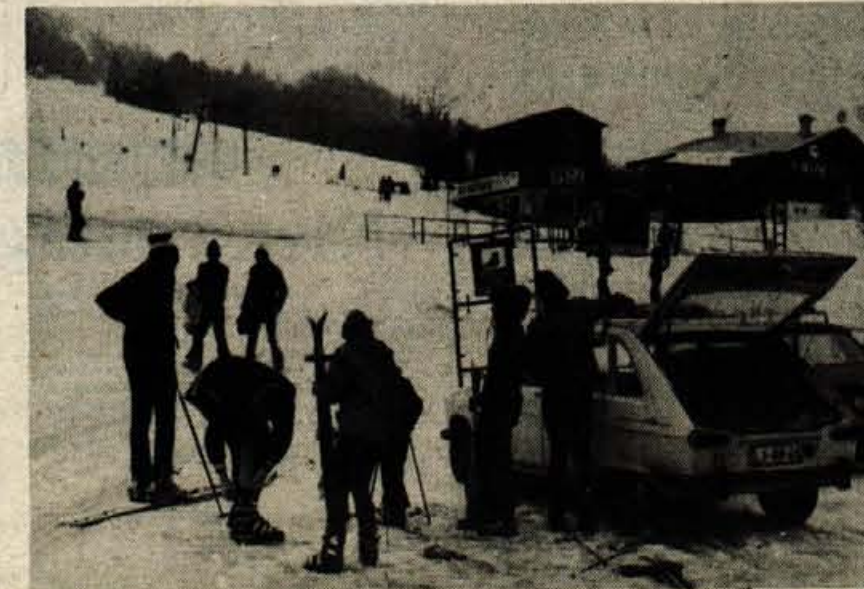
Kranjska gora - Odjuga ni motila najbolj vztrajnih in navdušenih smučarjev z Gorenjske in iz Ljubljane, ki so se v soboto, 9. decembra, popejali s kranjskogorskimi vlečnicami in odpravili počasni, težki sneg.