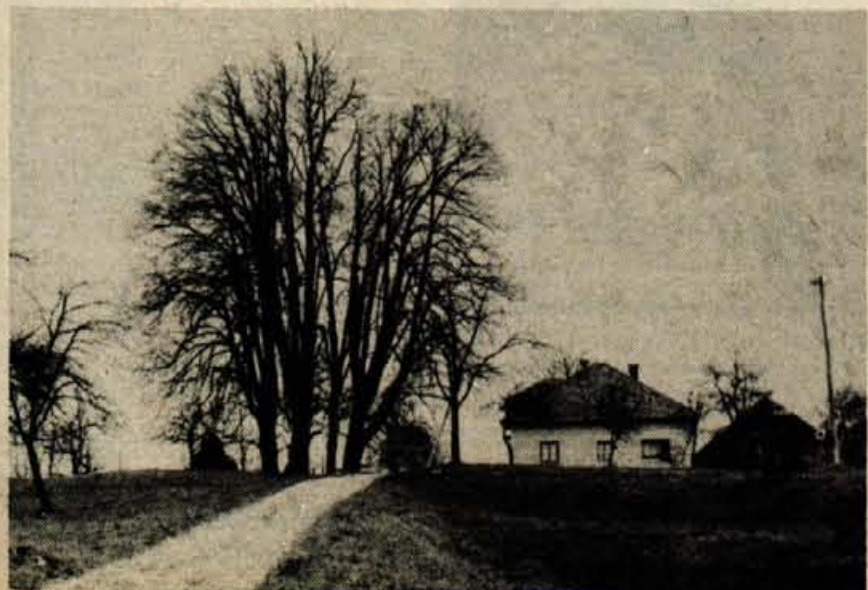
Tak pa je pogled na Zalog danes: stare lipe še stoji, namesto požganega in porušenega gradu stoji lepo stanovanjsko poslopje.