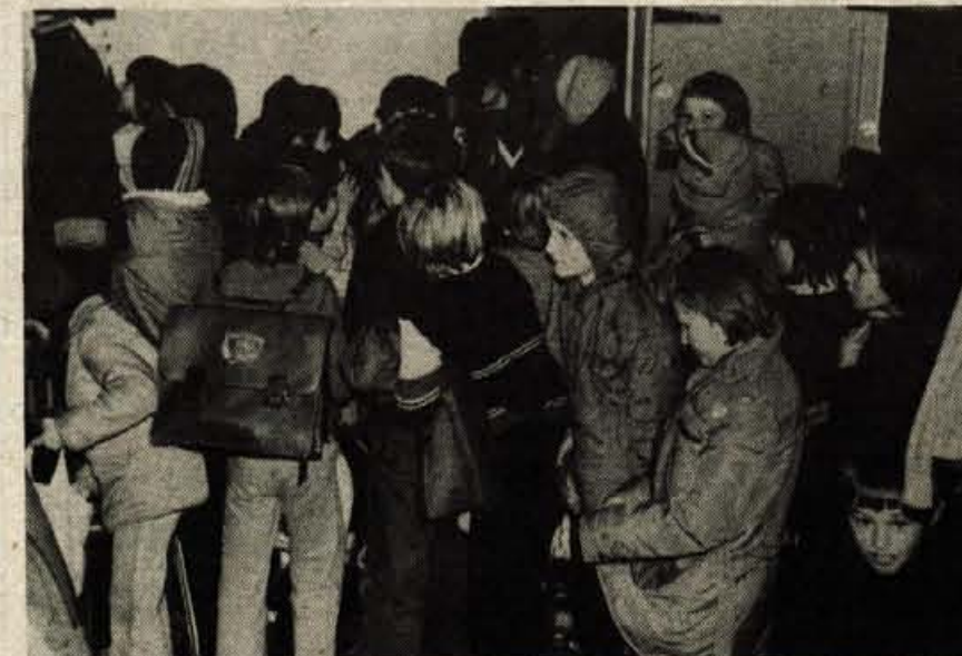
Nepopisna gneča je v garderobi žirovske šole, kadar se končuje pouk. Takrat med dvanajsto in trinajsto uro, ko v šram učenostie že prihajajo novi učenci, je treba čimprej dobiti svoj plašč, čevlje, kajti do doma ima še marsikdo daleč. Tudi izhod in vhod v prostore žirovske šole je mnogo preozek. Dosedanji preskusi so pokazali, da bi se ob morebitni nesreči učenci težko prebili skozi ozko grlo. Vsaokrat bi lahko prišlo do nesreče. Dela pri urejanju garderobe ter razširitvi vhoda v šolo in izhoda iz nje bodo predvidoma veljala 2 milijona din.