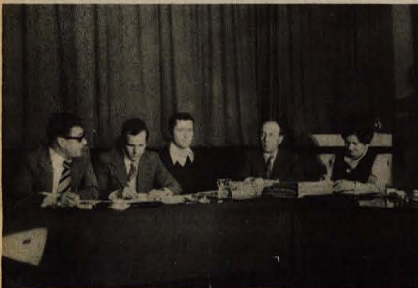
Predstavniki skupščine občine Ajdovščina so novinarje izčrpno seznanili z obrambnimi pripravami v ajdovski občini.