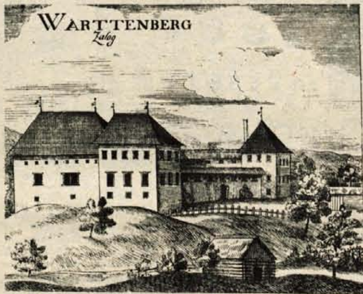
Grad Zalog (Wartenberg) v Valvasorjevem času l. 1689

Kot estetu pa mi je seveda žal gradu Zaloga. Saj je bil v 18. stoletju