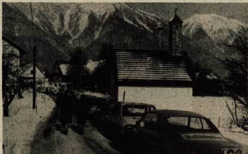
Koroški Slovenci so v nedeljo po treh smereh z vidno označenimi osebnimi avtomobili krenili na skrajno mejo dvojezičnega ozemlja, na Brdo pri Šmohorju, kjer vlada sploh ne priznava obstoja Slovencev kljub še živi slovenski govornici in kulturi

GLASILO SOCIALISTICNE ZVEZE DELOVNEGA LJUDSTVA ZA GORENJSKO