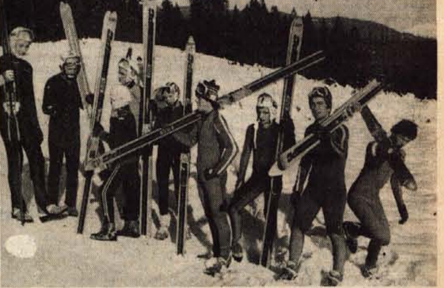
To nedeljo so svojo prvo uradno preskušnjo imeli v Planici smučarski skakalci. Čeprav so prej trenirali - člani in mladinci - na 55-metrski skakalnici na Pokljuki, je mladincem 90-metrka delala precej preglavic. Prehod na večjo skakalnico je bil zanje le prehitri!

V četrtek, 8. decembra, bo ekipa treh članov nastopila na prvi mednarodni tekmi v Bad Ischlu (Avstrija). Na Pokljuki pa bo v nedeljo spominsko tekmovanje po poteh borcev Prešernove brigade. Na 55-metrski skakalnici bodo nastopili člani in mladinci. Rezultati - člani: 1. Zupan (JLA) 212,2 (79,5 - 88), 2. Norčič (Triglav) 206,8 (80,5 - 81), 3. Kajzer 196,4 (76,5 - 81,5), 4. Bogataj 185,7 (76 - 79), 5. Bantan 182,9 (76 - 81,5), 6. Anžel (vsi Ilirija) 182,2 (72,5 - 80), 7. Cimžar (Triglav) 175,6 (71,5 - 79,5), 8. Bertič (Ilirija) 174,2 (73 - 77), 9. Mlakar (Logatec) 173,6 (75 - 88,5), 10. Velikonja (Predoslje) 171,6 (70,5 - 78), 11. Kežar (Triglav) 157,6 (71 - 70,5), 12. Tomažič (Ilirija) 154,5 (76 - 77,5), 13. Finžgar (Triglav) 154,1 (67 - 71,5); mladinci: 1. Bajc (Ilirija) 190,0 (78 - 81,5), 2. Jemc (Jesenice) 177,8 (76 - 78), 3. Bizjak (Triglav) 163,3 (71 - 73), 4. Komel 158,7 (76,5 - 68,5), 5. Mihev (oba Ilirija) 153,5 (68,5 - 71). J. Javornik