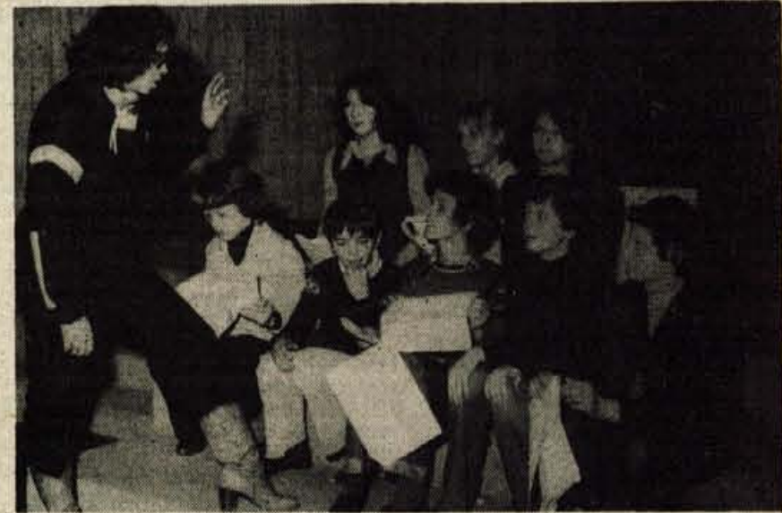
Poslušna mlada skupinica Linhartovega odra mladih z mentorico.

Linhartov oder mladih v Radovljici uspešno nastopa na pomembnih prireditvah v občini in zunaj nje - Kvalitetna rast mladih recitatorjev