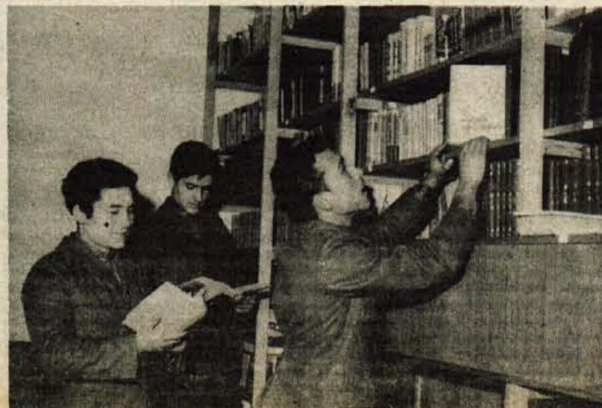
Bogato založena knjižnica v kranjskem domu JLA.