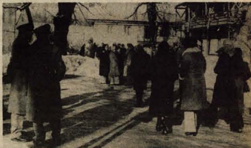
Vsako najmanjšo manifestacijo koroških Slovencev spremlja na stoti žandarjev in agentov. S tem hočejo oblasti ustrahovati pripadnike manjšin obenem pa povedati, da je vsako dejanje v prid pravicam skupnosti krinjalno in nevarno dejanje.

Trasa avto ceste je po idejni zasnovi, o kateri so že razpravljali v krajevni skupnosti Podmežakla, že začrtana. Predvidena lokacija karavanškega predora je oddaljena od spomenika na Belem polju pri Hrušici nekaj sto metrov proti Mojstrani. Od tod naj bi tekla cesta z enim voznim pasom — glede na pričakovani promet nista predvidena dva vozna pasova v standardu avto ceste — na desnem bregu Save, pod Belim poljem na Hrušici in po severnem pobočju Mežakle. Avto cesta nato prečka železniško progo Jesenice — Nova Gorica z nadvozom približno pri prvih hišah na Lipcah pri Blejski