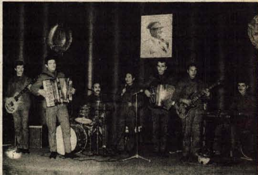
Ansambel SMB 220 je poznan po vsej Gorenjski. V njem pa igrajo fantje iz vseh predelov Jugoslavije.

Bodite praktični - v mesecu decembru pomeni vaš nakup tudi DARILLO ljubljene osebi.