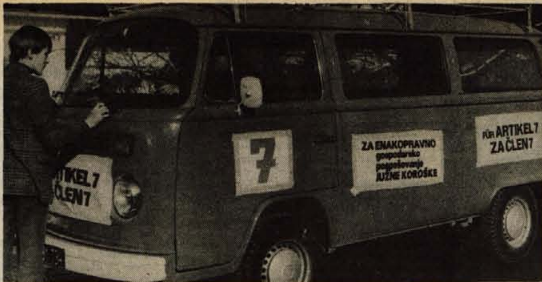
Koroški Slovenci so v nedeljo organizirali pohod po dvojezičnem ozemlju, ki se je končal z zborovanjem na Brdu pri Šmohorju. Sem je prispelo več kot 100 vozil in avtobusov, preplepenih z napisnimi zahtevami Slovencev za enakopraven položaj