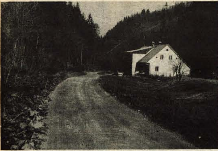
Čprav bodo imeli prebivalci Barbare, Andreja in Ožbolta še dva, tri in tudi več kilometrov makadama do doma, bodo prispevali za asfaltiranje ceste po dolini Hrastnice.