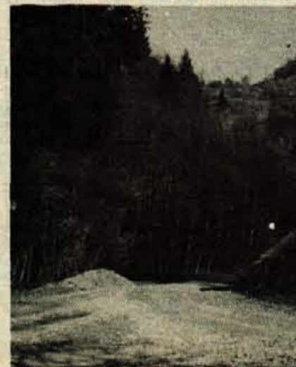
Če bo teklo vse po načrtih, bo cesta skozi Hrastnico že spomladi dobila asfaltno prevleko.

Čprav Selo nad Polhovim Gradcem spada pod drugo krajevno skup-