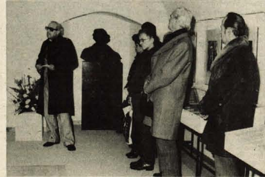
Kranj - V prostorih Prešernove hiše v Kranju so v petek, 2. decembra, odprli spominsko sobo pesnika Simona Jenka. Ob tej priložnosti so odprli tudi razstavo z naslovom Jenko in Vajevci. Razstava bo odprta do 18. decembra. - A. Ž.

V Kranjski gori pa so svoja dela razstavili tudi udeleženci letošnje planinske slikarske kolonije. Večinoma člani jeseniške likovne sekcije so razstavili motive Podkorena v hotelu Prisank v Kranjski gori. D.S.