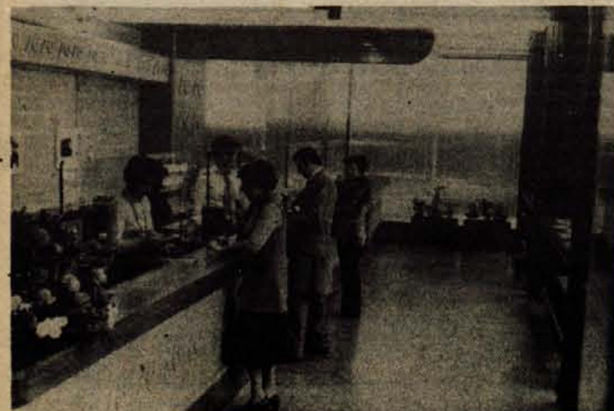
Pretekli teden je Ljubljanska banka odprla na Planini novo poslovalnico. Odprta je ob ponedeljkih in torekih od 12. do 18. ure, ob sredah od 6.30 do 17. ure, ob četrkih in petkih pa od 6.30 do 12. ure. Banka je v Vrečkovi ulici (poleg doma upokojencev).

In katere pošte? Prednjači seveda Pošta Kranj s 148 novimi naročniki, takoj za njo je Škofja Loka s 91, Bled s 77, Trbič s 51, Radovljica s 33 in Jesenice s 30 novimi naročniki.