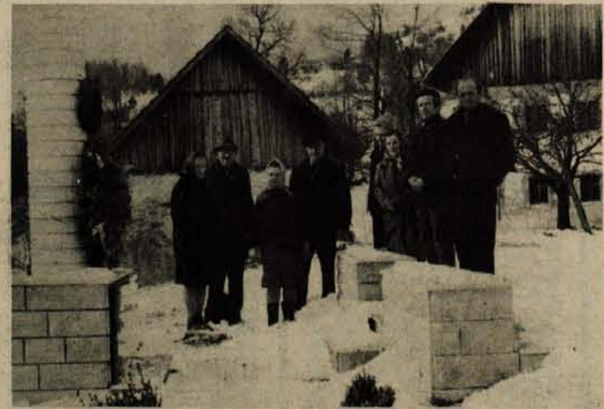
V soboto, 3. decembra, prav na dan, ko je pred leti v Jaznah pod Bevkovim vrhom nad Sovodnjem v hudem boju z Nemci padlo 37 borcev Gradnikove brigade, je njihovo spominsko obeležje pri Mrzlikarjevi domačiji obiskalo nekaj borcev Gradnikove brigade iz Kranja in Škofje Loke, ki so se skupaj z domačimi poklonili padlim junakom. Sedemintrideset svečk je zagorelo ob vznožju spomenika, ki je bil postavljen lansko jesen s prispevki gorenjskih in primorskih podjetij. To je dan, ki se ga z grozo v srcu spominjajo vsi Mrzlikarjevi; njihova domačija, ki je vso vojno odprti rok sprejemala v zavetje partizane, je bila tega dne požgana do tal.

Pri predsedstvu občinske konference socialistične zveze se bo v četrtek, 8. decembra, sestal koordinacijski odbor za sodelovanje in odnose z zamejskimi Slovenci, zdomci in drugimi jugoslovanskimi narodi. Med drugim se bodo pogovorili o programu za prihodnje obdobje. A. Ž.