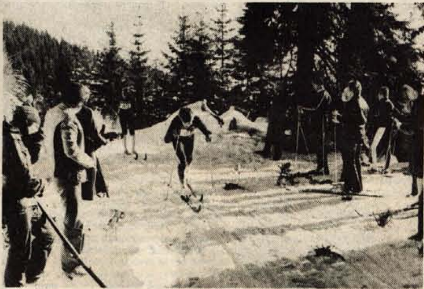
Na Pokljuki so uradno odprli sezono 1977/78 tudi smučarski tekači. Na prvi pregledni tekmi je v vseh kategorijah nastopilo 140 tekačev iz vseh slovenskih smučarskih klubov.

POKLJUKA - Poključke smučine so v nedeljo došle uradni smučarski tekaški krst za sezono 1977/78. V njenih smučinah je namreč na prvi tekmi nastopilo 140 tekmovalec in tekmovalec iz vseh naših tekaških kolektivov. Nastopili so tekmovalec vseh kategorij, med katerimi so bili tudi državni reprezentantje. Manjkal je le vojak Bojan Cvajnar zaradi poškodbe.