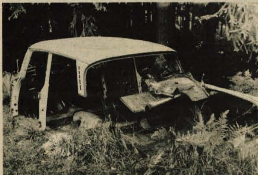
Senčur – Kam z odsluženim avtomobilom? V gmajno, kjer naj razpada kakor hoče...

Ljudje civilizacije smo, a večkrat strahotno necivilizirani; industrializacija nas žene naprej, a se večkrat strahoma sprašujemo, če nas nemara ne bo zdaj zdej s svojimi kreplji ukanila. Skratka, ves napredek kaže po drugi strani ogromno problemov, ki jim nismo kos, boleče se nam zažira v družbeno kožo, nam jemlje sapo, zdravo okolje, v katerega smo vraščeni in od katerega živimo. Žrtve samih sebe bomo postali, če ne bomo drugače mislili in ukrepali, če nam bo še vedno vseeno, če bistra studenčnica odplakne vso našo nesnago, če se širi smrad in dim in odlagajo odpadki v naše gozdove.