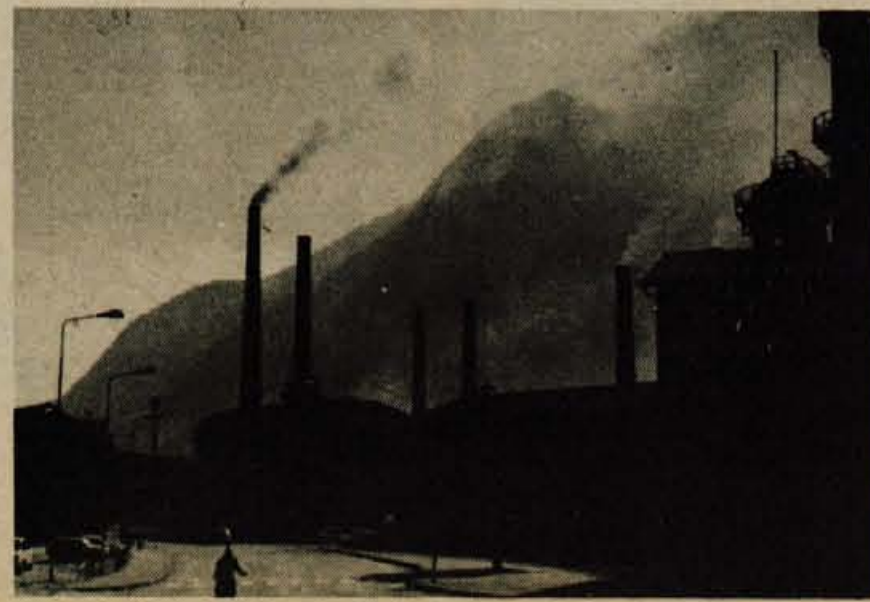
JESENIŠKE VERTIKALE — Foto: J. Zaplotnik

Sredstva za naložbe bodo zaradi pozno sprejetega programa in začas- nega financiranja v kulturni skup- nosti Jesenice porabili do konca leta za knjižnico v Kranjski gori, za opremo ahrivskega skladišča in opremo klubskega prostora. D. S.