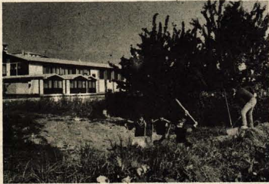
Po velikem prizadevanju krajevnih skupnosti in vodstva šole so ob šoli Simon Jenko začeli urejati športno in otroško igrišče ter okolico. Pri urejanju okolice pomagajo tudi učenci.

Na podlagi razprave so na seji sprejeli več sklepov. Poudarili so, da morajo delegacije v TOZD in OZD postati resnični nosilci vsega dogovarjanja in sporazumevanja. Zato morajo delegacije in konference delegacij stalno sodelovati z družbenopolitičnimi organizacijami v TOZD in samoupravnimi organi poleg tega pa tudi s krajevno skup-