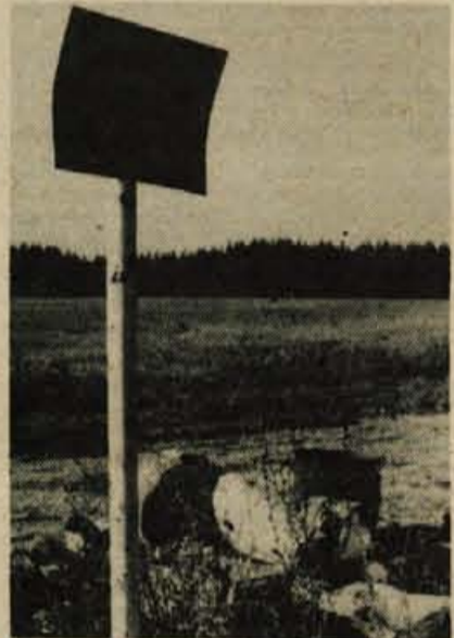
Senčur – V posmeh...

In, ne moreš si kaj, da se pač ne bi oglel za vse, kar lahko koristi, kar vzgaja, ne moreš si kaj, da ne bi med drugim priporočil, da bi bilo umestno in prav, ko bi že na papirčke bonbonov napisali odvrzi me v koš za odpadke ali če hočete, privlačneje