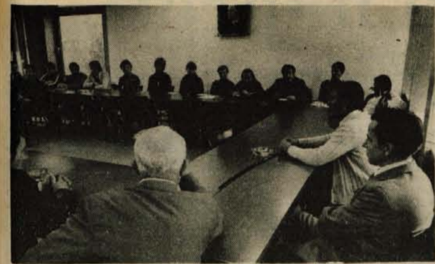
Pretekli teden je bilo v tovarni Elan v Begunjah živahno. Ta delovni kolektiv je največji proizvajalec smučarske opreme v Jugoslaviji. Pred novo smučarsko sezono so na tovariško srečanje povabili naše smučarske tekače in jim podarili nove smuči.