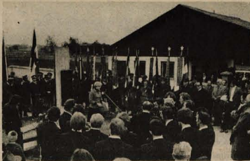
Ob svečanem odkritju spomenika na Spodnjem Brniku so v kulturnem programu nastopili moški pevski zbor Davorina Jenka iz Cerklje in člani domačega KUD Krvavec.

Delovne organizacije za predelavo plastičnih materialov se v svojem poslovanju srečujejo s številnimi težavami, ki izvirajo predvsem iz neusklajenosti dela med posameznimi delovnimi organizacijami. Zavoljo takšnih razmer so predstavniki 43 delovnih organizacij, ki se ukvarjajo s predelavo plastičnih mas, podpisali samoupravni sporazum o združitvi v poslovno skupnost Petroplast. V okviru skupnosti bodo usklajevali razvojne načrte, določali pogoje poslovanja, nastop na domačem trgu, prodajo v tujini itd. Ker potrošnja plastičnih mas iz leta v leto narašča, računajo, da bodo lahko proizvodnjo še razširili.