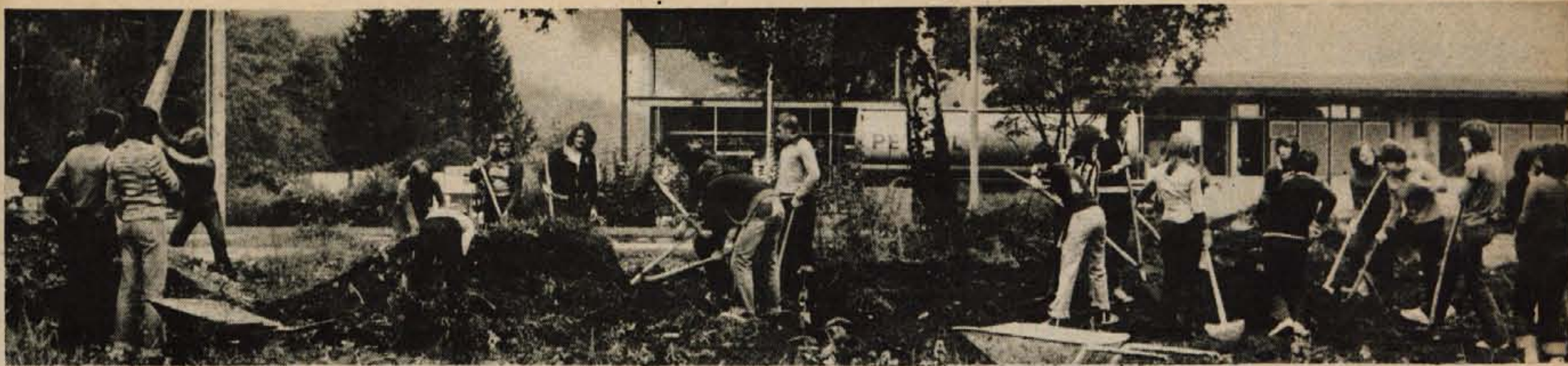
Gojenci dijaškega doma so v soboto skupaj z mladino Zlatega polja urejali okolico dijaškega doma.