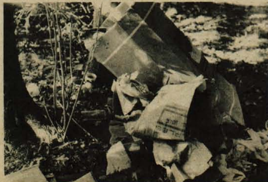
SENČUR – Takole ležijo kartonske škatle v šenčurski gmajni, ki jih lastnik M. K. iz Kranja pač noče odstraniti...