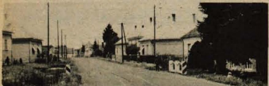
Slovenska vas (Rábatótfalu) - značilna panonska »dolga vasa«. Vse hiše ob cesti.

Morda pa vse to, kar imamo pri nas, niti ni tako potrebno za srečo? Značilna hišica nepremožnega vaščana je dobro vidna na sliki v 15. zapisu. Danes prikažem podoben sedanje vasi: hiše so zidane, a še vseeno so vedno le še hišice! Žal, tudi kake vrtno kulture nisem opazil, ne v Monoštru, ne v vaseh, skozi katere me je vodila pot. Tudi rož na oknih nisem videl... Kako lepo bi bilo, če bi mogli kdaj množično gostiti naše rojake od Rabe - navdušili bi jih za gorenjsko pokrajino, ki je od pomladi do jeseni en sam negovan cvetlični vrt. Pa tudi sicer bi bilo potrebnih več stikov s temi našimi najsevernejšimi rojaki. (Djekše in Kneža na koroški Svinški planini nista najsevernejši slovenski vasi! To bi bolj upravičeno rekli za vasi na levem bregu Rabe: za Ženavce, Svetico, Modince in Čretnik - ta leži najviše proti severu. Skoro natanko na 47. vzporedniku severne širine.)