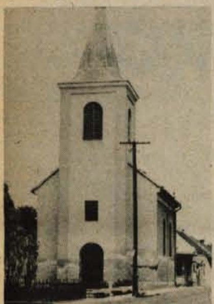
Cerkev v Slovenski vasi - tudi ob cesti. Prav tako ob cesti stoji tudi spomenik padlim vojakom iz prve svetovne vojne.

Teta Nanica - mož njen je že zdavnaj odšel v Ameriko in pozabil na svojo ženo - samuje že več desetletij. A vendar: le odkod neki dobiva ono stalno vedrino, ki ji iskri v očeh, ono otroško življenjsko radost, neverjetno ljubezen in zaupanje v ljudi?