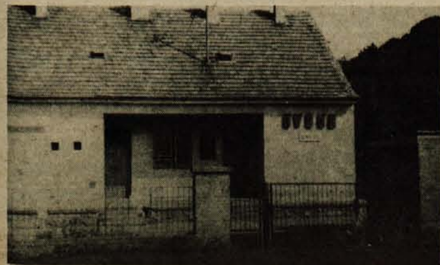
Dolnji Senik — slovenski napis Občinski vrtec (poleg madžarskega)