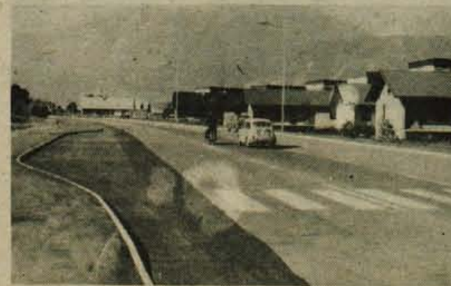
Na Gorenjski cesti, kjer sta priključka na Gradnikovo in Triglavsko cesto, so letos uredili križišče, javno razsvetljava in avtobusno postajališče