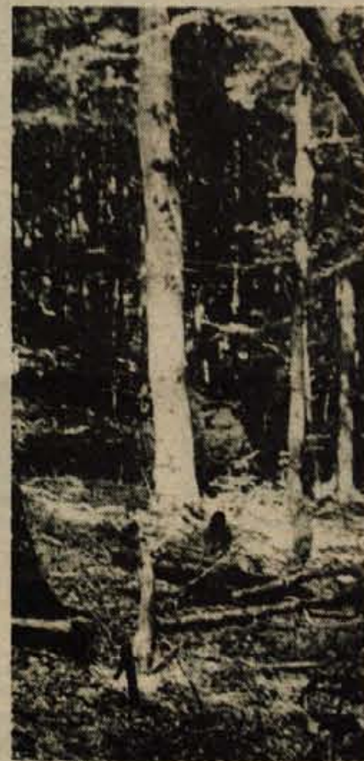
Pragozd v Raminem koritu

Počivala nisva kaj dosti, ker sva hotela čimprej iz tega korita ven in priti do Oštarij, še prej pa seveda do kakšne vode. Žeja je postajala že kar neznošna. V skalnatih vdolbinah ob poti sva sicer našla nekaj lužic, ki so ostale od zadnjega deževja, ampak to je bila le kaplja v morje najine žeje. Imela sva pravzaprav še srečo, da sva hodila v gozdnem hladu, v senci drevesnih krošnj. Kaj bi šele bilo, če bi morala laziti po razbeljenih pečinah, z žarečim soncem nad glavo!?