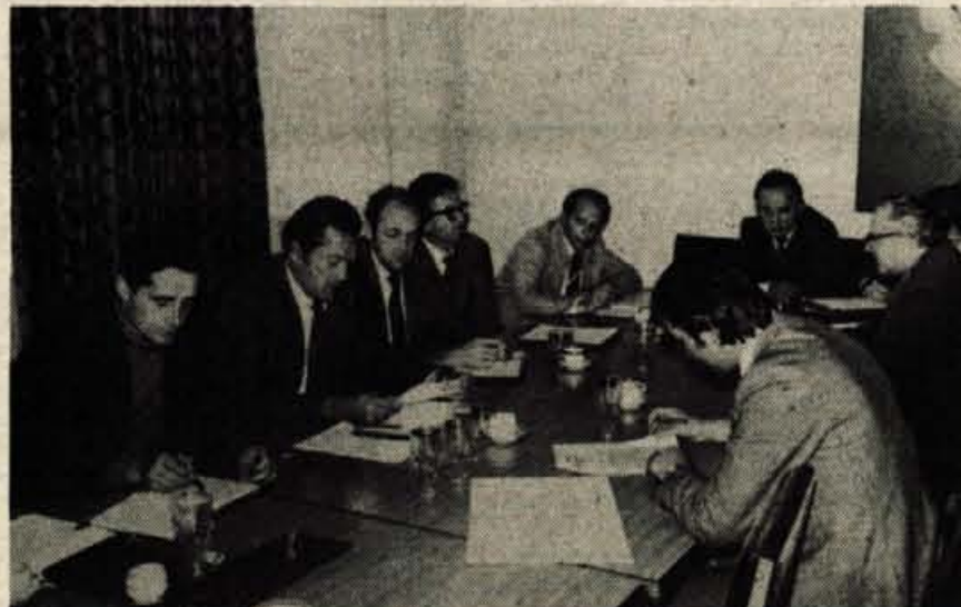
Medobčinski svet SZDL za Gorenjsko je v četrtek razpravljal o delu in nalogah socialistične zveze in družbenopolitičnih organizacij do prihodnjega poletja