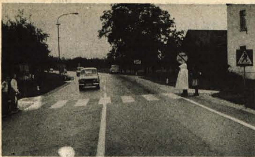
Solarji na cesti potrpežljivo čakajo, da bodo vozniki postali pozorni na prehod za pešce, na gručo otrok, ki se jim mudi v šolo ter na pionirja prometnika v oranžnih uniformah, ki naj bi sošolcem pomagala pri prečkanju ceste: neredko se voznikom tako mudi, da pred prehodom ne ustavljajo in je prehod prost šele, ko se cesta popolnoma izprazni. — L. M.