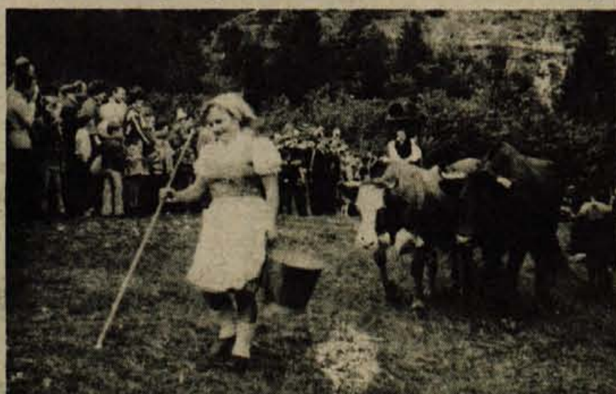
Bohinj — Letošnji kravji bal je privabil v Ukanc nekaj tisoč ljudi iz vseh krajev Slovenije. Organizatorji so pripravili zanimiv program, v katerem so planšarice in planšarji prignali živino v dolino, opremljeni z »basengo« in dobro voljo... .

Krave so se potem pustile občudovati po vsem Ukancu, obiskovalci pa so zagrizli v kranjske klobase, topili v ustih slastne žgance ali ščipaje okušali bohinjki sir. Nad tisočglavo množico se je vrtela rdeča marelja zagrizenih ljubiteljev bala iz Komende, planšarji pa so utrujeno posedli k malici, da bi se popoldne zavrteli ob viži Alpskega kvinteta. Kogar je motil ob cesti razstavljeni kič, se je pač obrnil stran, kajti priložnosti za pritenjen vzdih ob pristni lepoti jezera, gora in narave nasploh je imel v tem kotičku več kot preveč... D. Sedej