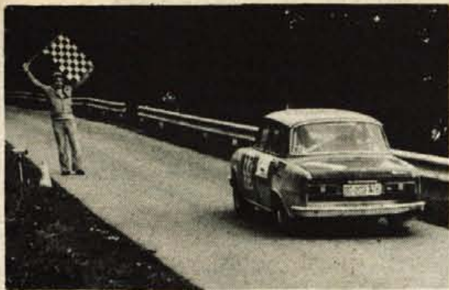
Zadnje gorsko preizkušnjo so na rallyju Loka '77 imeli vozniki v Dražgošah.