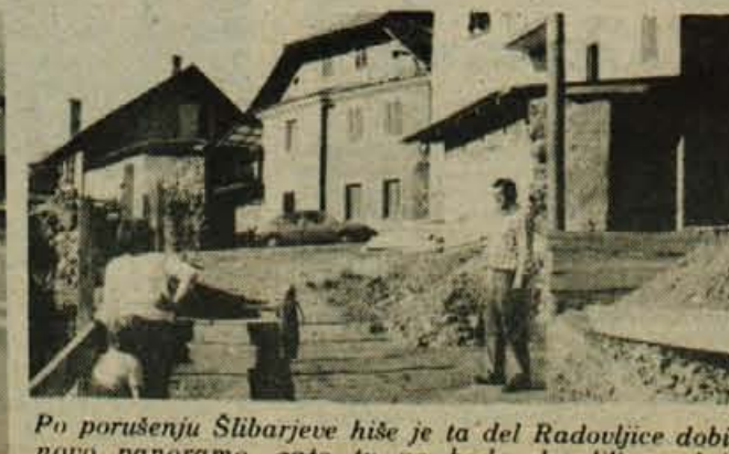
Po porušenju Šlibarjeve hiše je ta del Radovljice dobil novo panoramo, zato tu ne bodo dovolili gradnje nobenih provizoričnih objektov. Hkrati pa so lahko začeli urejati dostop na pokopališče in graditi mrliške vežice.