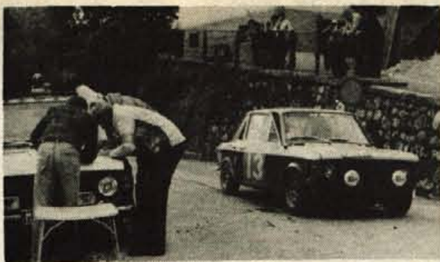
Na letošnjem državnem in republiškem prvenstvu Loka rally '77 ki je prvič potekal po Gorenjski, so obilo delali tudi kontrolorji na posameznih etapah.