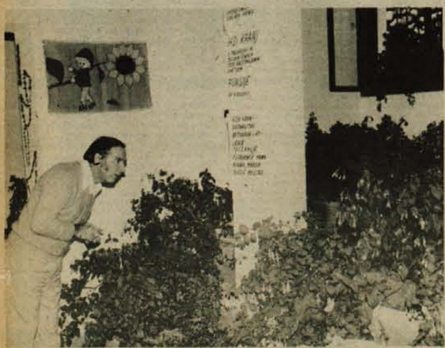
Preurejeni prostori Hortikulturnega društva Kranj bodo postali razstavni informativni center: letos bosta v prostorih, nad katerimi so patronat prevzeli kranjski taborniki, še dve razstavi. – Foto: J. Zaplotnik