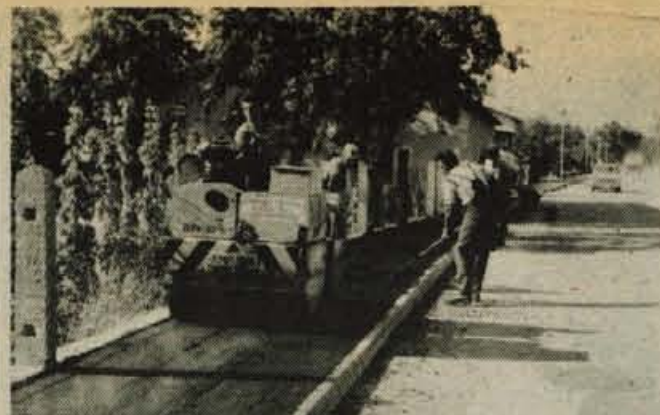
V Šerčerjevi ulici so poleg javne razsvetljave pred dnevi uredili tudi pločnike