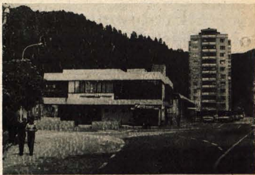
Središča Tržiča z novo avtobusno postajo.

Izvršni svet prav tako predlaga, naj znaša kanalščina tako za gospodinjstvo kot za gospodarstvo v prihodnje 90 par. Tudi ta predlog za povečanje je utemeljen, saj je kanalizacija v tržiški občini neurejena.