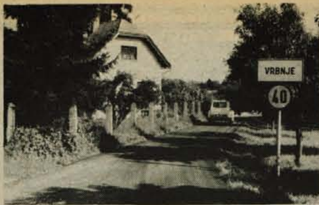
Po programu, sprejetem na referendumu o samoprispevku, so že asfaltirali okrog 600 metrov ceste do vasi Vrbnje.

»Doma sem blizu Stare Pazove, vendar že odkar sem zaposlen v kranjski pekarni, živim v Kranju. Za peka sem se izučil pred vojno. Takrat so bili delovni pogoji še veliko težji. Nismo le mesili testo in pekli kruh, ampak smo ga morali tudi sami raznašati po hišah. Po vojni se je potem začelo vse modernizirati in tudi v pekarstvu smo si želeli boljše pogoje. S pomočjo občine smo dobili novo pekarno, ki pa bo kmalu postala premajhna. Bili pa so tudi začetki v Kranju težki. Ročno smo mesili testo in takratne peči so marsikomu prizadele vid. Zaradi slabih prostorov smo bili peki vedno izpostavljeni prepihu. Razen tega pa sem vedno delal ponoči. Marsikdo je zaradi takšnih pogojev odšel iz pekarnice. Tudi danes še vedno delamo delno ponoči. Včasih sem razmišljal, da bi pustil ta poklic. Vendar sem vztrajal in upam, da bom v kranjski pekarni dočkal tudi pokojnino. Zame je sicer že vseeno, vendar zaradi mladih, ki se praktično ne odločajo več za pekarski poklic, bi morali nekaj ukreniti glede nočnega dela. Če ne drugače, bi morali pekarni priznati vsaj beneficirani delovni staž.«