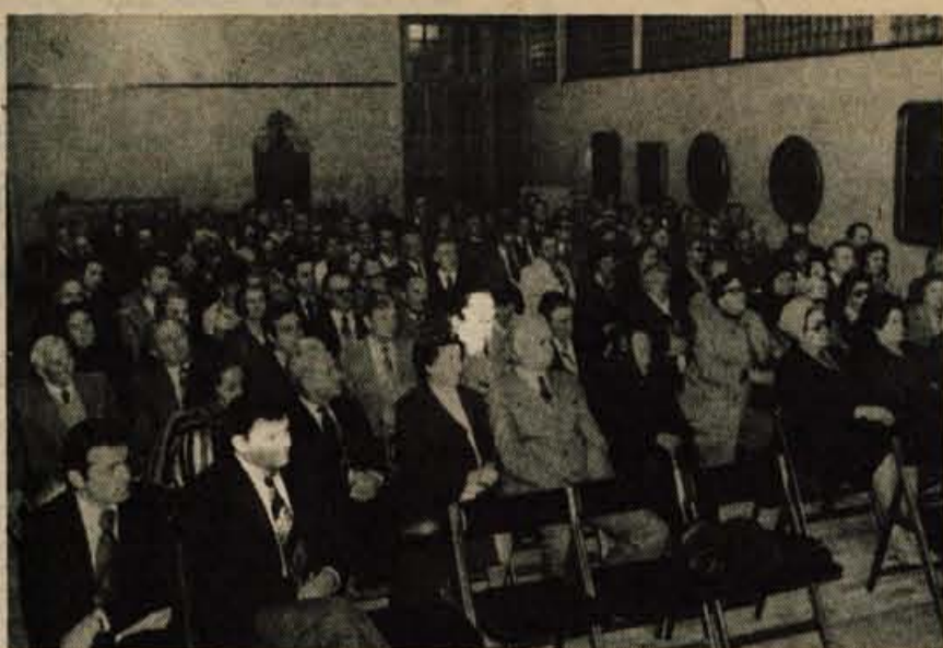
V petek je bila na loškem gradu proslava ob 40-letnici muzejskega društva Škofja Loka

Muzejsko društvo Škofja Loka pa je svojo dejavnost razširilo tudi na obe dolini. Tako v Železnikih kot v Zireh že delujeta muzejski ustanovi z zbirkami, ki so značilne za preteklost obeh krajev.