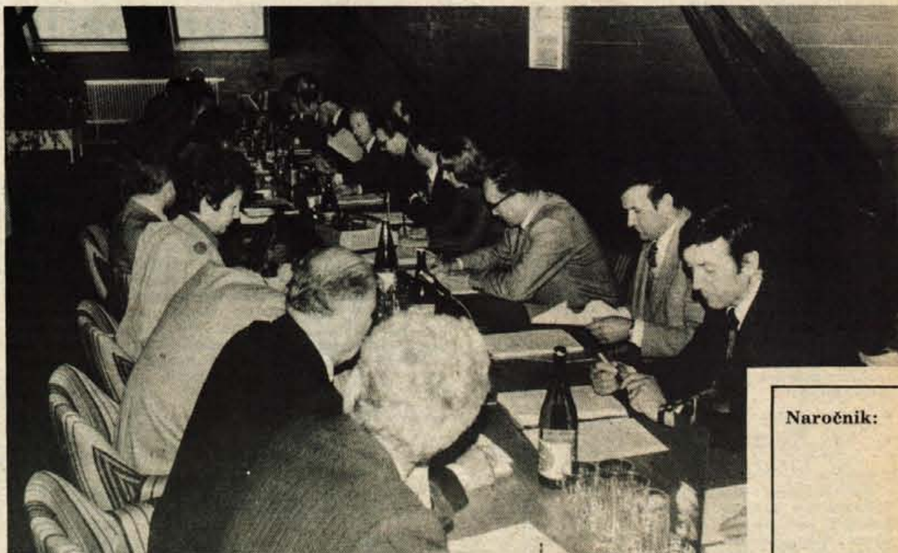
Namen nove organiziranosti bančništva je, naj banke v prihodnje uresničujejo interese združenega dela, so poudarili na petkovem posvetu v Kranju