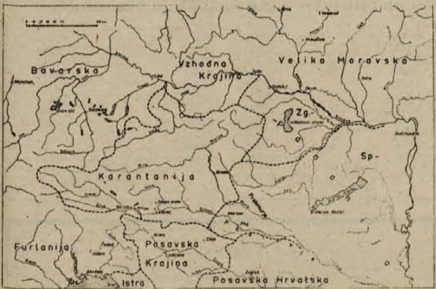
Ozemlje, kjer sta med Slovani delovala Ciril in Metod

Hotel se je panonski knez Kocelj otresti vpliva in oblasti solnograških škofov - zato je