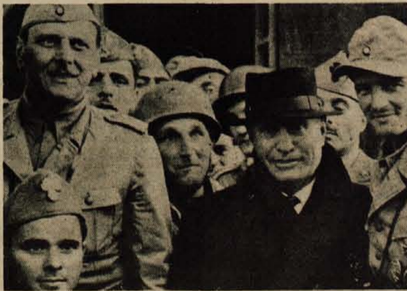
In vendar je Mussolini še za dobro poldrugo leto ušel roki pravice. Nemški padalci pod vodstvom zloglasnega esesovca Scorzenyja so ga rešili iz gorskega hotela v Gran Sasso.