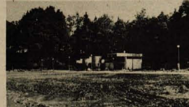
Delavci SGP »Tehnike končujejo dela pri graditvi prve faze pokopališča v Lipici poleg Škofje Loke. Pokopališče ima prostora za 600 grobov. V lepo oblikovanem objektu so uredili dve mrliški vežici, poslovilni prostor ter lokal za cvetličarno. Na zgornji terasi pa so uredili večji parkirni prostor ter avtobusno postajališče. Investitorja, krajevno skupnost Škofja Loka, so dela vnela 3,84 milijona dinarjev, računajo pa, da bo pokopališče predano namenu že prihodnji mesec. (-fr)