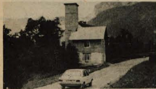
Bohinjska Bela - Gasilci na Bohinjski Beli v radovljški občini so se že pred časom odločili, da povečajo nekdanji gasilski dom, ki je postal premajhen. Dela so v glavnem končana. Člani društva so precej del opravili prostovoljno, njihovo akcijo pa so podprli tudi prebivalci krajevne skupnosti s prostovoljnimi prispevki. - B. B.

V organizaciji mladinskega odseka Planinskega društva Medvode je bila v Tamarju tretja planinska šola. 36 tečajnikov se je teden dni spoznavalo z bivanjem v naravi, s favno in floro, orientacijo, hojo v gorah, plezalnih veščinah ter družbeno samozaščito. Pionirji in mladinci do 15. leta starosti so tako teden dni počitnic preživeli pod strokovnim vodstvom vodnikov, ki so izkoristili letni dopust za posredovanje znanja mlajšim vrstnikom. V očiščevalni akciji pa so skupaj z gorsko stražo očistili okolico doma v Tamarju. -fr