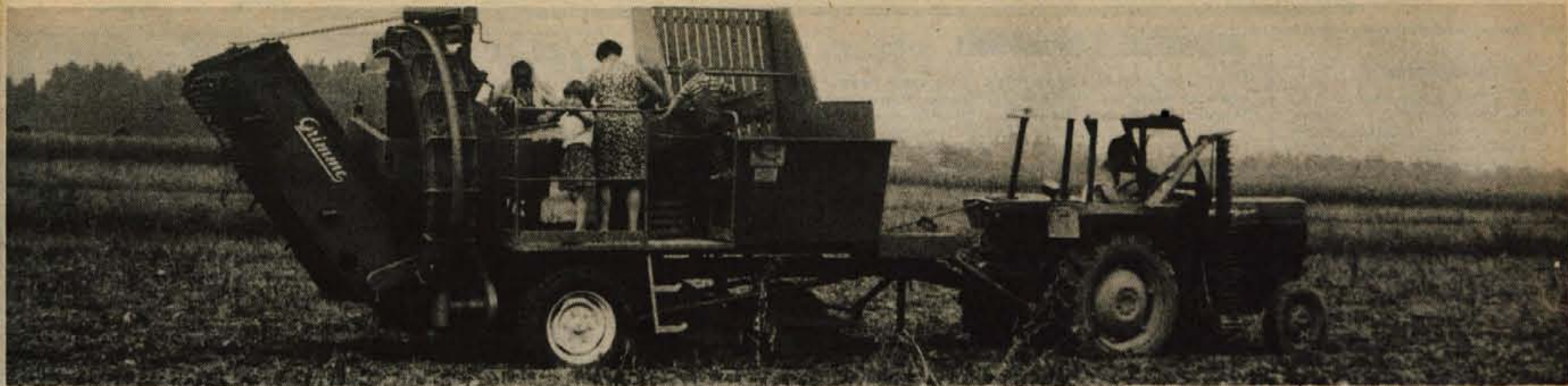
Kmetje so začeli izkopavati krompir. Vendar za zdaj še ni zanesljivih poročil in ocen kakšna bo letošnja letina, prav tako pa se v republiki še nismo dogovorili, kolikšna bi odokupna cena. Posnetek je s polja pri Voklem. (jk)

Leto XXX. - Številka 64 TRIDESET LET 1947-1977