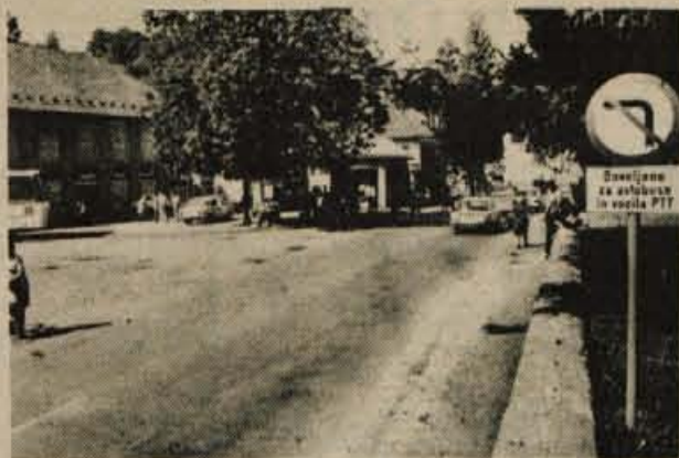
V Škofji Loki je po zapori prometa po Mestnem trgu stiska s parkirnimi prostori še večja. Marsikateri voznik, ki s kranjske ali ljubljanske smeri pripelje v Škofjo Loko, spregleda prometni znak in parkira na pločniku pred pošto. Največkrat se zgodi, da ga dvojni prekršek velja kazen. Ob tem pa so avtobusi pogosto dalj časa neovirano parkirani na pločniku, vendar jih nihče ne preganja, čeprav močno ovirajo številne pešce. -fr