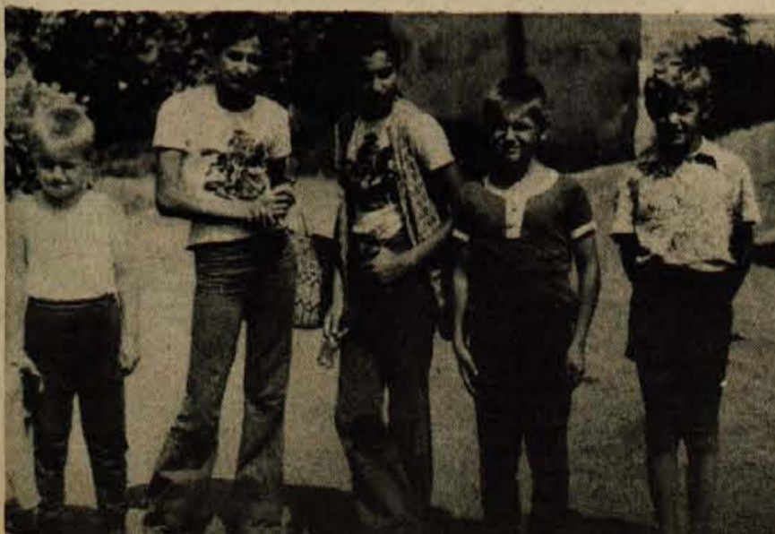
Otroci iz Slovenske vasi pri Monoštru. Mali porabski Slovenci so natanko taki kot naši nadebudneži - v vsem so podobni tudi gorenjskim Kekcem in Mojcam.

V zapise o slovenskem Porabju pa vpletam pripoved o Cirilu in Metodu prav zato, ker se je na tleh Koceljeve kneževine (njen osrednji del je bilo današnje Porabje in Pozalje, daleč prek Blatenskega jezera!) sprožil duhovni spopad med nemštvo in slovanstvom in doživel prav tu svoj vzpon in - zlom... Vzhodno od panonskih ravnin je obveljala cirilica (Cirilove pismenke) še v današnje dni (vsaj v Rusiji, Bolgariji, Srbiji in Črni gori).