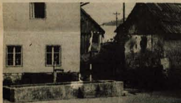
Srednja vas - Z napeljavo vodovodov v hiše in hleve so pri nas v glavnem izginila značilna vaška korita. Čeprav imajo v Srednji vasi v zgornji bohinjski dolini vodovod, je nekdanje vaško korito še vedno ostalo. - B. B.