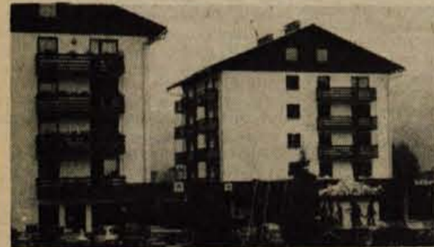
Bohinjska Bistrica - Gradbeno podjetje Bohinj končuje z gradnjo petega štirinadstropnega stanovanjskega stolpča v Bohinjski Bistrici. V pritličju tega stolpča so prostori slaščičarne in enote Ljubljanske banke. Z dograditvijo tega stolpča bo končana tudi stanovanjska gradnja v tem delu Bohinjske Bistrice. - B. B.