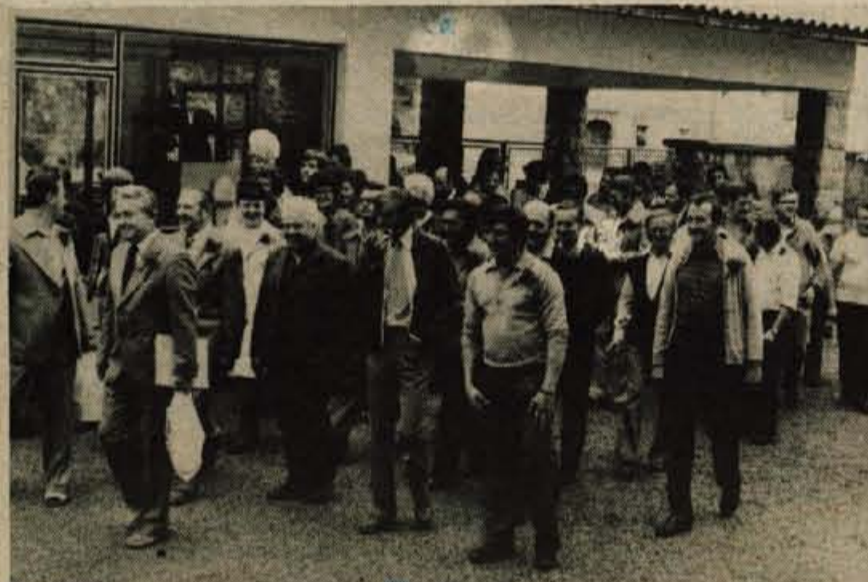
Pri žirovskih godbenikih so bili v gosteh člani pihalnega orkestra tovarne Sandrik iz Slovaške. Med drugim so si ogledali tovarno Alpina, kjer so jih predstavniki delovne organizacije in družbenopolitičnih organizacij seznanili s proizvodnjo in samoupravljanjem.

GLASILO SOCIALISTIČNE ZVEZE DELOVNEGA LJUDSTVA ZA GORENJSKO