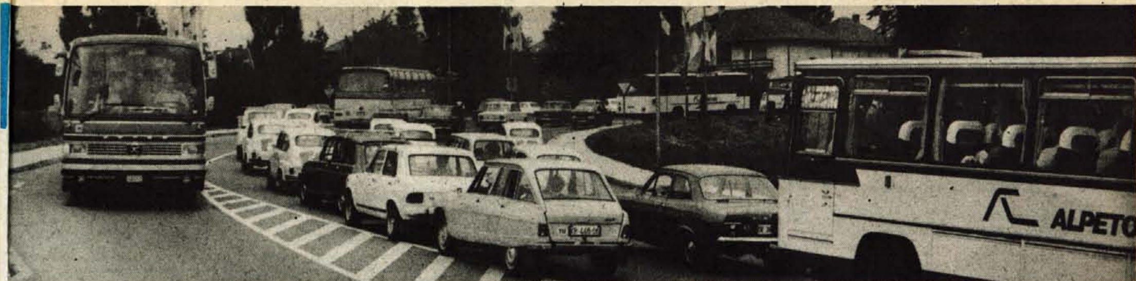
Urejanjem križišča pred Iskro so v Kranju pred nadavnim uredili tudi nov prometni red, ki bo veljal tudi po ureditvi semaforkega križišča v Savski loki. Zaradi gradnje križišča in najbrž tudi zaradi še »neutečenega« novega prometnega reda pa je na semaforkega križišču Koroške in Kidričeve ceste na Zlatem polju pogosto precejšnja gneča. — A. Z.

Leto XXX. — Številka 62 TRIDESET LET 1947-1977