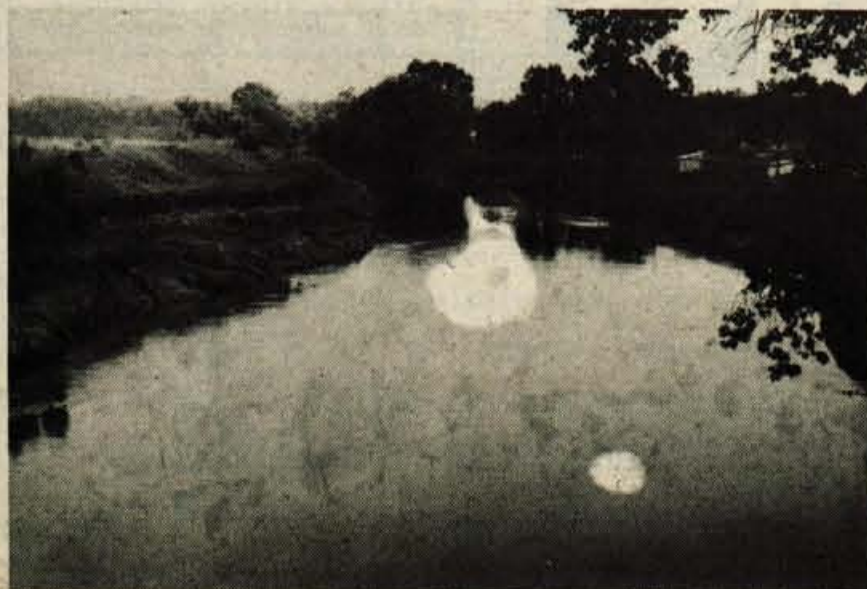
Ob Rabi - tihi, sanjavi.