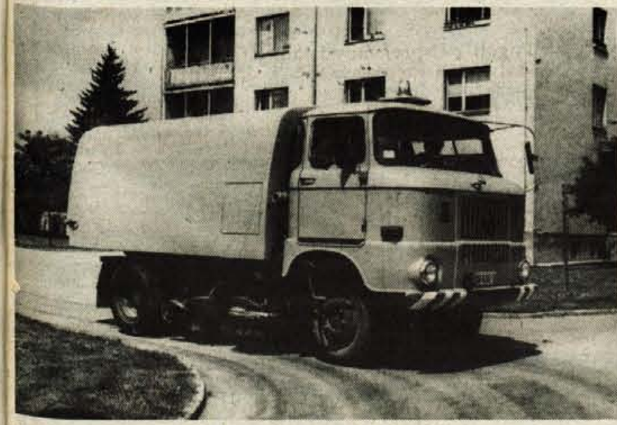
Nov pometalni stroj Komunalnega, obrtnega in gradbenega podjetja Kranj, kupljen s sredstvi podjetja in posojilom občinske skupščine, pomaga pri vzdrževanju javne snage v Kranju