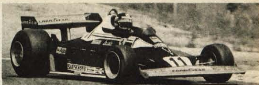
Niki Lauda s svojim ferrarijem

Ekipno: 1. Krize 1440,1, 2. Triglav 1419,7, 3. Ilirija 950,0. J. Kikel