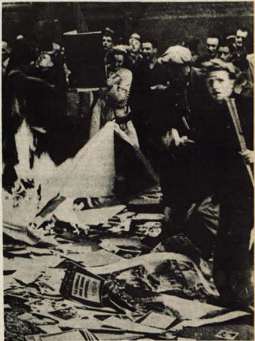
Po prvem navdušenju se je pozornost množice obrnila proti vsemu, kar jih je spominjalo na težke čase fašistične vladavine. Zagoreli so ognji.

Šele tedaj so Nemci sprejeli povabilo na prigriček. Ko sta Ribbentrop in Keitel popila kavo, pa sta vstala in se brez kakršnegakoli pojasnila z avtom hitro odpeljala čez mejo v Podkloster, kjer sta ukazala tamkajšnji diviziji, naj takoj pospravi šotore in se premakne v Italijo.