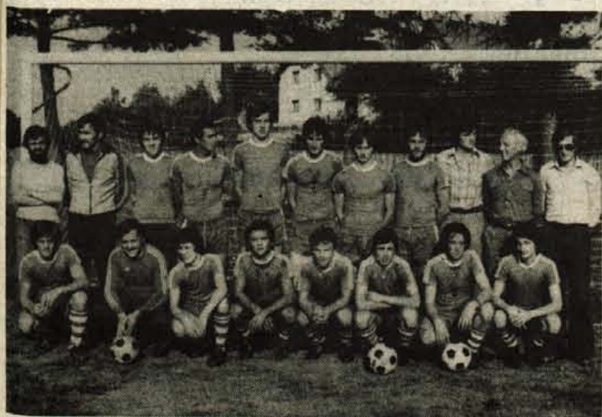
Škofja Loka — Uspele priprave slovenskega atletskega kluba Celovec — Na pripravah za avstrijsko nogometno prvenstvo so se nogometaši slovenskega atletskega kluba iz Celovca, ki jih še vedno tare prepoved igranja na celovškem stadionu, po enotedenskem treningu srečali v prijateljskih tekmah s stražiško Savo, kranjskim Triglavom in loškim LTH. V vseh treh tekmah so bili boljši, le Sava je z njimi remizirala. Izidi srečanj: Sava : SAK 1:1 (1:0), Triglav : SAK 3:4 (1:0), LTH : SAK 1:2 (0:0). — (dh) Foto: F. Perdan

Kranjski pionirji na Koroškem — Občinska zveza društev prijateljev mladine iz kranjske občine že vrsto let sodeluje z organizacijo Kinderland Junge Garde iz Celovca. Sodelovanje poteka z izmenjavo pionirjev v kolonijah. Pionirji iz kranjske občine vsako leto letujejo tri tedne v bližini Dobrle vasi na Koroškem, koroški pionirji pa v Novigradu. Letos letuje na Koroškem 34 pionirjev iz kranjske občine v počitniškem domu organizacije Kinderland Junge Garde. Skupaj s koroškimi pionirji, ki so tudi na letovanju v domu, so v nedeljo, 14. avgusta, popoldne pripravili prijetno popoldne s kulturno zabavnim programom za starše iz kranjske občine in s Koroške. Kranjski pionirji, ki se vsi zelo dobro počutijo, se bodo vrnili v Kranj v soboto, 20. avgusta, okrog 11. ure dopoldne. Na sliki: skupina pionirjev iz kranjske občine je na nedeljskem srečanju zaplesala tudi kolo. — Foto: A. Zalar