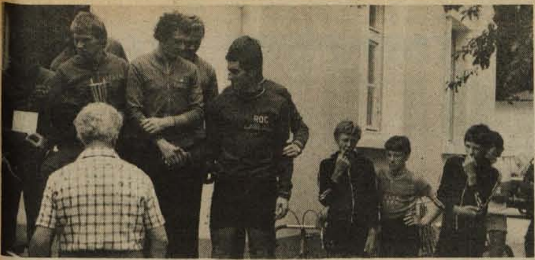
Najboljši trije z ekipnega državnega prvenstva v kolesarstvu na zmagovalni stopnički: Sava Kranj, M.C. Zagreb in Rog Ljubljana.