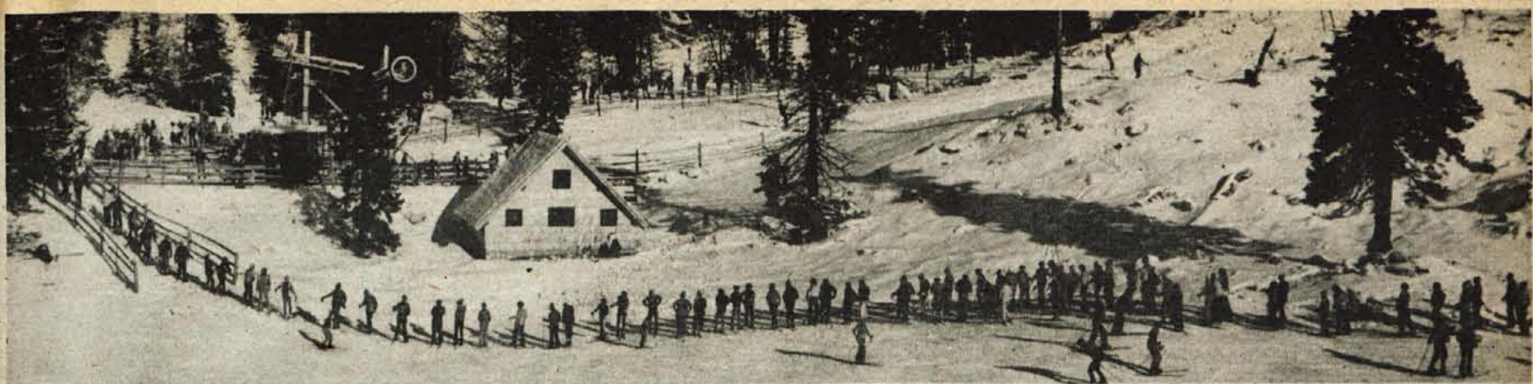
Letošnjo zimsko sezono se smučarji in žičničarji glede snega ne morejo pritoževati. Povsod na Gorenjskem, kjer so žičnice, ga je dovolj. Bomo torej to »turiščno zimsko« (poslovno) uspešno sklenili? — A. Ž.