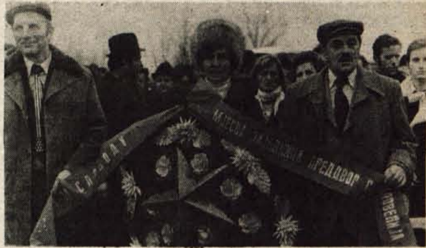
Delegacija krajevne skupnosti Preddvor polaga venec k spomeniku padlih borcev

Precej uspehov imajo naši gostitelji tudi na športnem področju. Njihov nogometni klub »Proleter« je prvi vaški klub v Bosni in Hercegovini, ki tekmuje v conski ligi. Na stadionu, na katerega bi bilo ponosno tudi kako večje mesto, vsak dan trenirajo pionirji in njihov nogometni klub je eden najboljših v BiH. Prav tako uspešno deluje tudi plavalna sekcija, saj so pred kratkim zgradili olimpijski bazen, ki ima še to prednost, da ima toplo vodo.