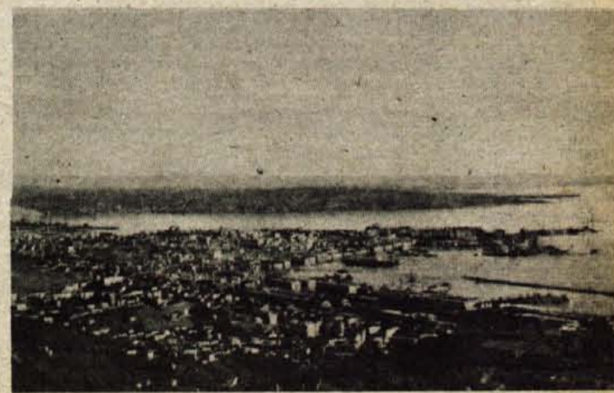
Pogled na Trst in pristanišče