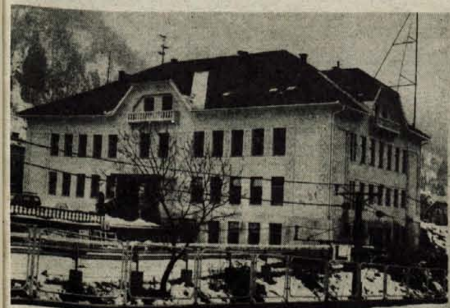
Delavci SGP Projekt Kranja so po pogodbi samoupravne stanovanjske skupnosti Jesenice obnovili Titov dom na Jesenicah. Del sredstev so za financiranje Titovega doma namenili tudi kulturna skupnost Slovenije, kulturna skupnost Jesenice ter Radio Jesenice, ki ima prostore v stavbi Titovega doma. (ds)