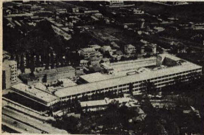
Tovarna kinoprojektorjev v Rivoliju