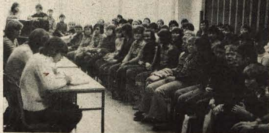
Vsi učenci, ki so prevzeli najrazličnejše dolžnosti na šoli — od vzgojiteljice v urtu, do učiteljev in kuharic, so se po končanih obveznostih zbrali in ugotovili, da so preskušnjo odgovornosti dobro prestali.

Vozniki, ki so na odsluženju vojaškega roka, so lani na Gorenjskem in izven nje prevozili okrog 950.000 kilometrov. Vse naloge s tem v zvezi so uspešno opravili in zato dobili tudi priznanja. Na svečanosti pa so še posebej poudarili, da v JLA posvečajo veliko pozornost in skrb vzgoji in usposabljanju voznikov in avtomehanikov. Tako so le-ti, ko odslužijo vojaški rok, usposobljeni za to delo tudi v vsakdanjem prometu, predvsem pa za uresničevanje programov splošne ljudske obrambe. Ena glavnih skrbi pri