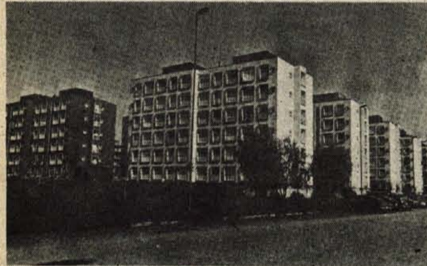
Novo delavsko naselje Cascine Vica v Rivoliju