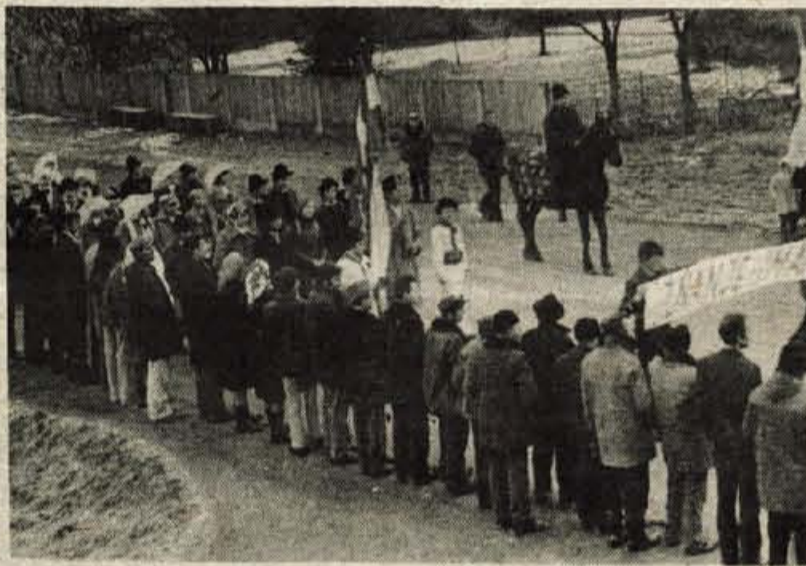
V povorki, ki je naznanjala začetek velike prireditve, so med drugim sodelovali člani pionirske folklorne skupine osnovne šole Matija Valjavec iz Preddvora

Vesolja ob prvih stikih in pozdravih, priskrbenih objemih in poljubih med prebivalci obeh krajevnih skupnosti je bilo za trenutek konec. Tričlanska delegacija krajevne skupnosti Preddvor je položila venec k veličastnemu spomeniku, ki so ga pred kratkim postavili v spomin borcem za svobodo; vsem tistim, ki so na tem področju padli za svobodo. Predsednik zveze borcev iz vasi Dvorovi je podal kratko zgodovino NOB in oralni pomen spomenika, ki je zares veličasten. Vitka, sloka linija iz klesanega kamna v trikotni obliki hiti kviku, kar simbolizira tri mejne pokrajine. Poleg tega je precej široka okolica spomenika preurejena v spominski park, v katerem so postavljene plošče v spomin posameznim junakom-borcem in udarnim brigadam in bataljonom. (se bo nadaljevalo)