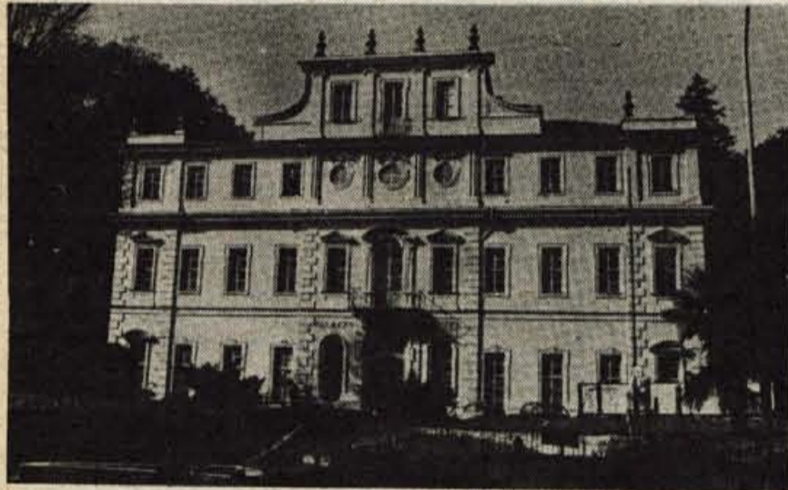
Mestna hiša v Rivoliju