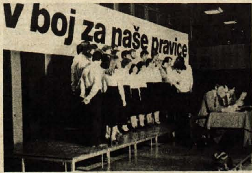
Dvorana borovelske mestne hiše ni mogla sprejeti vseh zborovalcev, ki so se zavežali, da bodo vztrajali do konca v boju za narodnostne pravice.