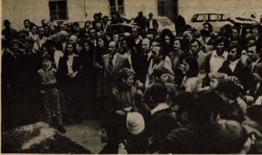
Goste iz Semberije je na vsakem koraku spremljalo gostoljubje krajanov Preddvora, Bele, Visokega in okoliških vasi