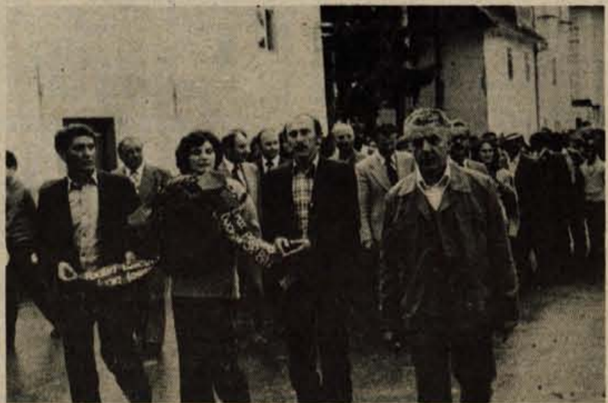
Delegacija Dvorovov in krajevnih skupnosti gostiteljic je položila venec k spomeniku v Preddvoru. Tridnevnega srečanja, ki je bilo končano v nedeljo, so se udeležili tudi predstavniki kranjske skupščine in družbenopolitičnih organizacij in delegacija občine Bijelina.