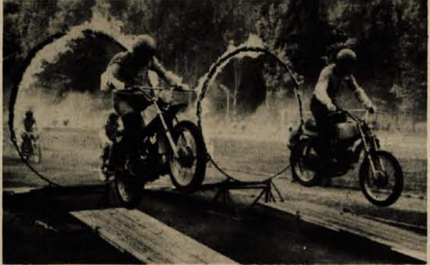
Milčičniki in gojenci šolskega centra RSNZ so na prireditvi ob dnevu varnosti, ki je bila 11. maja v Tacnu pokazali svoje znanje in veščine.