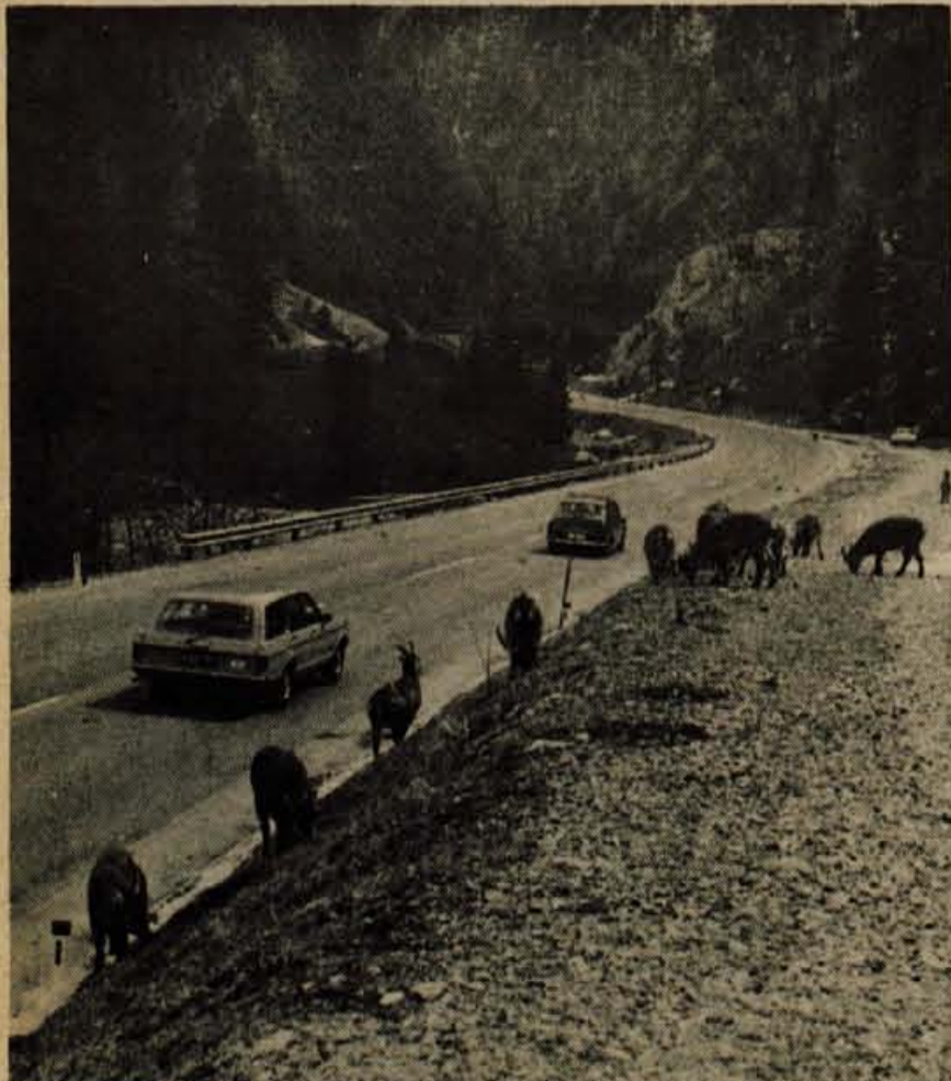
Posnetek je morda zato nenavaden, ker je nastal ob cesti v Podljubelj. Promet na tej cesti je vedno precej živahen, vendar kot kaže jeseni in zgodaj spomladi ne moti kozorogov. Ker jim v višjih legah primanjkuje hrane in ker so navajeni na krmišča, jih pogosto srečamo v dolini.