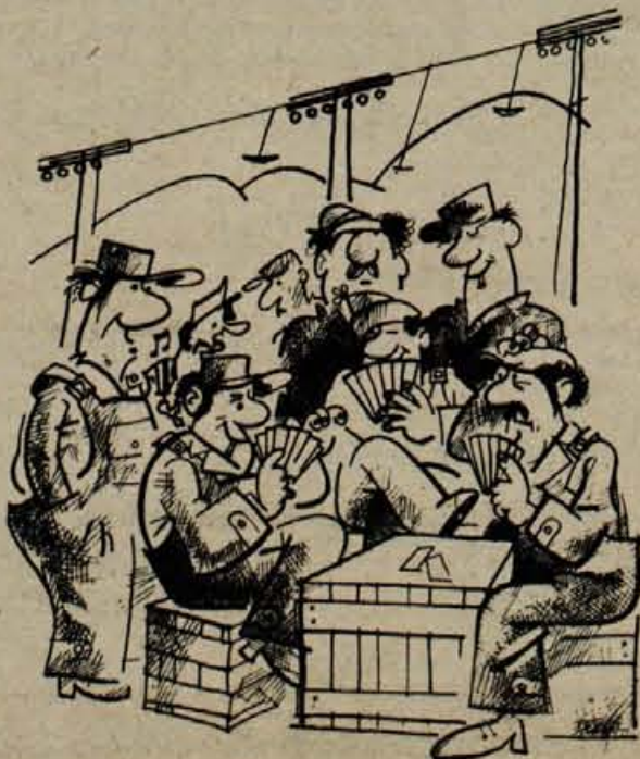
Osem žičničarjev je prišlo na delo, lica jim žare veselo...