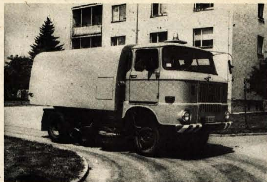
Kranjski komunalni delavci so začeli uporabljati za pometanje in pranje ulic nov stroj, ki ga za zdaj v Kranju še nismo srečali.

Dolga in neozdravljiva bolezen je prekinila mlado življenje