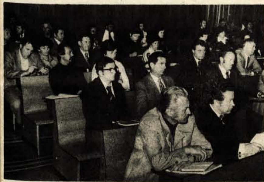
KRANJ - V torek, 10. maja, je bilo v Kranju posvetovanje o problematiki malega gospodarstva. Posvetovanje, ki so se ga udeležili predstavniki iz vseh jugoslovanskih republik in pokrajin, je letos že drugič pripravil Gorenjski sejem v sodelovanju z gospodarsko zbornico in komitejem za zasebno delo pri izvršnem svetu. Poleg ostalih tem je sedemdeset udeležencev dvodnevne posvetovanja poslušalo še predavanja o pomenu urbanizma in izobraževanja deficitarnih poklicev. (ds)

Občinska konferenca SZDL je sprejela vrsto sklepov za hitrejšo izboljšanje stanja v kmetijstvu in gozdarstvu in njegovem organiziranju v skladu z novim zakonom o združenem delu in nakazala smernice za njihovo konkretno uresničevanje. Bistvo teh sklepov se zrcali v pripravljenih akcijah in ukrepih, ki jih bodo z združenimi močmi neposredno zainteresiranih kmetov, zadrugarjev, družbenopolitičnih organizacij in pristojnih interesnih skupnosti, skušali dosledno izvajati tako kot je nakazano tudi na problemski konferenci o kmetijstvu in v razpravah po krajevnih skupnostih.