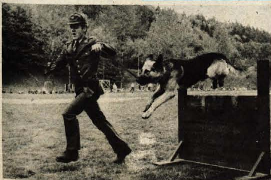
Tudi psi so nepogrešljivi pri uspešnem delu naših miličnikov. Šolanje nemških ovčarjev traja približno pol leta. Toda že po mesecu in pol »vzgoje« so pokazali veliko »znanja«.