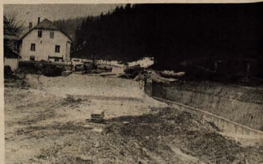
PODKOREN - Delavci SGP Gradbinec opravljajo zaključna dela pri gradnji novega mostu čez Savo v Podkorenu. Omiliti nameravajo dokaj oster ovinek stare ceste.

Vsi interesenti, ki si žele ogledati stroj, naj se zglasijo 1 uro pred pričetkom dražbe.