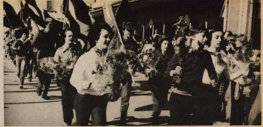
Štafeta mladosti s pozdravi jugoslovanske mladine predsedniku Titu in čestitkami za njegov 85. rojstni dan potuje po Sloveniji. Včeraj popoldne so jo pozdravili v Domžalah.