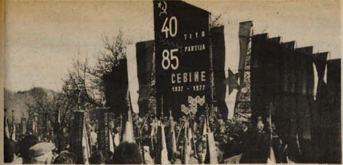
V soboto je bila na Čebinah nad Trbovljami proslava v počastitev 40. obletnice ustanovnega kongresa KPS, 40-letnice prihoda tovariša Tita na čelo partije in njegovega 85. rojstnega dne.