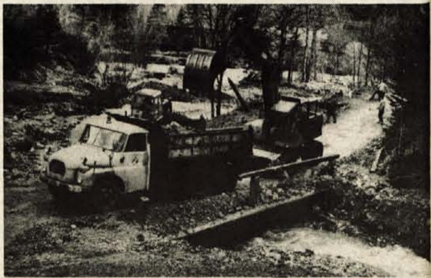
Odstranjevanje posledic hudournika Vobenca na cesti proti Jezerskemu v Kokri