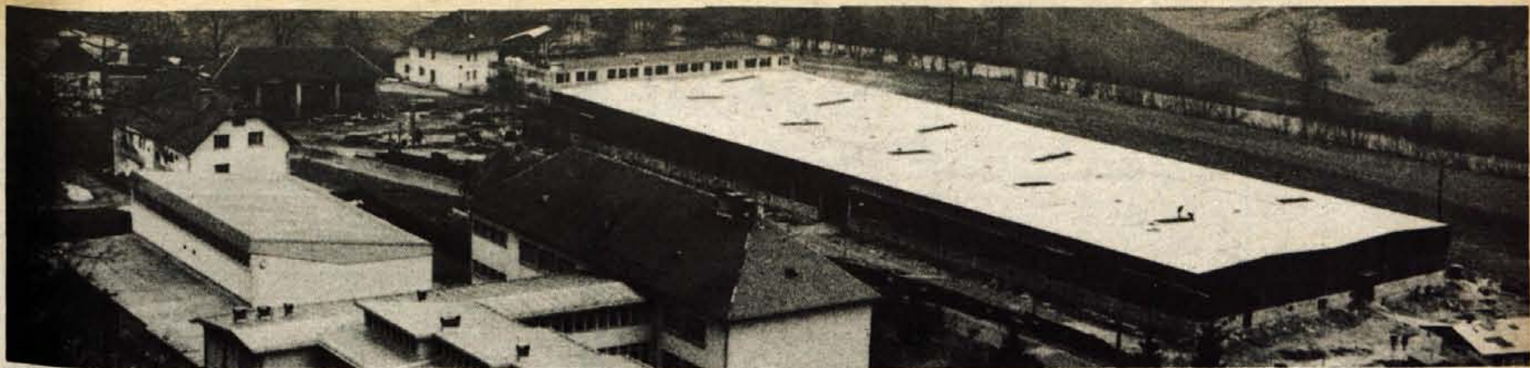
Železniki — V Železnikih bodo letos odprli nove proizvodne in poslovne prostore delovne organizacije »Niko«. Tako bo uresničena dolgoletna želja tega kolektiva. (jg)