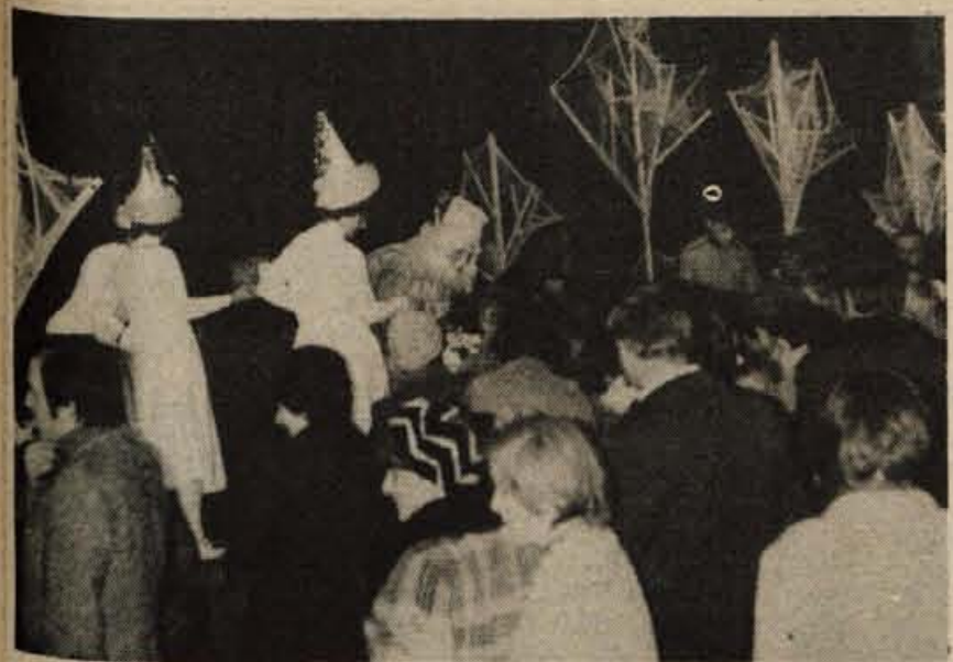
V torek popoldne je bilo v kinu Center v Kranju živahno. Dedek Mraz je tu obiskal okrog 600 otrok delavcev ŽIVIL. Najprej jim je zavrtel nekaj risank. Ko pa so mu povedali veliko pesmic in tudi skupaj zapeli, jim je razdelil darila.