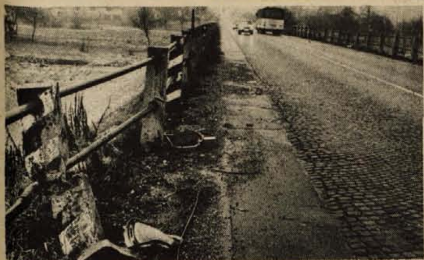
Ko se ceste v hladnih nočeh spremenijo v drsalnice, je najbolj nevarna površina kockasto vozišče: vozniki, ki poznajo nakelski nadvoz, so zato tembolj previdni, drugače pa je, če voznik ne ve, da se na določenem odseku rada pojavlja poledica. Posledice so znane: veliko zvitih pločevine, močno vzdolžena ograja nadvoza in tudi ranjeni.