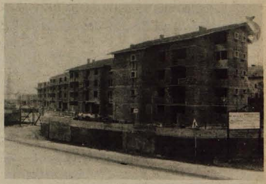
V novi stanovanjski soseski MeS 7 v Preski gradijo delavci gradbenega podjetja Megrad, TOZD Gradles Medvode štiri stolpice, v katerih bo 215 stanovanj. Kvadratni meter solidno grajenih stanovanj s centralno kurjavo bo veljal 6680 dinarjev ter so polovico stanovanj, ki bodo vseljiva novembra prihodnjega leta, že prodali.