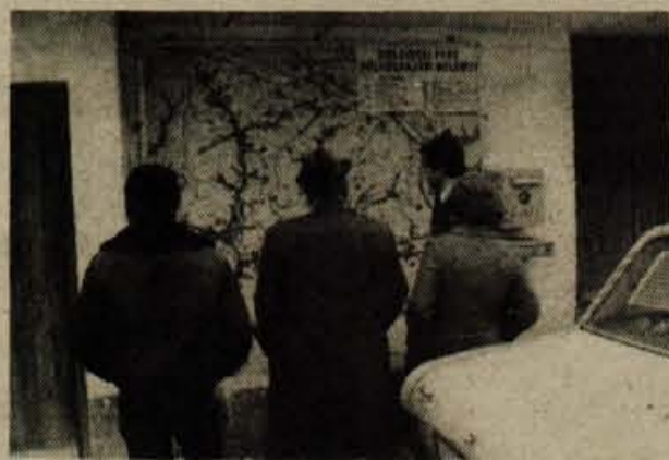
Katarina je bila in ostaja prijetno shajališče izletnikov, ki pridejo bodisi peš ali se pripeljejo z avtomobilom. Domače turistično društvo je uredilo pregledno karto Krajskega parka Polhograjski Dolomiti, katero si obiskovalci z zanimanjem ogledajo, preden nadaljujejo pot.

Na skupščini so razpravljali tudi o financiranju kluba študentov. Tudi prihodnje leto bo zanj skrbel občinska konferenca ZSMS, čeprav njena finančna sredstva niso velika. Klub si bo v prihodnje prizadeval zagotoviti trajnejše in stalnejše vire financiranja, pri čemer bo pomembna vloga samopravnih interesnih skupnosti.