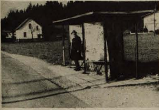
Autobusno postajališče »Na klancu« v Medvodah rabi predvsem za plakatiranje. Ker pa je še okolica neurejena, ne more biti v ponos at krajanom, ne turističnemu društvu. Vprašujemo se, čemu tako?