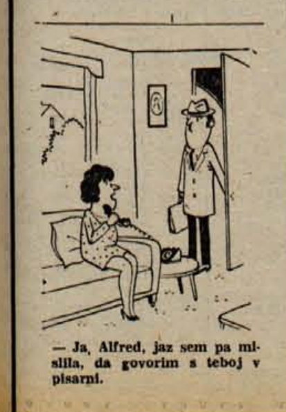
- Ja, Alfred, jaz sem pa mislila, da govorim s teboj v pisarni.