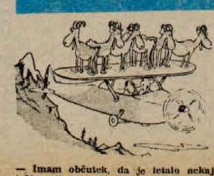
- Imam občutek, da je tetalo nekaj težje, odkar sva preletela tisto goro.