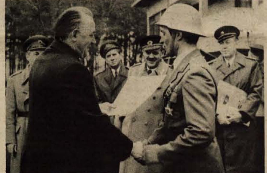
Sekretar komiteja občinske konference ZK Tolmin je na svečanosti izročil priznanja enotam in starešinam JLA, vsem tistim, ki so se še posebno izkazali in pomagali ter še pomagajo pri odpravi posledic po hudem potresu v Posočju.