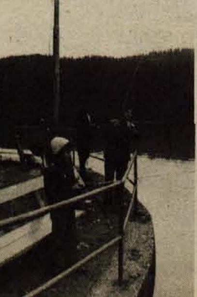
Zbiljsko jezero je spet polno rib, saj so zadnje čase ribiči zelo zadovoljni z ulovom. Posebno ob sobotah in nedeljah zjutraj se jih ob obali zbere precejšnje število, ki se nato zadovoljno vračajo domov.

Toliko za tokrat. Najlepše vas pozdravlja vaš Tržičan