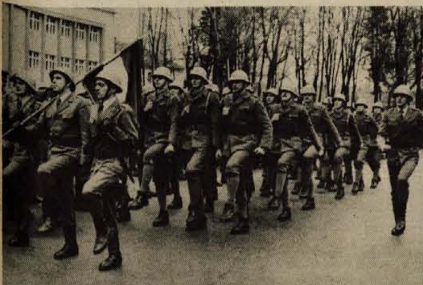
Fantje iz enote Momčila Marjanca so s strumnim korakom prinesli borbeno zastavo pred svečani zbor pripadnikov JLA.

GLASILO SOCIALISTIČNE ZVEZE DELOVNEGA LJUDSTVA ZA GORENJSKO