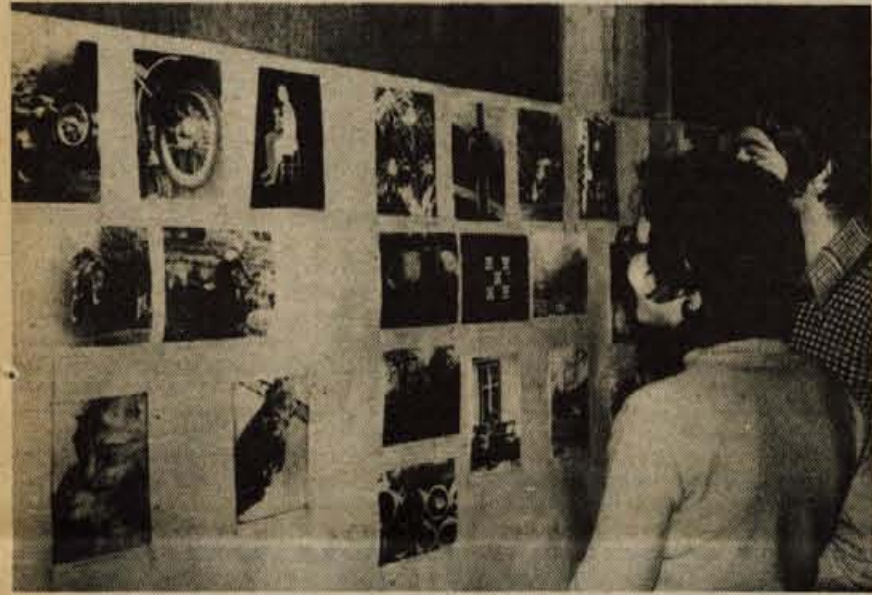
Ob 30-letnici zveze organizacij za tehnično kulturo in ljudske tehnike v radovljiski občini so na svečanosti, ki je bila v začetku tega meseca, v Radovljici v avli osnovne šole A. T. Linhartova odprli tudi razstavo fotokrožkov osnovnih šol iz radovljiske občine pod naslovom Mladina fotografira (na sliki). V prostorih krajevne skupnosti Radovljica (bivši zdravstveni dom) pa so člani fotokluba Radovljica dobili svoj fotolaboratorij.