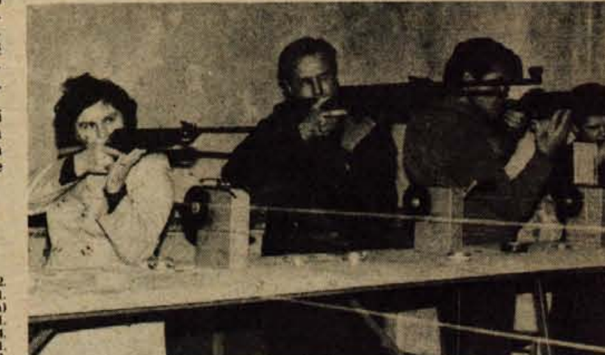
Tekmovalje strelcev v okviru X. iger občinskega sindikalnega sveta Kranj za leto 1976.