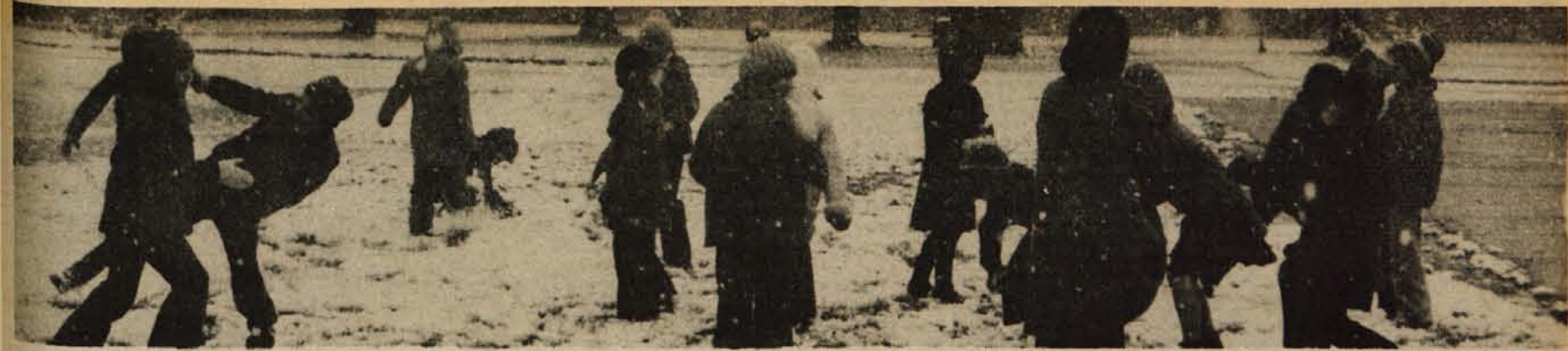
Za veselje otrok in za zaskrbljenost voznikov in cestnih delavcev se te dni v zraku vrtinčijo snežinke, ki pa se jih vsaj na Gorenjskem noče in noče naleteti vsaj za ped.