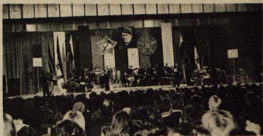
LJUBLJANA - V soboto, 27. novembra, je bila v ljubljanski dvorani Tivoli zaključna prireditev v okviru tekmovanja »Mladost v pesmi, besedi in veščini«. Pripravila sta jo poveljstvo ljubljanskega armadnega območja ter republiška konferenca ZSMS. Na teh tekmovanjih je v preteklih mesecih sodelovalo nekaj tisoč članov mladinske organizacije in pripadnikov JLA. Tekmovanje je vse do zadnje prireditve nosilo naslov »Armada zmage - armada svobode«, posvečeno pa je bilo 35-letnici ustanovitve JLA. V finale sta se prebili 6-članski ekipi iz Ajdovščine na Primorskem ter Bežigrada iz Ljubljane. Člani zmagovalne ekipe - ekipe Bežigrada - so potrdili s svojim znanjem, da dobro poznajo razvoj naše JLA v preteklih petintridesetih letih. Na sliki: tekmovanje v dvorani Tivoli. (S. J.) - Foto: S. Jesenovec