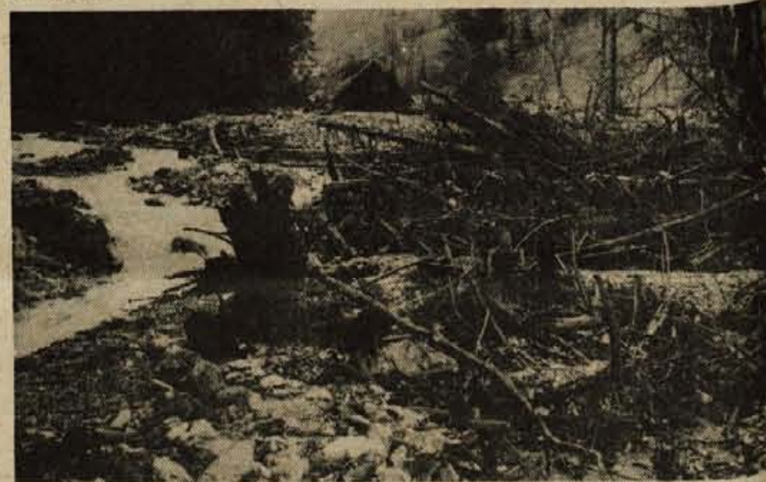
Delavci Cestnega podjetja Kranj so imeli kar precej opraviti preden so lahko očistili kameno zagozdo pod mostom, zaradi katere je voda drla kar prek mostu. Zgornje Jezerstvo je bilo zaradi tega kar dva dni odrezano od doline, v petek pa je bila cesta že prevozna. Hudournik je s seboj prinesel toliko kamena, da bo trajalo kar nekaj časa, preden bo celotno področje očiščeno. — L. M.