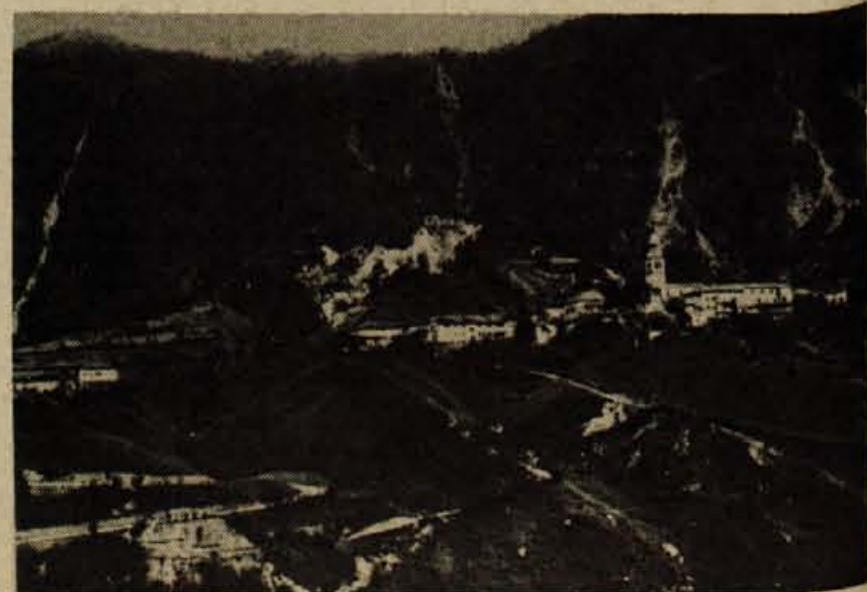
Beneško-slovenska vas na pobočju gore - nobenih njiv, le strmine, meline in skalovje...