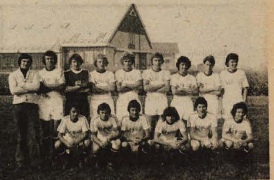
MLADINCI NAKLEGA GORENJSKI PRVAKI - V nedeljo, 7. novembra, je bila v Naklem nogometna tekma med mladinci Naklega in Tržiča...