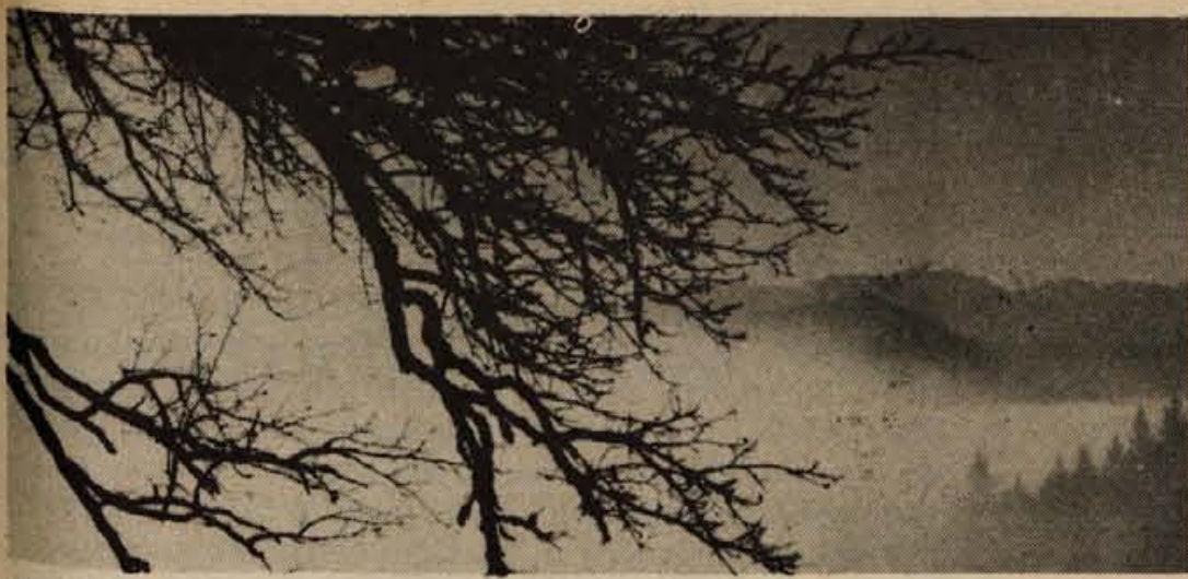
Črne, gole veje v meglenih jesenskih jutrih — to je november.