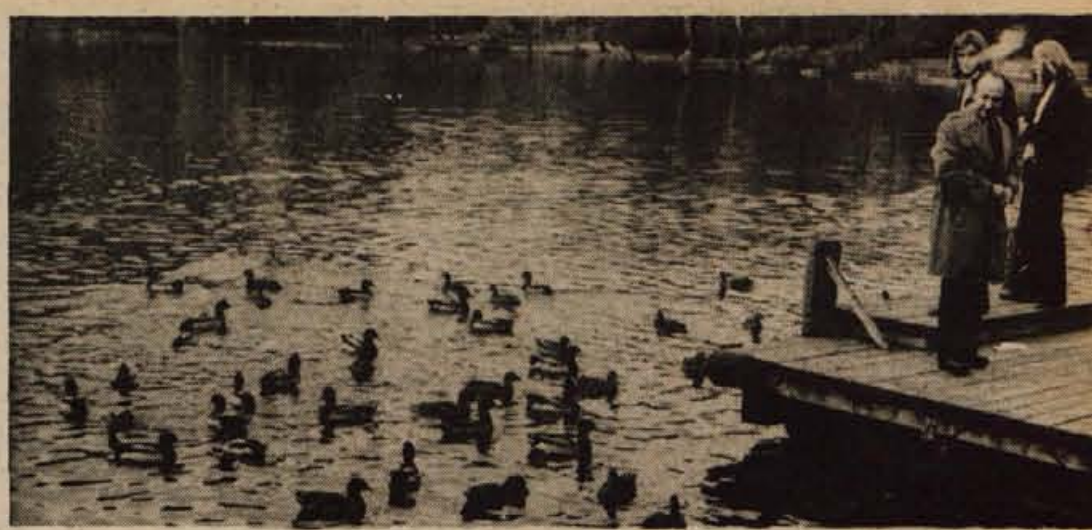
Tem pernatim kopalcem v Blejskem jezeru ni mar, če je voda hladna.