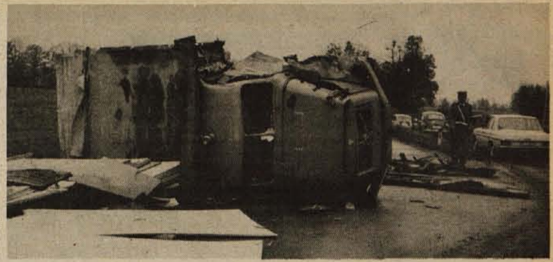
Več ur je bila v petek pri Lescah zaprta cesta, ker se je po trčenju dveh tovornjakov po cesti razlilo olje in kerozin.