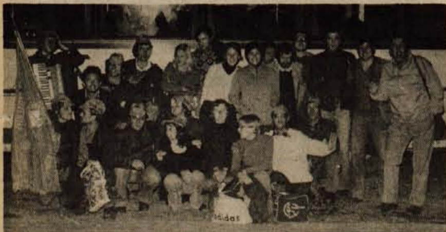
Osnovna organizacija ZSMS Planike je organizirala v nedeljo, 30. oktobra, delovno akcijo na potresnem območju v zgornjem Posočju. Na delovno akcijo so povabili tudi vse člane delovne organizacije. Avtobus je odpeljal iz Kranja ob 5.30, tako da so bili vsi udeleženci akcije že ob 7.30 pred štabom civilne zaščite v Tolmini. Na krajšem posvetu v štabu za odpravo posledic potresa smo izvedeli, da je dostop do vasi v Breginjskem kotu oviran zaradi naraslih voda. Ekipi Planike in Zelezarne Jesenice so zato poslali na izkop jarka za odvod in popravilo ceste do posameznih domačij, ki so posejane po strmih zobočjih v Logu nad Mostom na Soči. Do delovišča v Logu se ni dalo pripeljati z avtobusom, zato je bilo potrebno iti iz Mosta na Soči 2,5 km peš. Delo je bilo naporno, teren je bil precej skalnat. Udeleženci so z delom dokazali, da so to solidarnostno akcijo vzeli zelo resno. Akcija je poleg opravljenega dela pripomogla k spoznavanju dejanskih težav in problemov na potresnem območju v dneh pred zimo. Kljub izredno slabemu vremenu v soboto je bila udeležba prostovoljcev v nedeljo dokaj številna. Lepo vreme v nedeljo pa je omogočilo, da je delovna akcija v celoti uspela. - J. Kristan

Če torej ugotavljamo, da se mladina ne more zaradi omejenih možnosti vključevati po interesih v posamezna društva, bi bilo potrebno, da prav vsaka krajevna skupnost z vsemi organizacijami na svojem področju še posebej pa z ZSM (in vsemi številnimi mladinskimi komisijami) pregleda tudi druge možnosti koristne uporabe prostega časa za doraščajočo mladino: takšne »konkretne akcije« bi nasile veliko bolj kot pa besedičenje o nekoristno zapravljenem času, ki ga ima mladina. Treba je torej usmerjati; brezbržnost odraslih ni bila in ne bo nikoli sprejemljiva oblika ravnanja z mladimi. L. M.