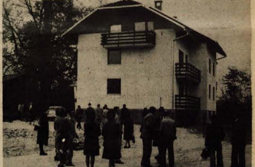
V Zapužah so v petek odprli dva stanovanjska bloka, zgrajena s sredstvi tovarne Sukno Zapuže in enote za družbeno pomoč pri samoupravni stanovanjski skupnosti Radovljica