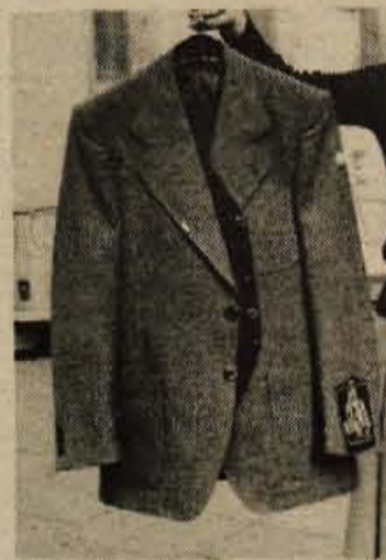
Zelo lepo obleko zanj, model ISLAND, smo videli pri ELITI v Kranju. Hlače in telovnik sta enobarvna, sukničje pa v drobnem, komaj zaznavnem karu. Dobi se v sivi in rjavi barvi. Material je 100% volna, obleko je pa izdelala MURA. Velikosti: od 46 do 54 in za visoke postave 88 do 112.