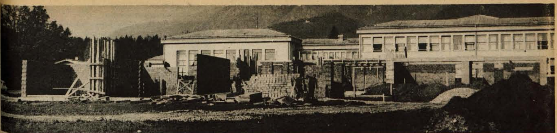
Preddvor se izredno hitro širi, zato so vedno večje tudi potrebe po organiziranem družbenem varstvu otrok. Težave pri otroškem varstvu bodo odstranjene z izgradnjo novega otroškega vrta, ki so ga začeli graditi pred osnovno šolo Matije Valjavca. Gradbena dela izvajajo delavci kranjskega Projekta, ki jim gre posel sorazmerno hitro od rok. (jk)

Leto XXIX. Številka 87 86 Ustanovitelji: občinske konference SZDL Jesenice, Kranj, Radovljica, Škofja Loka in Trzin - Izdaja ČP Glas Kranj. Glavni urednik Igor Slavec - Odgovorni ured- nik Albin Učakar