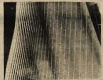
Kvalitetni črtašti batisti za bluze - črte se po zadnji modri postopno debelijo in prehajajo spet v gladko, kar daje pri krojenju možnost odličnih kombinacij črt in enobarvnega - se dobe v TEKSTILINDUSOVI prodajalni v hotelu CREINA v Kranju. Barve: rdeča, svetlo in temno modra.