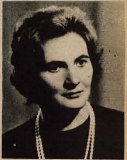
Pisateljica Mimi Malenšek (r. 1919)

Najbrž je v tem tudi del vnanje podobe Mimi Malenškove: skrbna urejenost, zadržana lepota in preudaren pogled na sočloveka. Kar vse je nekaka zemška osnova za njen bujen pripovedniški dar, za njeno čebeljo marljivost, za izjemen pogum pri izbiri snovi za svoja dela in za uspljivo zgodovinsko znanje.