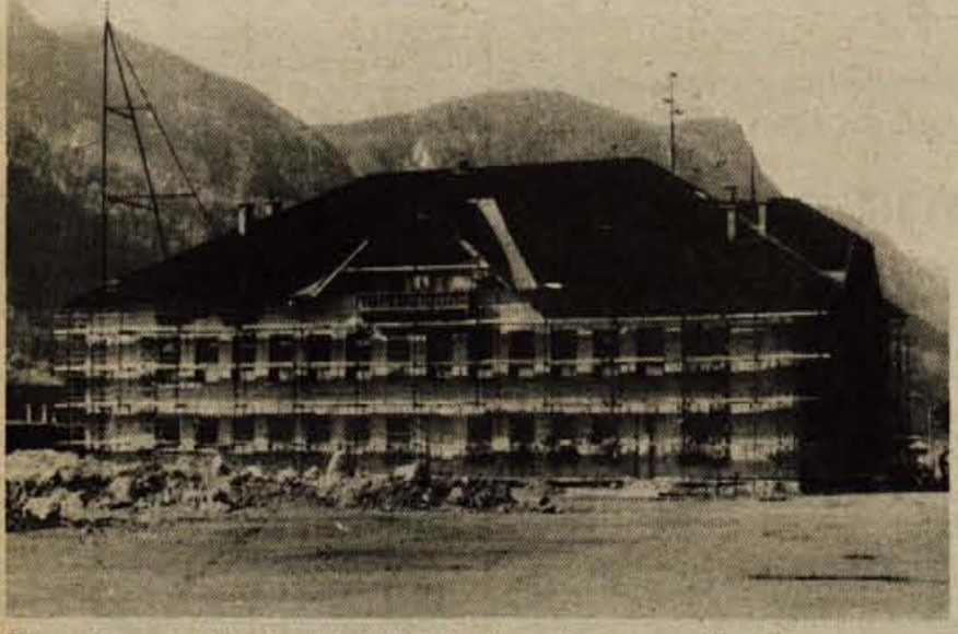
Titov dom na Jesenicah je bil dolgo časa kamen spotike občanov zaradi razpadajoče zunanosti. Sedaj so dom začeli obnavljati, in sicer bodo ugradili nova okna in vrata ter obnovili zunanje stene. Izvajalec del je Splošno gradbeno podjetje Projekt — enota Jesenice (jr)

Jesenice — Po informaciji Biroja za urbanizem in stanovanjsko poslovanje so dela pri gradnji novega toplovoda od jeseniške Železarne do Plavža nekoliko kasnila, vendar bo v teh dneh toplovod že začel obratovati. Zaradi objektivnih ovir pri gradnji so se dela pri toplovodu deloma tudi podražila. Prebivalci Plavža bodo tako poslej imeli ogrevana stanovanja, v samem mestu Jesenice pa bodo končana precejšnja gradbena dela, ki so zdaj deloma ovirala promet po magistralni cesti. D. S.