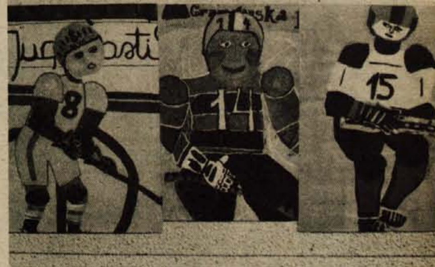
V okviru prikaza likovne dejavnosti šolskih otrok na Gorenjskem sodi pred kratkim odprta razstava likovne dejavnosti učencev osnovne šole Lucijana Seljaka Kranj, ki je na ogled v Galeriji Mestne hiše v Kranju. Razstava skuša predvsem prikazati del prizadevanj za čim enostavnejše in učinkovitejše reševanje problemov likovno estetske vzgoje na osnovni šoli. V izdelkih učencev 5. in 6. razreda se kaže predvsem osnovno znanje o likovnih elementih in odnosih med njimi; pravilno razumevanje le-teh pa mladega človeka postopoma navaja na uživanje »kulturnih dobrin«.