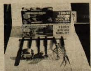
Prilagodljive kuhinjske garniture - 7 kosov na enem obesalniku - brez katerih gospodinja težko kuha, so dobili v Murkinem ELGU v Lescabu. Uvoz iz Anglije.