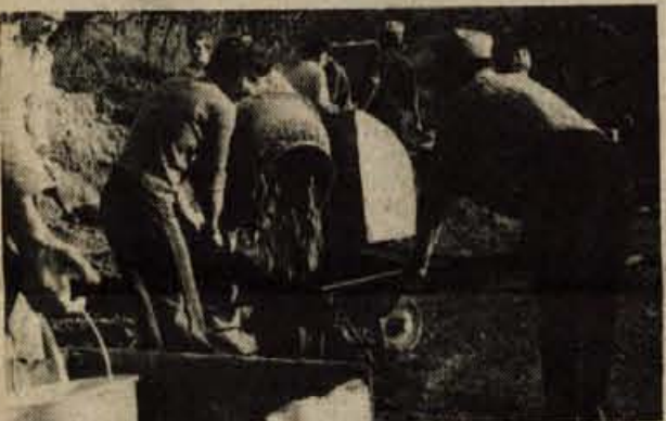
SKOFJA LOKA - Aktiv mladih zadržnikov pri kmetijski zadrugi v Skofji Loki uspešno deluje že peto leto. Njihov program dela je izredno pester. Tako vsako leto prirejajo v Poljanah tekmovanje košev in grabljic, udeležujejo pa se tudi podobnih tekmovanj na področju Gorenjske in tudi Slovenije. Velikokrat pa prirejajo razne strokovne ekskurzije. Mladi zadržniki s področja škofjeloške občine so v preteklih letih že obiskali svoje sovratnike v Švici, ČSSR, na Madžarskem in v Makedoniji. Slovenijo pa so prekrizirali domala že podolgem in počez. V goste pa so za tri dni sprejeli tudi mlade zadržnike iz Švice. Da bi se mladi med seboj še bolj povezali, da bi bilo delo v aktivu mladih zadržnikov še bolj živahno, so se na četrti redni letni konferenci aktivna mlada dogovorili tudi o medsebojni pomoči. Tu je mišljena predvsem pomoč pri raznih večjih delih, predvsem seveda pri gradnji in obnovi gospodarskih poslopij, in raznih elementarnih nesrečah. Doslej sta bila deležna pomoči že dva člana aktivna. To sta Marko Potočnik z Bukovice in Izidor Vidmar iz Bukovčice v Selski dolini. Betoniranja plošče na novem hlevu na Vidmarjevi domačiji se je udeležilo kar 11 članov aktivna mladih zadržnikov. Akcije so se udeležili predvsem fantje iz Poljanke doline, s področja Skofje Loke in okolice pa odziva skorajda ni bilo. Izidor je bil fantom seveda zelo hvaležen, saj bi v vasici, kjer so hiše precej oddaljene druga od druge, le težko dobil zadostno število delavcev. V novem hlevu na Vidmarjevi domačiji bo prostora za 25 glav živine in še za večje število telet. Mladi zadržniki so se po končanem delu že dogovorili za nove akcije. Seveda se Izidor svojim sovratnikom nikakor ni pozabil zahvaliti za pomoč. (F. N.)

RADOVLJICA - Kot smo že pisali, v novih naseljih pod Volejim hribom in na Gradnikovi cesti v krajevni skupnosti Radvoljica poteka akcija za nove telefonske priključke. Do konca oktobra je bilo s tega področja za telefone že prek 300 prijav. Po dogovoru naj bi novi naročniki v blokih v treh obrobkih plačali 3500 dinarjev, v zasebnih stanovanjskih hišah pa 5000 dinarjev. V krajevni skupnosti pričakujejo, da bo prijav še več, pogovarjajo pa se tudi s PTT podjetjem o prispevku, ki njim bi ga plačala krajevna skupnost za tako imenovano sekundarno omrežje. Ker kaže, da bodo nekaj sredstev prispevali tudi delovne organizacije na tem območju, upajo, da se bodo dela začela še ta mesec. JR