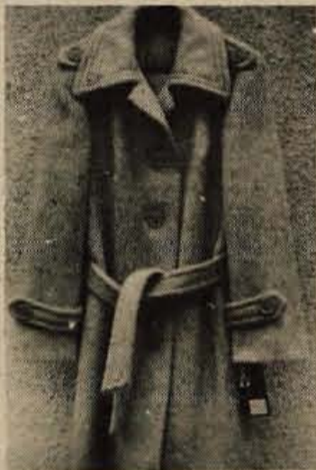
Za mrzle dni bo prav prišla malo daljša jakna iz toplega moherja. V svetlo sivih barvah se dobe v Murkini MODI v Radovljici.