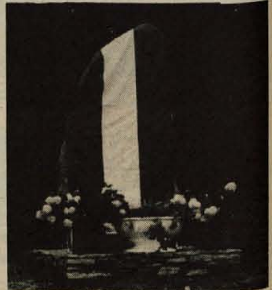
Spomenik padlim borcem Domovne čete na Komelju pred odkritjem 28. maja 1972.