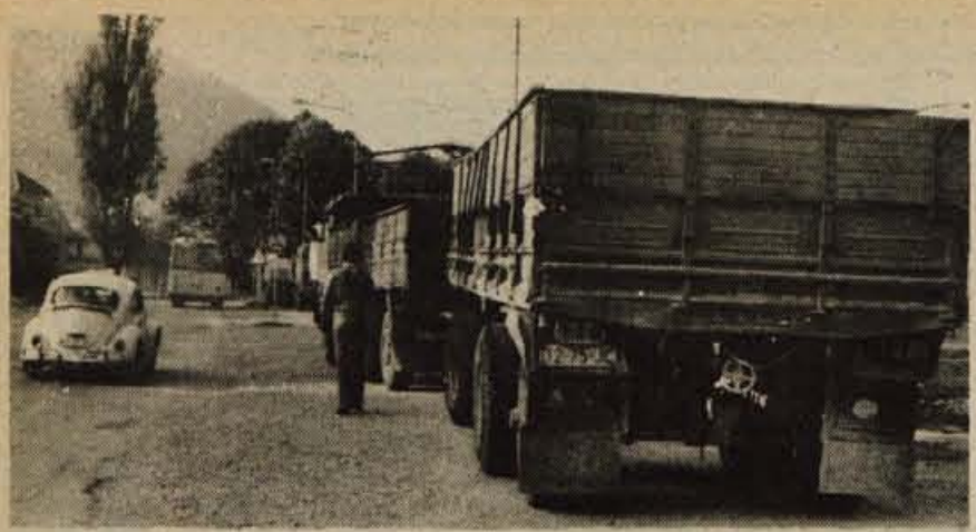
Parkirni prostor za tovornjake na Laborah v Kranju ob magistralni cesti Jesenice-Ljubljana že nekaj let nazaj sodi v okvir kranjskih prometnih problemov, saj je prostor neustrezen: tovornjaki s priklopniki namreč onemogočajo preglednost pri vključevanju na magistravno cesto, zapirajo pot pešcem, ob prometnih konicah pa vozila tvorijo pravi prometni vozel in nevarnost za pešce. V Kranju zato že nekaj časa razmišljajo o primernejših parkirnih prostorih tako za tovornjake kot tudi za osebna vozila, vendar pa za sedaj odločitve še ni. — L. M.