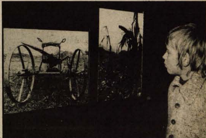
V galeriji Prešernove hiše v Kranju je do 11. novembra odprta razstava fotografij s Koroške z naslovom Sonce skrilo je obraz avtorja Marka Aljančiča.