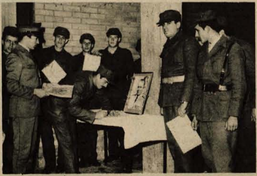
SVEČANA PRISEGA VOJAKOV V KRANJU - V soboto, 30. oktobra, je bila tudi v vojašnici Staneta Žagarja v Kranju slovesna prisega vojakov. Slovesnemu trenutku so prisostvovali razen starešin Jugoslovanske ljudske armade in starejših vojakov tudi predstavniki družbenopolitičnega življenja kranjske občine. (jk)

V iskanju odgovora na ta in druga vprašanja o usmerjenem izobraževanju bo študija torej lahko veliko pomagala. Razen tega pa bo razprava na Gorenjskem pripomogla tudi k izoblikovanju rešitev in zasnove usmerjenega izobraževanja v Sloveniji.