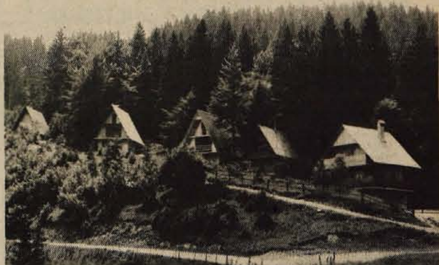
V radovljiški občini niso nestrni zaradi gradenj počitniških hišic nasploh, ne morejo pa dovoliti divjih oz. neorganiziranih gradenj.

Kot rečeno, gre za osnutek odloka, ki ga je izvršni svet že sprejel, predlaga pa, da ga delegati obravnavajo in dajo pripombe nanj. Dokončno bi sklepali o njem na eni prihodnji seji, veljati pa naj bi začel 1. januarja prihodnje leto.