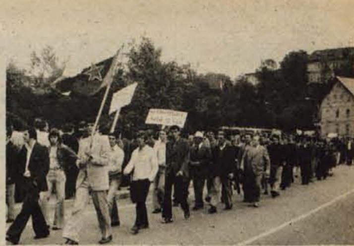
Ze precej pred začetkom proslave ob 40-letnici velikih stavk tekstilnih in gradbenih delavcev Slovenije, ki je bila v soboto ob 11. uri v Savskem logu v Kranju, so delavci, mladina, udeleženci stavk pred 40 leti in drugi občani prihajali na prireditveni prostor.