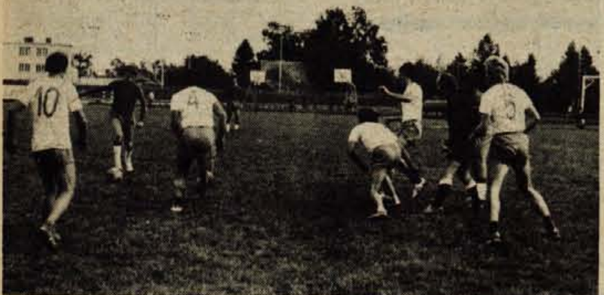
Na letnih športnih igrah gradincev ŠIG '76 so nastopile tudi štiri najboljše nogometne ekipe iz predtekmovanj. V izenačenih igrah je prvo mesto osvojilo moštvo Cementarne iz Trbovelj. Ta ekipa pa bo Slovenijo zastopala tudi na zveznih igrah gradincev, ki bodo od 30. septembra do 2. oktobra v Šibeniku.

orodjarji: 1. Gradis, 2. Projekt, 2. Primorje. Besedilo: D. Humer.