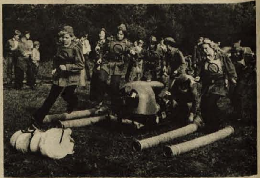
Na nedeljskem tekmovanju gasilk iz občine Kranj so največ znanja in spretnosti pokazale članice gasilske desetine s Kokrice (na fotografiji med vaj)