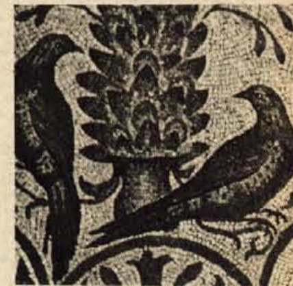
Del mozaike v oglejski baziliki

Ogleda vreden je tudi oglejski arheološki muzej. Toliko lepote na enem mestu še nisem videl. Toliko umetnin iz zlata, srebra in žlahtnih kamnov. Toliko mitoloških podob in plastik. Marmor in slonova kost. Zlatarska in pasarska umetna obrt. Pa še prostoren lapidarij (muzej na prostem) z večjimi spomeniški plastikami. Če je že čedadski arheološki muzej tako bogat, je ta, oglejski naravnost razkošen. Tam mnogo langobardskega, tu predvsem antika. Kar verjeti ni mogoče, da se v Ogleju, tem majhnem, pozabljenem kraju, krije toliko zgodovinske lepote.