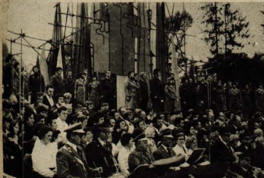
Kulturni spored so izvajali združeni pevski zbori, mešani pevski zbori, Godba mlince iz Ljubljane in Delavska godba iz Trbovelj ter člani gledališkega centra in Prešernovega gledališča iz Kranja.

IX. MEDNARODNI SEJEM OPREME V KRANJU OD 12. DO 19. 10. 1976