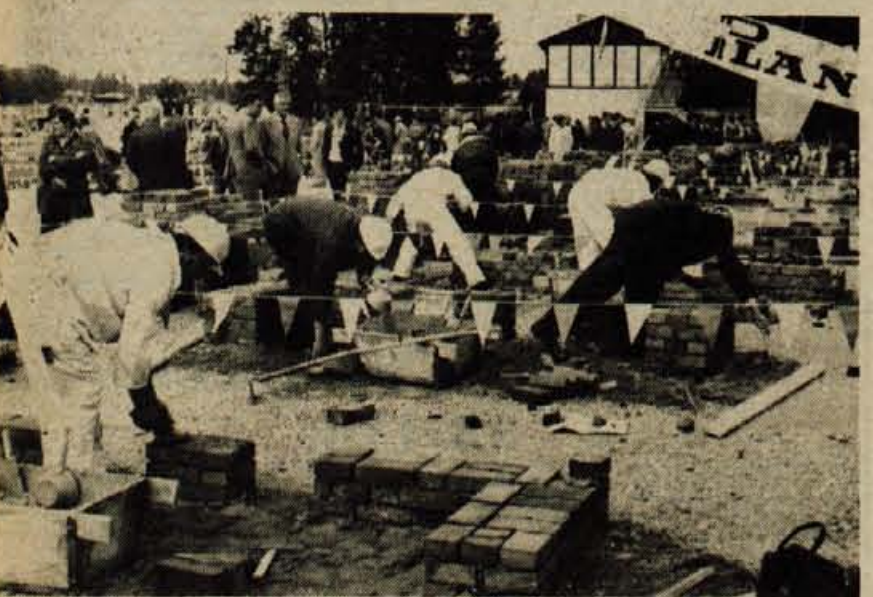
V okviru športnih iger gradincev na finalnem delu v Kranju so svoje tekmovalne sposobnosti pokazali tudi delavci iz proizvodnje. Na stadionu Stanka Mlakarja so svojo delavno sposobnost pokazali zidarji, opažarji, železokrivci in orodjarji.