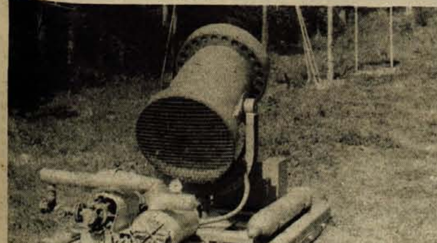
Na Kresu imajo tudi top za sneg.