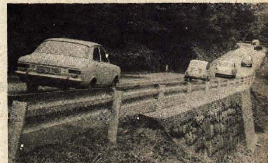
Obilno deževje je sredi avgusta močno poškodovalo odsek ceste pri Hrušici zato so delavci Cestnega podjetja Kranj na kraju, kjer se je porušilo kamenje zgradili nov trdnjejši betonski oporni zid. V času popravila je bil na tem odseku enosmerni promet.

ZELEZARJI VPISUJEJO POSOJILO V jeseniški Železarni je vpisalo posojilo za ceste 5500 zaposlenih ali 87 odstotkov vseh zaposlenih v Železarni. Skupaj so železarji vpisali 9 milijonov 198.000 dinarjev posojila za ceste. Najboljši vpis beležijo v Železarni delavci delovne skupnosti skupnih služb, za njimi so delavci temeljne organizacije združenega dela Talilnice, sledijo pa jim delavci, zaposleni v temeljni organizaciji vzdrževanje, energija in transport.