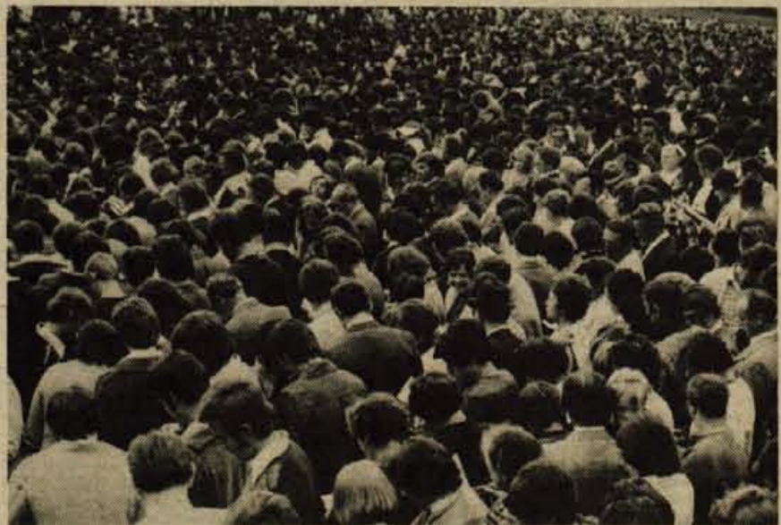
Na srečo in dobiček je računalo več kot deset tisoč ljudi...