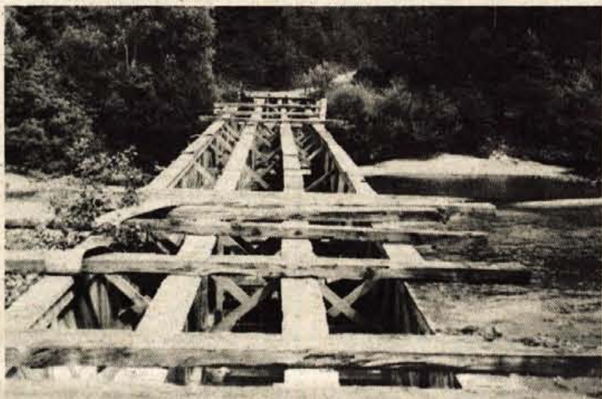
Most v Piškovci, ki povezuje oba bregova Save med Zasipom in Žirovnico, je že več kot dobro leto neprevozen za vsa vozila. Sliši se, da bo iz Žirovnice v Zasip zgrajena nova cesta in da bo takrat zgrajen tudi nov most čez Savo. Kdaj bo to, ne ve nihče. Morda pa ne bi bilo napak, da bi vsaj most obnovili. - J. Ambrožič

mere na domačem in tujem trgu. Pri cenah kaže biti preudaren, sicer se utegnejo ponoviti težave preteklih let. Za zdaj je znano, naj bi pridelovalec dobil za kilogram krompirja okrog 3,50 dinarja. -jk