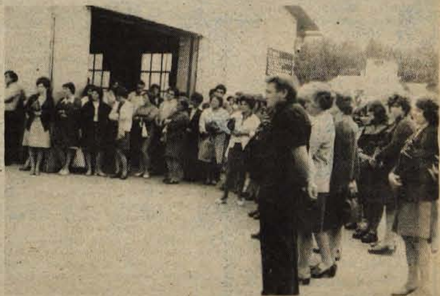
Dogodke na Koroškem in protimanjšinsko politiko avstrijske vlade so ostro obsodili tudi delavci Iskre Reteče.

Dogodke na Koroškem so obsodili tudi delavci Kovinoservisa z Jesenic, ki prav tako zahtevajo, da vprašanje slovenske in hrvatske narodnostne skupnosti na Koroškem obravnava generalna skupščina OZN. Protestom zaradi avstrijske politike na Koroškem in ravnanja žandarmerije v Skoecjanu so se pridružili tudi delavci Termike iz Skofje Loke in zahtevajo, da Avstrija izpolni svoje obveznosti in zagotovi pogoje za življenje Slovencev na Koroškem. L. B.