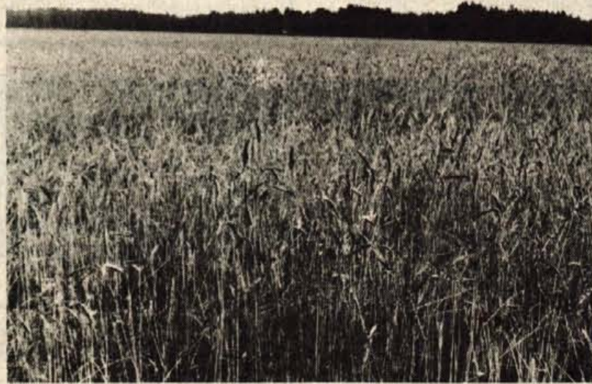
KŽK GOJI RŽ ZA LJUBLJANSKI LEK - Rž je ena od najredkejših žitaric, ki jo še sejejo na Gorenjskem. Zemljišče Kmetijskoživilskega kombinata iz Kranja ob cesti proti Senčurju je izjema. Na njem je posejana rž, ki jo bo odkupilo ljubljansko podjetje LĚK in jo uporabilo za izdelavo zdravil in drugih izdelkov. KŽK in LĚK sta pogodbo o pridelovanju rži sklenila letos. Na Kmetijskoživilskem kombinatu v Kranju povedo, da je pridelovanje rži v sodelovanju z Lekom rentabilno, kar pri gojenju žitaric v druge namene na Gorenjskem ni slučaj. (jk)