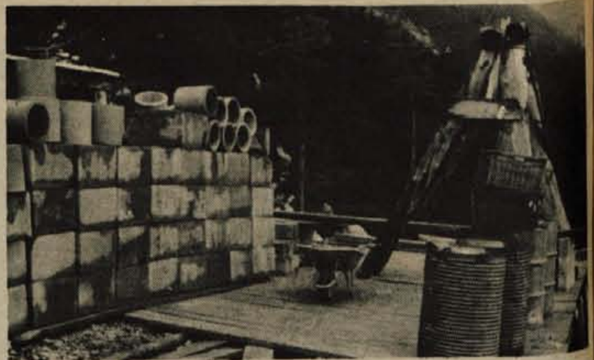
Z gradbišča Kranjskega planinskega doma na Ledinah nad Jezerskim

V četrtek ob 12. uri bo v Škofji Loki seja koordinacijske komisije za stanovanjsko politiko v občini. Člani komisije bodo obravnavali predlog o združevanju sredstev za stanovanjsko gradnjo, poslušali informacijo o ceni za kvadratni meter stanovanjske površine v novih stolpnih v Podlubniku ter spregovorili o sedanjem doseganju plana pri gradnji stanovanj v škofjeloški občini. -jg