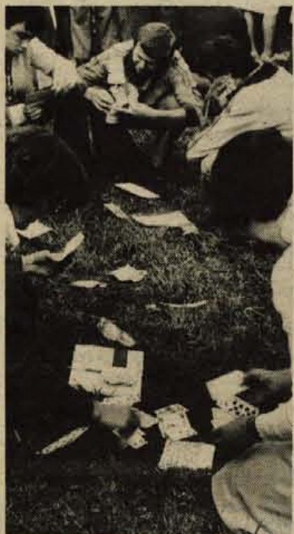
Dolgčas pa tak... Raje vzimmo karte.

Celo prireditelji niso računali na tako velik obisk. Čeprav so natisnili kar 16.500 tablic, jih je že pred drugo uro, ko je bil napovedan