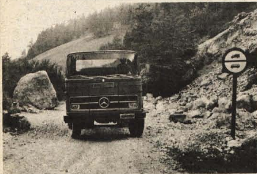
Cesta s Sorice proti Petrovem brdu je zelo slaba. Zdaj je celo neprevozna.