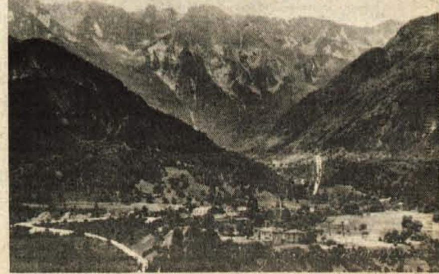
Dolina Rezijske (v osrednjem delu Njive)