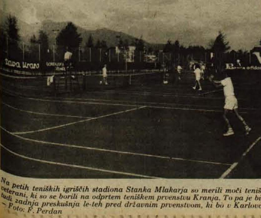
Na petih teniških igriščih stadiona Stanka Mlakarja so merili moči teniški veterani, ki so se borili na odprtem teniškem prvenstvu Kranja. To pa je bila tudi zadnja preskušnja le-teh pred državnim prvenstvom, ki bo v Karlovcu.