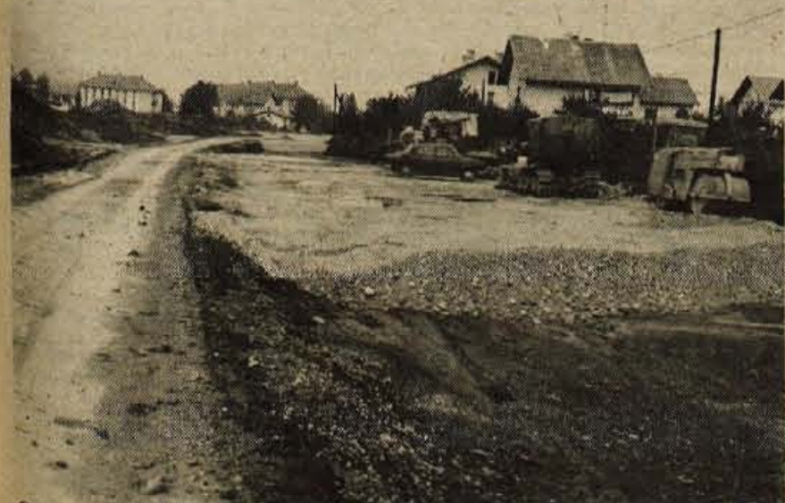
Cestno podjetje Kranj in Gradbeno podjetje Trzin razširjata Cesto talcev proti kranjskem pokopališču. Razširitev ceste, ki bo imela tudi podhod za pešce, sodi v program ureditve novega stanovanjskega naselja na Planini v Kranju. Investitor teh del je podjetje Dom plan Kranj. Rok za dokončanje del na cesti je 1. november letos. — A. Ž.