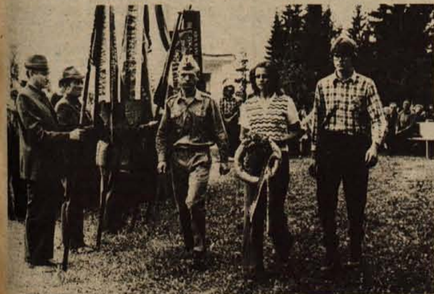
K spominskemu obeležju Cankarjevega bataljona so predstavniki žirovniške mladine in pripadniki JLA odnesli venec...