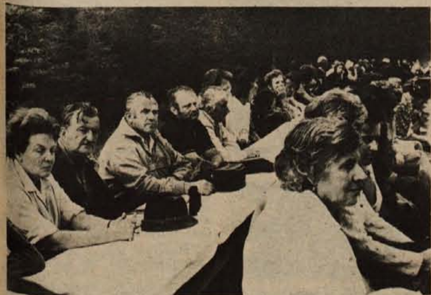
Proslave so se udeležili občani jeseniške in radovljiške občine...