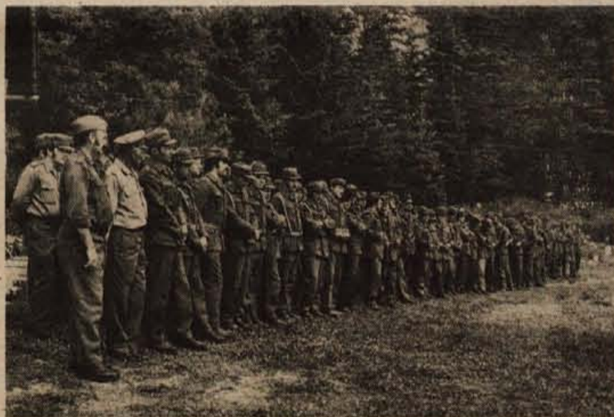
Na proslavi pod Stolom so sodelovali tudi pripadniki teritorialnih enot jeseniške občine.