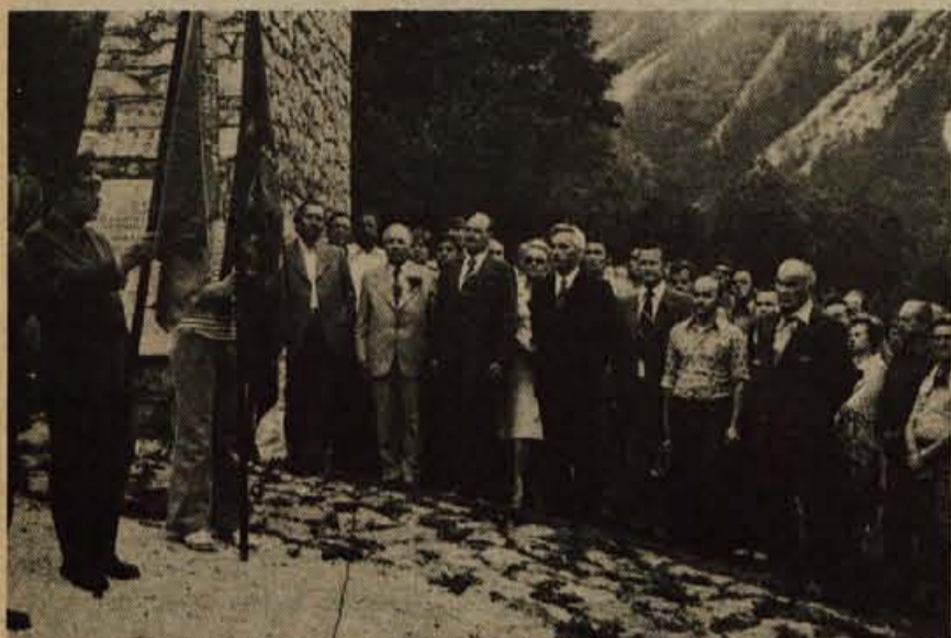
Gostje in gostitelji so se takoj po prihodu na Ljubelj ustavili pri spomeniku v Podljublju in se poklonili vsem trpečim in umrlim v ljubeljskem taborišču in vseh taboriščih sveta.

Včeraj so se od Tržičanov poslovili gostje iz pobratenega alzaškega mesta Ste Marie aux Mines, ki so sodelovali na prireditvah v počastitev 10. obletnice pobratenja med obema mestoma