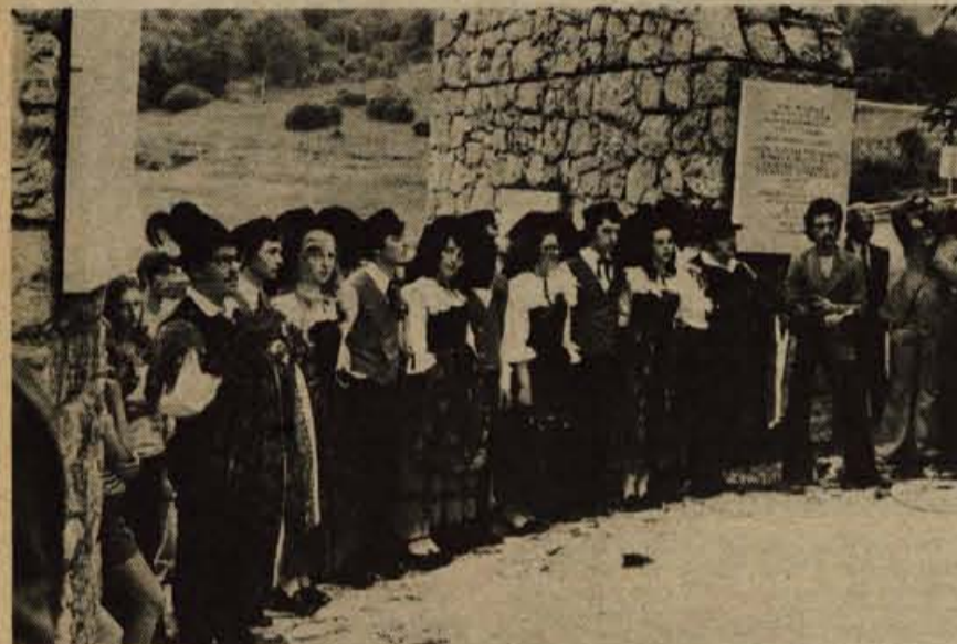
Iz pobratenega mesta so prispeli v Tržič tudi člani folklorne skupine (na fotografiji), telovadci in harmonikarski ansambel. Njihovi koncerti in nastopi so bili dobro obiskani in so sodili tudi k proslavljanju 10. obletnice folklorne skupine Karavanke iz Tržiča.