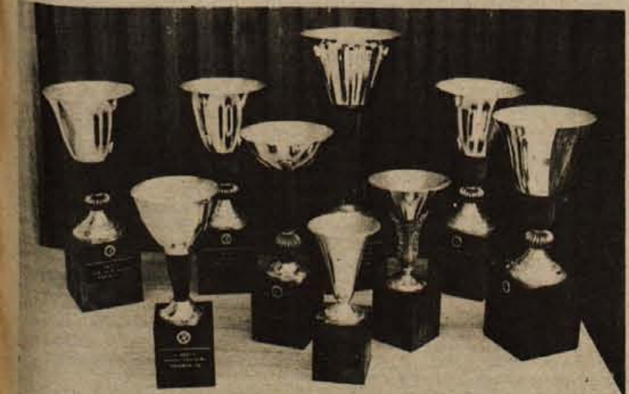
Združenje samostojnih obrtnikov kranjske občine se je že prvo leto po ustanovitvi vključilo in tudi samo organiziralo različne oblike športne in rekreativne dejavnosti. Tudi na tem področju so dosegli lepe uspehe. Največji uspeh pa so zabeležili na drugih športnih igrah v Mariboru, kjer so se pomerili člani združenj iz vse Slovenije v plavanju, streljanju, kegljanju, namiznem tenisu, malem nogometu, atletiki, vlečenju vrvi in šahu. 63 članov kranjskega združenja je na tem srečanju v skupni uvrstitvi osvojilo drugo mesto in sedem pokalov. Na sliki odličja, ki so jih osvojili v enem letu.