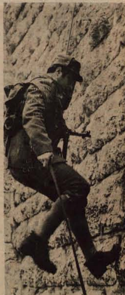
Po proslavi ob spomeniku talcev s pripadniki teritorialnih enot prikazali napad na železniški most v Mostah tako, kot je diverzantska akcija gorenjskega odreda leta 1942 tudi potekala.