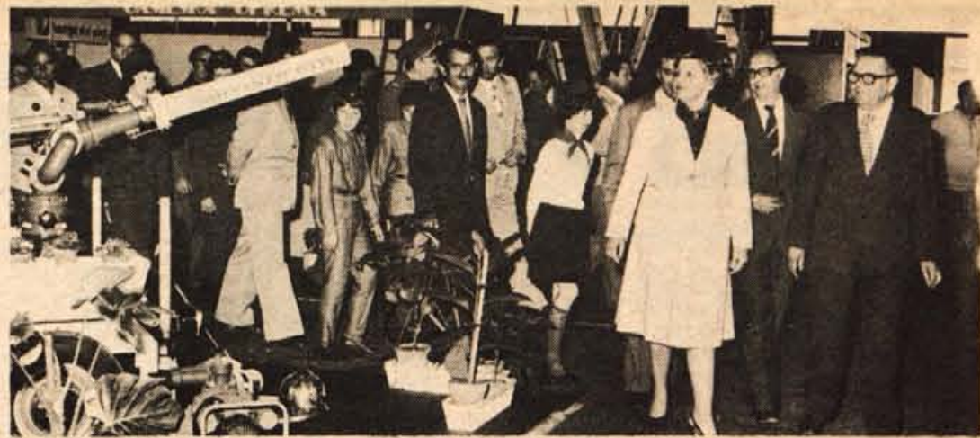
Četrty sejem sredstev in opreme civilne zaščite v Kranju je v torek, 1. junija, odprla članica zveznega izvršnega sveta in predsednica komiteja za zdravstvo in socialno politiko Zora Tomić.