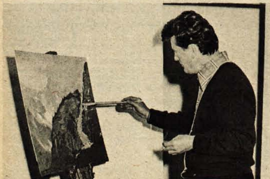
Korošček planinski motiv v zadnji korekturi ...