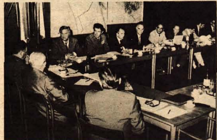
V okviru sejma je v torek zasedal v Kranju tudi zvezni svet za civilno zaščito. Razpravljali so o opremljenosti civilne zaščite in o predlogih za izbor in porenjenje ustrezne opreme. Ugotovili so tudi, da je opremljenost enot civilne zaščite iz leta v leto boljša, vendar to ni posledica načrtnih akcij, marveč bolj posameznih pobud. Zato bi bilo treba v prihodnje posvetiti večjo skrb znanstveno raziskovalnemu delu in razvijanju proizvodne opreme. Prav to pa bi bilo treba upoštevati tudi v srednjeročnih razvojnih programih civilne zaščite do 1980. leta. — A. Ž.