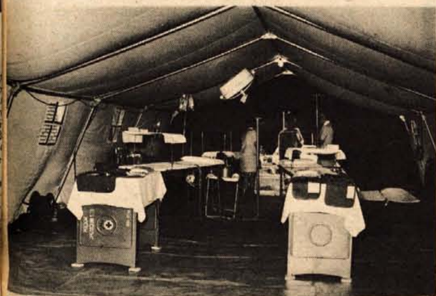
Republiški komite za zdravstvo in ljubljanski Klinični center sta na razstavi postavila opremljeno poljsko bolnico za delo v izrednih pogojih. Sotori so proizvod podjetja Induplati Jarše, v posameznih šotorih pa so prikazani operacijska soba in instrumenti ter naprave za ambulantno zdravljenje ranjencev v izrednih pogojih.

GLASILO SOCIALISTIČNE ZVEZE DELOVNEGA LJUDSTVA ZA GORENJSKO