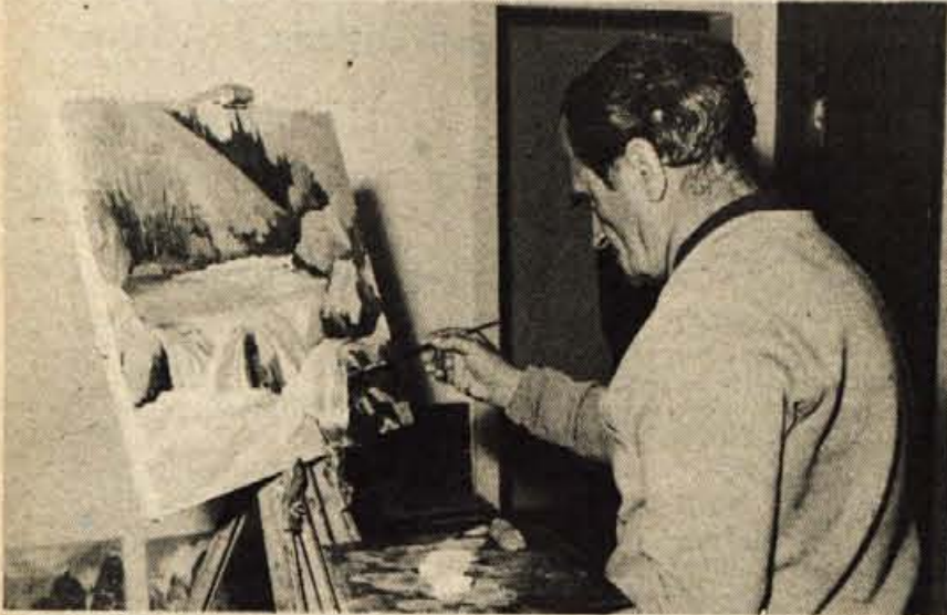
Soča, bistra hči planin, v pogledu slikarja iz Ljubljane ...

Spet je zvalila vršička narava, med svoje vršace in zelenje je zvalila slikarje-krajinarje, zveste svoji osnovni slikarski usmeritvi. V Trentu jih je vabilo prebujajoče se jutro, na Vršiču obsijalo poslavljajoče se sonce, med štiri stene tople koče prisililo deževno in sneženo vreme. Tedaj, ko narava ni dopustila nikakršnega občudujočega razgleda in pregleda, ko je dež in viharji metež zapiral vrata in okna, so se zbrali ob svojih platnih: da izmenjajo izkušnje, da se pogovore, da dokončajo svoje zamisli.