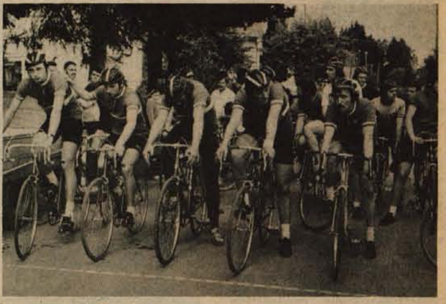
Start članov veteranov