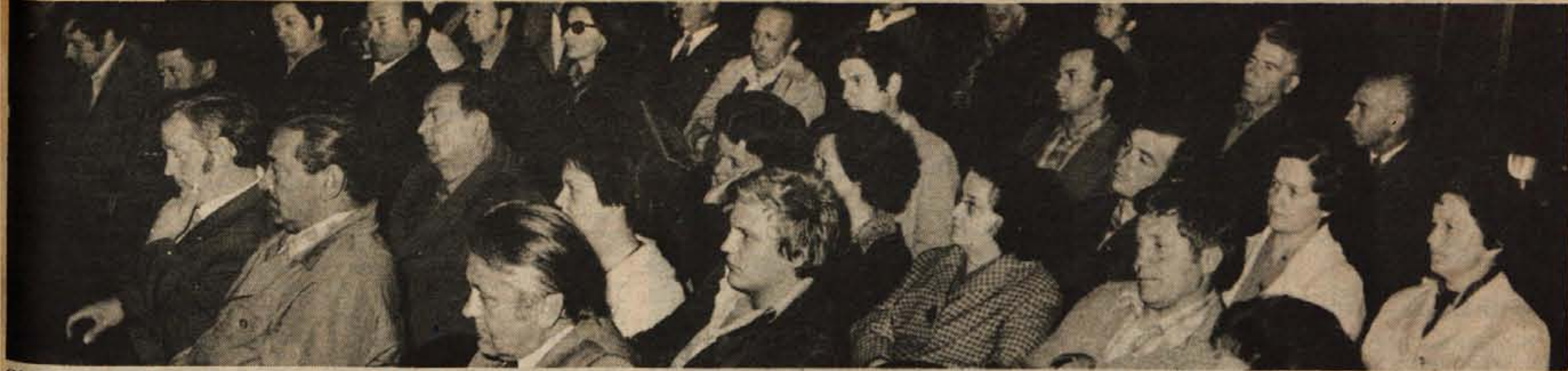
GLAS NA KOKRICI — Tako kot smo napovedali, smo člani uredništva Glasa v petek, 14. maja, obiskali krajevno skupnost Kokrica. Tako prebivalci kot predstavniki družbenopolitičnih organizacij in krajevne skupnosti so nam med obiskom in srečanjem v kulturnem domu Franca Mraka povedali veliko zanimivega. Vse smo zabeležili in bomo pogovore tudi objavili. — A. Ž.