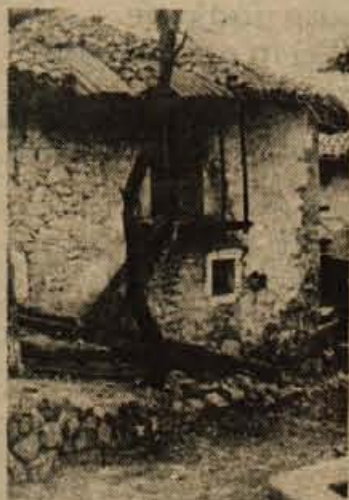
Zdaj zdaj se utegne zrušiti (dobro je vidna struktura kamnitega zidu - opoka je draga, kamna pa je za dosti).

Spričo potresa, ki je prizadel tudi del Slovenske Benečije, moram tok pogovora prekiniti in se posvetiti še enkrat krajem, ki sem jih z bralci že prepotoval.