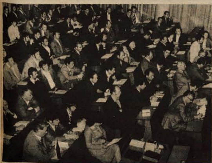
GOZDARSKI ŠTUDIJSKI DNEVI V KRANJU — Pretekli četrtek in petek, 13. in 14. maja, so bili v Kranju »Gozdarski študijski dnevi«, ki jih je organizirala Biotehniška fakulteta v Ljubljani, TOZD Gozdarski oddelek. Tema zanimivega znanstvenega srečanja je bilo gospodarjenje z zasebnimi gozdovi v SR Sloveniji. Študijski dnevi so sodili v sklop letošnjih prizadevanj za temeljito obravnavo slovenskega gozdarstva, ki jo vodi predvsem republiški sekretariat za kmetijstvo, gozdarstvo in prehrano. Znano je, da v Sloveniji zasebni gozdovi prevladujejo, vendar njihove proizvodne možnosti niso izkoriščene. Prav tako tudi tehnologija in sodobni znanstveni dosežki še ne prihajajo do polne veljave. Četrtekove otvoritve »Gozdarskih študijskih dni«, ki so bili že deveti po vrsti, so se udeležili tudi predsednik kranjske občinske skupščine Tone Volčič, dekan Biotehniške fakultete prof. dr. Andrej Martinčič, predsednik Zadruga zveze Slovenije Andrej Petelin, predstavnik sekretariata za kmetijstvo in gozdarstvo, nekateri zasebni gozdni proizvajalci in študentje gozdarskega oddelka Biotehniške fakultete. Na dvodnevnem posvetovanju so sodelovali nekateri znani gozdarski strokovnjaki kot dr. Izток Winkler, dr. Franc Gašperšič, dr. Amer Krivec, inž. Metod Vizjak in inž. Branko Korber. (jk)

GLASILO SOCIALISTIČNE ZVEZE DELOVNEGA LJUDSTVA ZA GORENJSKO