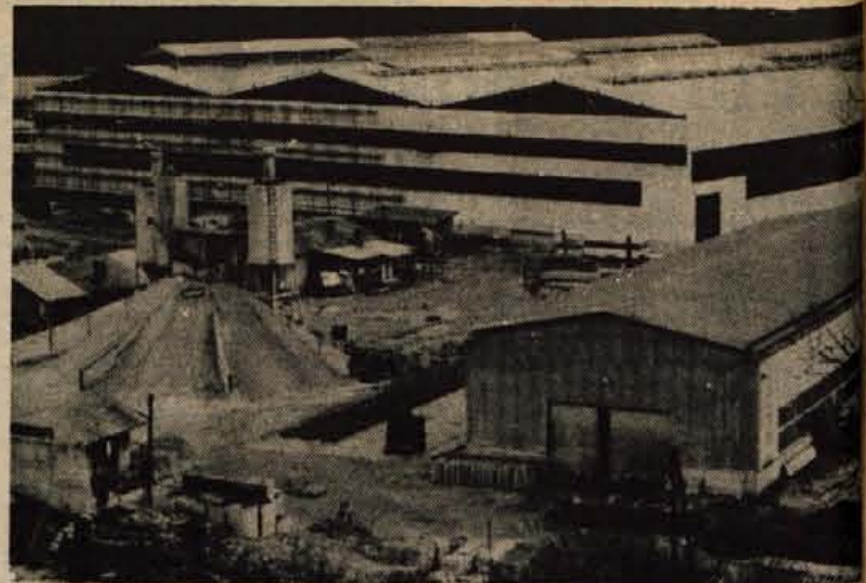
Delavci Metalne Maribor delajo na plavškem travniku na Jesenicah novo skladišče za trgovsko podjetje Universal Jesenice.

Dosedanji podatki kažejo, da je med štipendisti solidarnostnega sklada v občini največ srednješolcev. Zato so na konferenci predlagali, da bi pri podeljevanju tovrstnih štipendij morale povedati svoje mnenje tudi družbenopolitične organizacije, krajevne skupnosti, šole in tudi strokovne službe poklicnega usmerjanja. Takšno sodelovanje in usklajeno delo bi namreč lahko veliko pripomoglo k čimbolj pravilnim odločit-