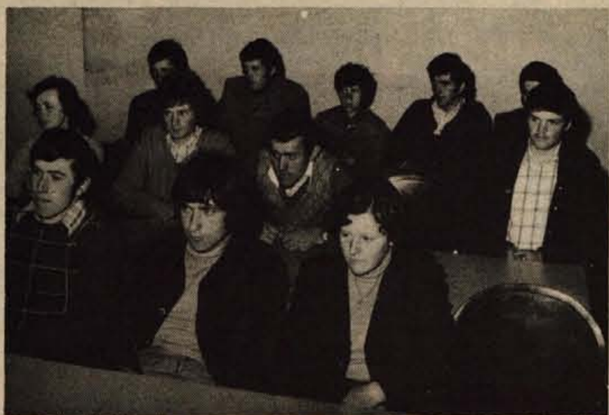
Poročila o delu mladih zadrušnikov iz »sosednjih« aktivov so pritegnila precej pozornosti. Kako bi jo ne, ko konferenca, ki naj bi vsklajevala, povezovala in koordinirala dejavnost temeljnih enot, ni delovala. - (gb)

S slavnostno akademijo, ki je bila v soboto zvečer v zagrebški koncertni dvorani Vatroslav Lisinski in katere pokrovitelj je bil predsednik republike Josip Broz Tito, so proslavili 50-letnico jugoslovanske radiotelevizije. Navzoči so bili najvišji voditelji iz vseh naših republik in avtonomnih pokrajin, predstavniki jugoslovanskih radiotelevizijskih studijev ter predstavniki inozemskih radijskih in TV postaj.