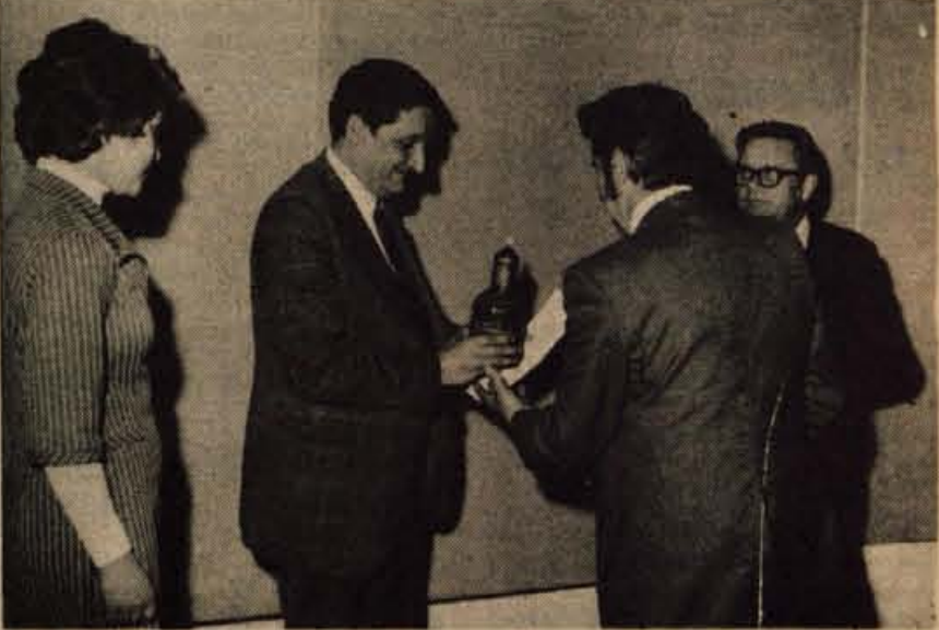
V petek, 14. maja, so v Kranju zaprli prvi mednarodni sejem malega gospodarstva, na katerem je na več kot 3000 kvadratnih metrih razstavljalo prelosto različnih razstavljavcev; med njimi tudi iz tujine. Zanimiva na sejmu je bila tudi razstava gorenjskih poklicnih šol oziroma šolskih centrov, prece obiskovalcev pa je privabila tudi modna revija, v kateri je prikazalo model za pomlad in poletje okrog 30 podjetij.

ponedeljek, torek od 12. do 18. ure sreda od 6.30 do 18. ure četrtek, petek od 6.30 do 12. ure