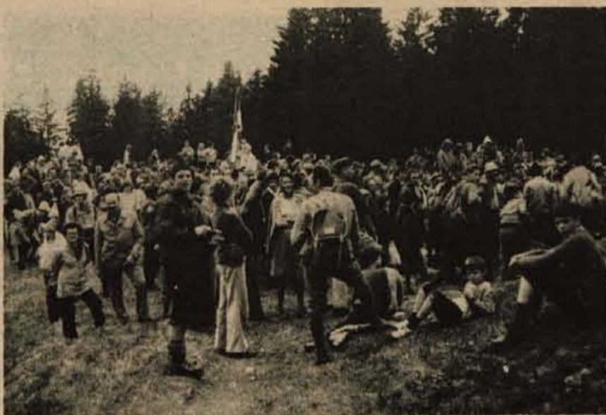
Nedeljskega slavlja na Blegošu, posvečena je bilo 31-letnici osvoboditve, se je udeležilo prek 1000 planincev

Projektivno podjetje Kranj, 61000 Kranj - Cesta JLA 6 - v ovojnici z oznako "za razpisno komisijo"