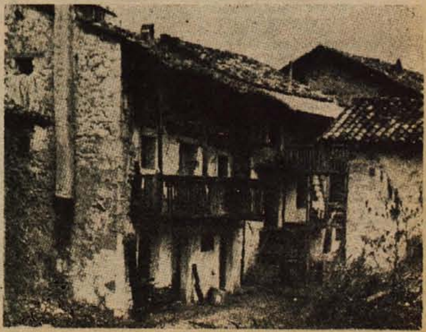
V strahu se tišče, druga k drugi, te uboge kamnite hiše pod Matajurjem.