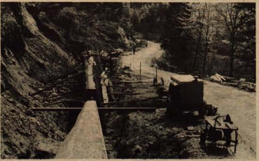
Na odseku bohinske ceste, ki so ga že lani začeli urejati in obnavljati in je potem dela prekinila zima, v teh dneh pospešeno nadaljujejo z obnovo. Gradnja opornih zidov in druga zahtevna zemeljska dela za zdaj še potekajo po programu. Če ne bo večjih nepredvidenih težav in vremenskih neprilic, bodo glavna dela opravljena do začetka glavne turistične sezone. Na odseku ceste, kjer potekajo dela, je sicer delna zapora za promet, vendar se le-ta odvija brez posebnih težav. - A. Z.

Skratka članek je bil prvomajski šok, ki ni izostal brez posledic.