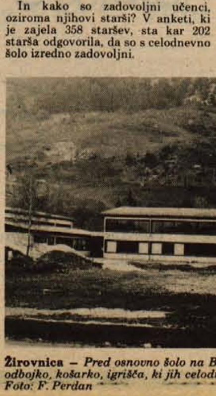
Žirovnica - Pred osnovno šolo na Breznici bodo uredili igrišča za atletiko, odbojko, košarko, igrišča, ki jih celodnevna osnovna šola nujno potrebuje.

Žirovniška osnovna šola je bila v letošnjem šolskem letu ena izmed šestih osnovnih šol v Sloveniji, ki je prav z vsemi oddelki prešla na celodnevni pouk. Nemalo zaslug pri pripravi ima krajevna konferenca Socialistične zveze, predvsem pa njen koordinacijski odbor, ki je ob enem s svojo uspešno akcijo za samoprispevek izredno delavno načrtoval tudi celodnevni pouk na šoli s 358 učenci v 15 oddelkih. V razredih je le od 19 do 31 učencev, ki so z dograditvijo telovadnice in adaptacijo šole prešli na enozimski pouk in pozneje na celodnevni pouk. Učenci se hranijo v šoli in le s prehrano imajo nekaj težav, saj bi radi jedilnico ustrezno razširili, sicer pa so izredno zadovoljni predvsem z organizacijo interesnih dejavnosti in samostojnega dela učencev. Na šoli deluje kulturna skupina, telesna kulturna skupina ter skupine, ki se povezujejo s poukom, ob enem pa navezujejo tesnejše stike z organizacijami in društvi v krajevni skupnosti. Predvsem pa si žele urediti okolico šole: dvorišče so že delno asfaltirali, šolsko igrišče je v gradnji in na njem bodo igrali rokomet, odbojko, košarko in vadili atletiko.