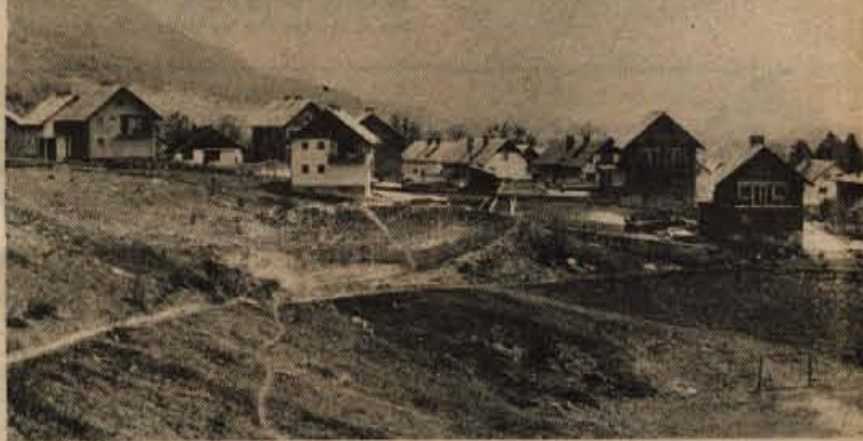
Nad Rodinami raste novo naselje zasebnih stanovanjskih hiš.