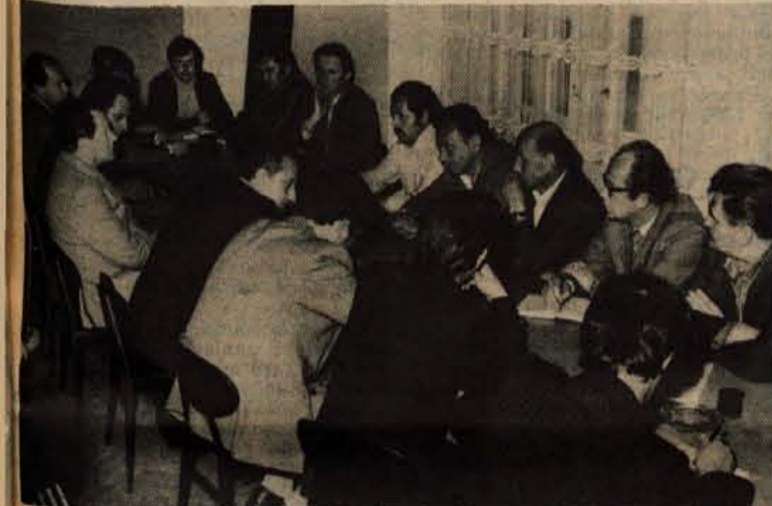
Pogovora o informiranju v krajevnih skupnostih so se udeležili predstavniki petih krajevnih skupnosti s področja škofjeloške občine.