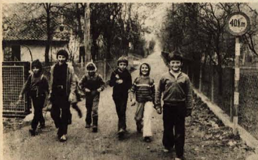
Slaba makadamska cesta na Bregu nujno terja asfaltno prevleko. Boljšo cesto bi radi starejši vaščani, medtem ko je mladim danes še vseeno, kakšen je prostor, njim namenjen za igro in mladostne radosti.