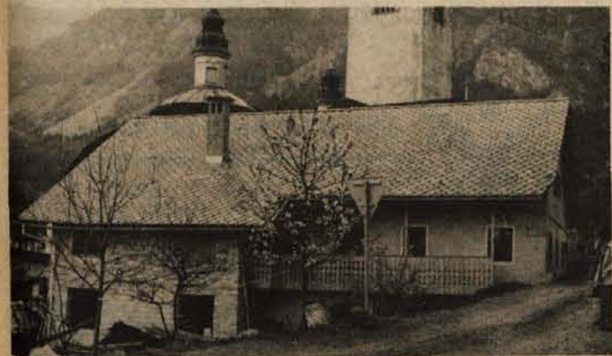
Spomeniška plošča na domačiji pisatelja Ivana Jalna na Rodinah spominja obiskovalce na pisatelja, ki je znal v svojih povestih izredno lepo opisati lepote svojega kraja v dolini pod Stolom.