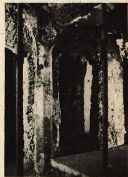
Kuhinja iz poznogotske dobe v Prešernovi ulici.