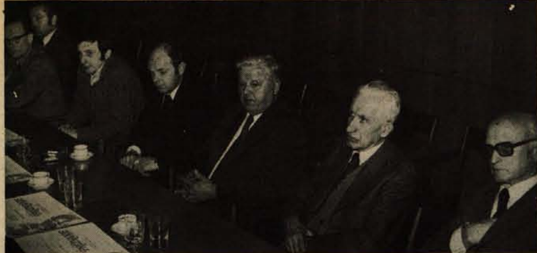
Pretekli ponedeljek so v Kranju slovesno praznili 30. obletnico delovanja Planinskega društva Kranj v svobodi, ki združuje že več kot 3000 članov in je med najmožnejšimi organizacijami v občini. Ob tej priložnosti so najzaslužnejšim za razvoj planinstva podelili posebna priznanja. Letos bosta slavila 30-letnico tudi GRS in alpinistični odsek. (jk)