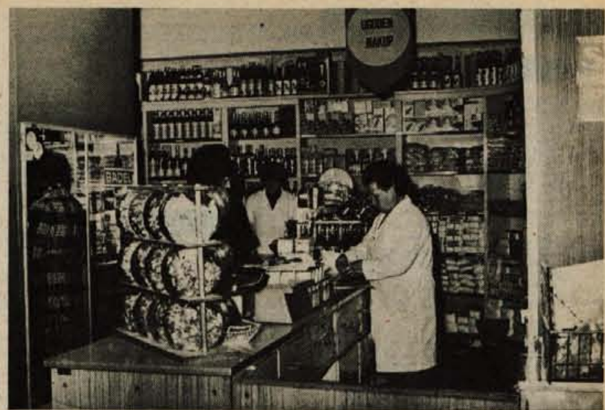
Trgovina na Zlatem polju ne ustreza več potrebam potrošnikov.