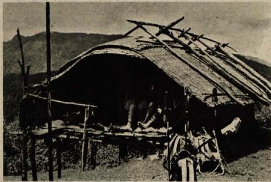
Botijevska koliba na grebenu Hurruru