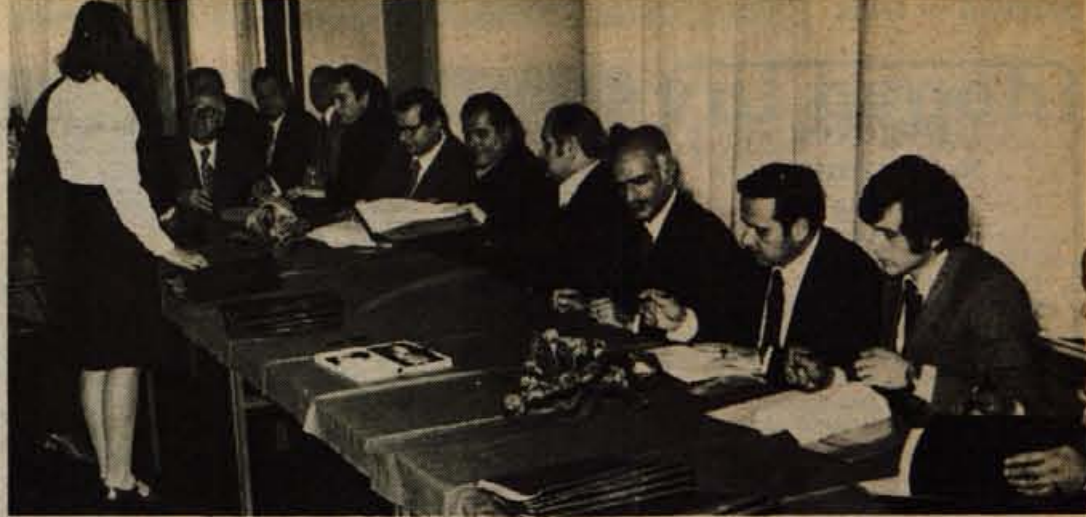
V torek, 30. decembra, je bil v prostorih hotela Transturist v Škofji Loki slovesen podpis samo upravnega sporazuma o ustanovitvi sestavljene organizacije združenega dela Alpetour ter štiri samoupravnih sporazumov o ustanovitvi delovnih organizacij: »Promet«, »Gostinstvo«, »Gorenjske žičnice« ter »Creina« - proizvodnja kmetijske mehanizacije s servisoma (-jg)