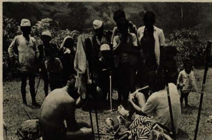
Navijači pri šahu (otroci)