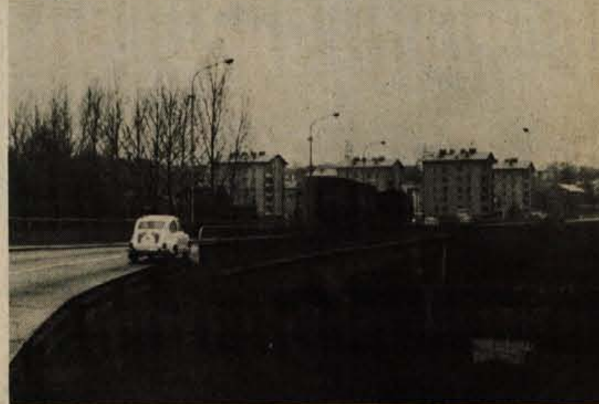
Most čez Soro v Medvodah je prvi železobetonski most v Jugoslaviji. Delavci gradbenega podjetja Gradis so ga zgradili v tem času pred 30 leti. Most razpetine 68 metrov in širine 9 metrov je bil predan namenu spomladi leta 1946.