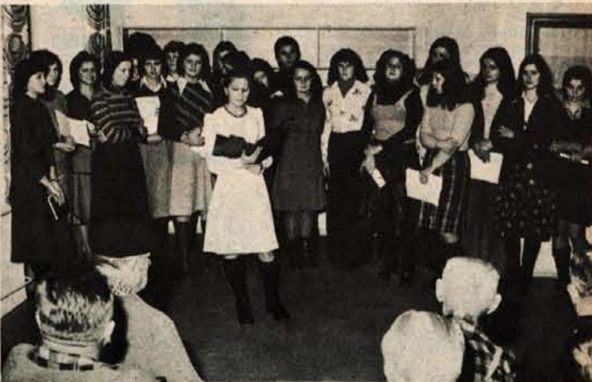
Ob novem letu so dijakinje Ekonomsko administrativnega centra iz Kranja obiskale oskrbovance v Domu Albina Drolca v Preddvoru.