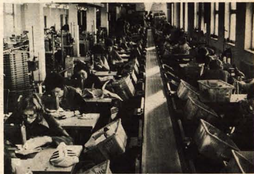
Planika v Zabreznici ima štiri trakove šivalnice in dva trakova prezovalnice, obrat pa nameravajo v prihodnje nekoliko razširiti

Zabreznikiška Planika se torej kar najbolj tvorno vrašča v jeseniški prostor. Z zdravimi notranjimi samoupravnimi odnosi se odpira navzven in kot enoten in homogen kolektiv v okviru sestavljene organizacije Planike dobro in uspešno gospodari. Probleme, ki se pojavljajo, rešuje sproti, s kar največ prizadevnosti in zagnanosti vseh in posameznika. Vsem zaposlenim, ki jim je glavni cilj večja produktivnost, modernizacija strojnega parka in čimhitrejši razvoj naploh, je dokaj jasno, na kakšen način bodo svoje načrte tudi dosegli. Tako kot zdaj ali pa še bolj zagrizeno se bodo na osnovi svoje nove samoupravne organiziranosti prizadevali, da se še bolj uveljavijo in utrdijo zaupanje domačega in tujega tržišča. D. Sedej