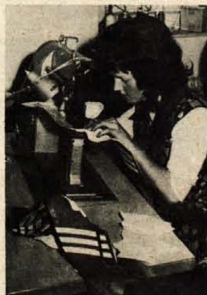
Zahtevnejše delo je šivanje, za katerega so delavke opravile strokovno šolo v Kranju in se izučile poklica.

V Planiki v Zabreznici skrbe za izpolnjevanje na delovnem mestu, letos imajo pet učencev v poklicni šoli, dve ženski pa se bosta po študiju zaposlili kot kontrolorki. Uredili so prehrano na delovnem mestu, skorajda nimajo problemov v varstvu otrok zaposlenih, saj je v Zabreznici celodnevna šola, za stanovanja pa prosi šest delavk. Do