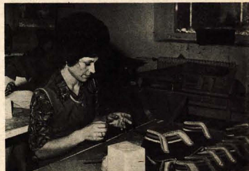
Obrat izdeluje zgornje dele za športno obutev, copate in čevlje iz platna, po tehnološkem postopku »potujejo« proizvodi iz prezovalnice do šivalnice.