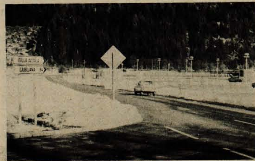
Delavci SGP Sava Jesenice in Cestnega podjetja Kranj so pred kratkim uredili oba odcepa obvoznice v Kranjsko goro. Na sliki: odcep proti hotelu Kom-pali.

Rok prijave je 15 dni po izidu v časopisu (zadnjem). Informacije osebno ali po telefonu 75029.