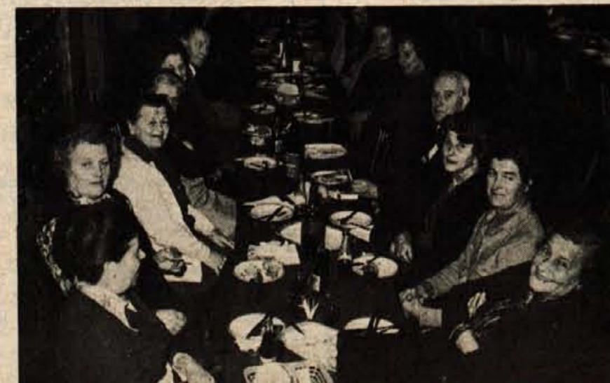
Nekaj dni pred koncem minulega leta je podjetje Živila Kranj pripravilo za 95 nekdanjih članov kolektiva sprejem. Na tem tradicionalnem sprejemu za upokojece so o razvoju govorili predstavniki podjetja, sledila je pogostitev in želja za srečno 1976. leto. - A. Ž.