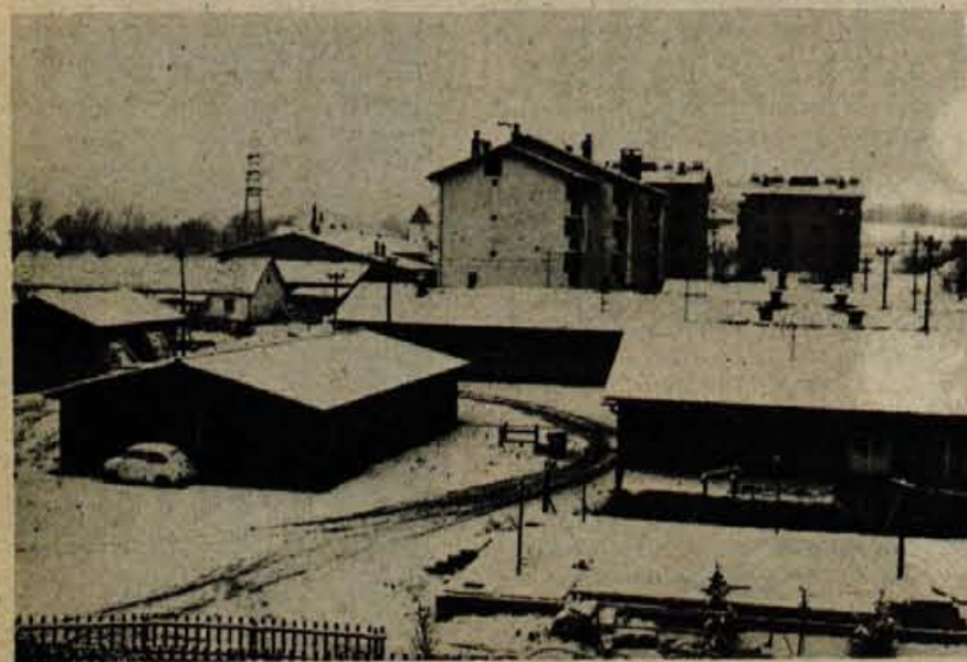
Naselje Zlato polje pod gorenjsko avto cesto in kranjsko obvoznico je komunalno še skoraj neopremljeno. Posebno slabe so ceste.

Nastop dela je možen takoj po izteku razpisa. Pismene prijave pošljite na naslov GIP Gradis TOZD Lesno industrijski obrat Škofja Loka, Kidričeva c. 56.