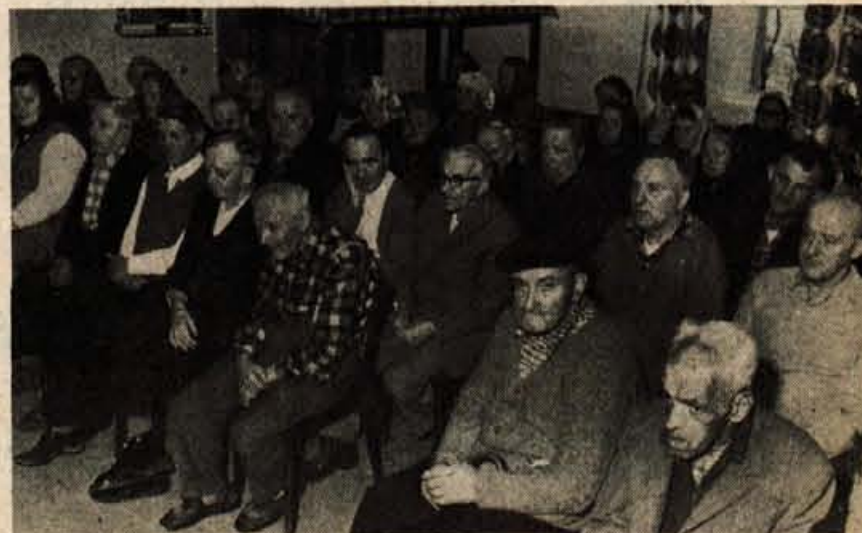
Oskrbovanci so z zanimanjem sledili kulturnemu programu.